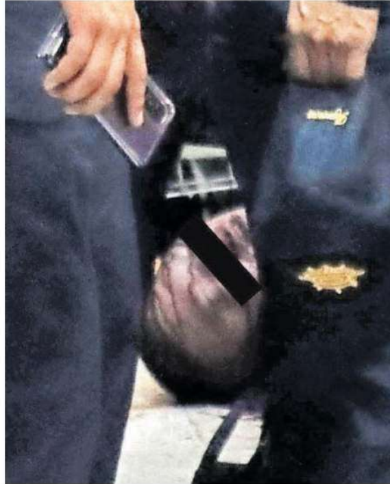
El sujeto quedó tirado en el piso con una lesión causada por la bala en la cabeza desde la que comenzaba a formarse un charco de sangre