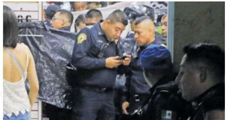
Policías se movilizaron al punto y al recorrer los pasillos observaron que en uno locales de calzado deportivo se encontraba un sujeto tirado en el piso