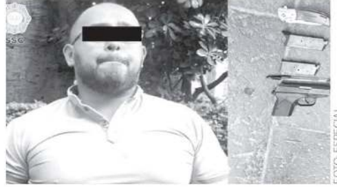
Lo atraparon cuando escapaba