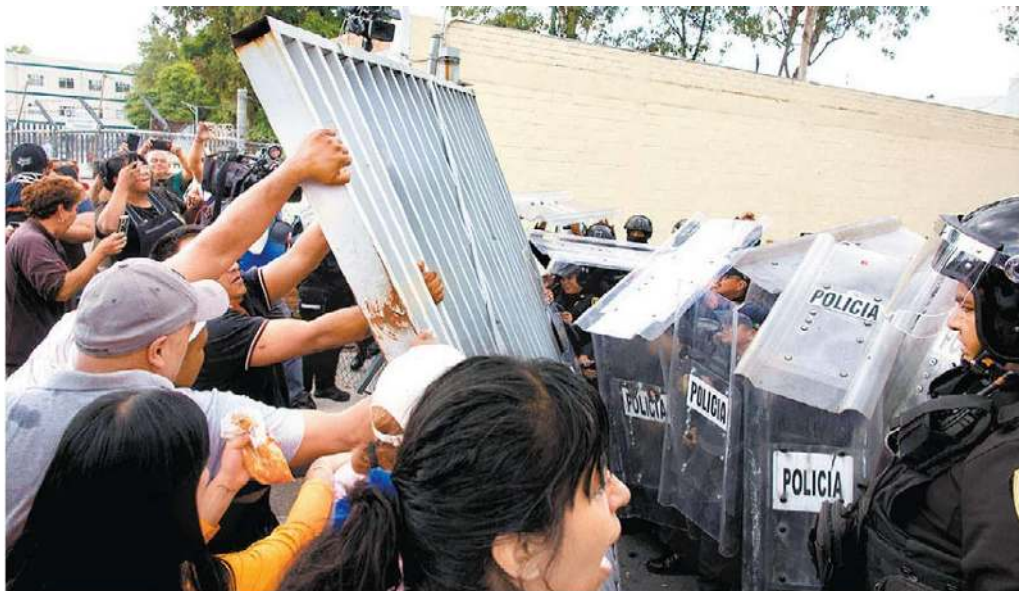
Familiares que esperaban información protestaron frente al penal.