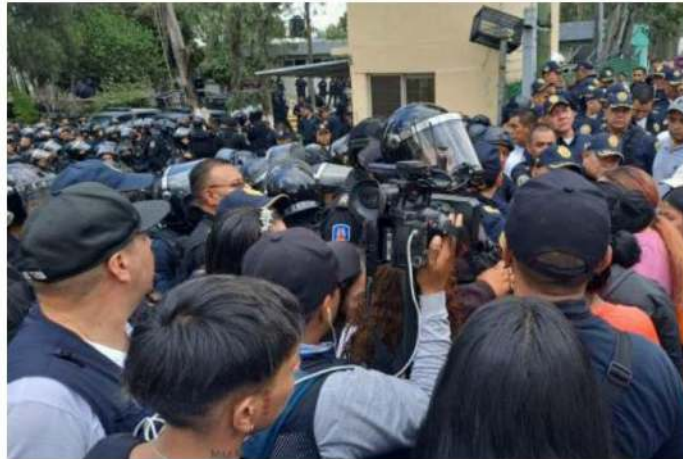
Familiares denunciaron que el sistema penitenciario de la capital se encuentra en pésimas condiciones.