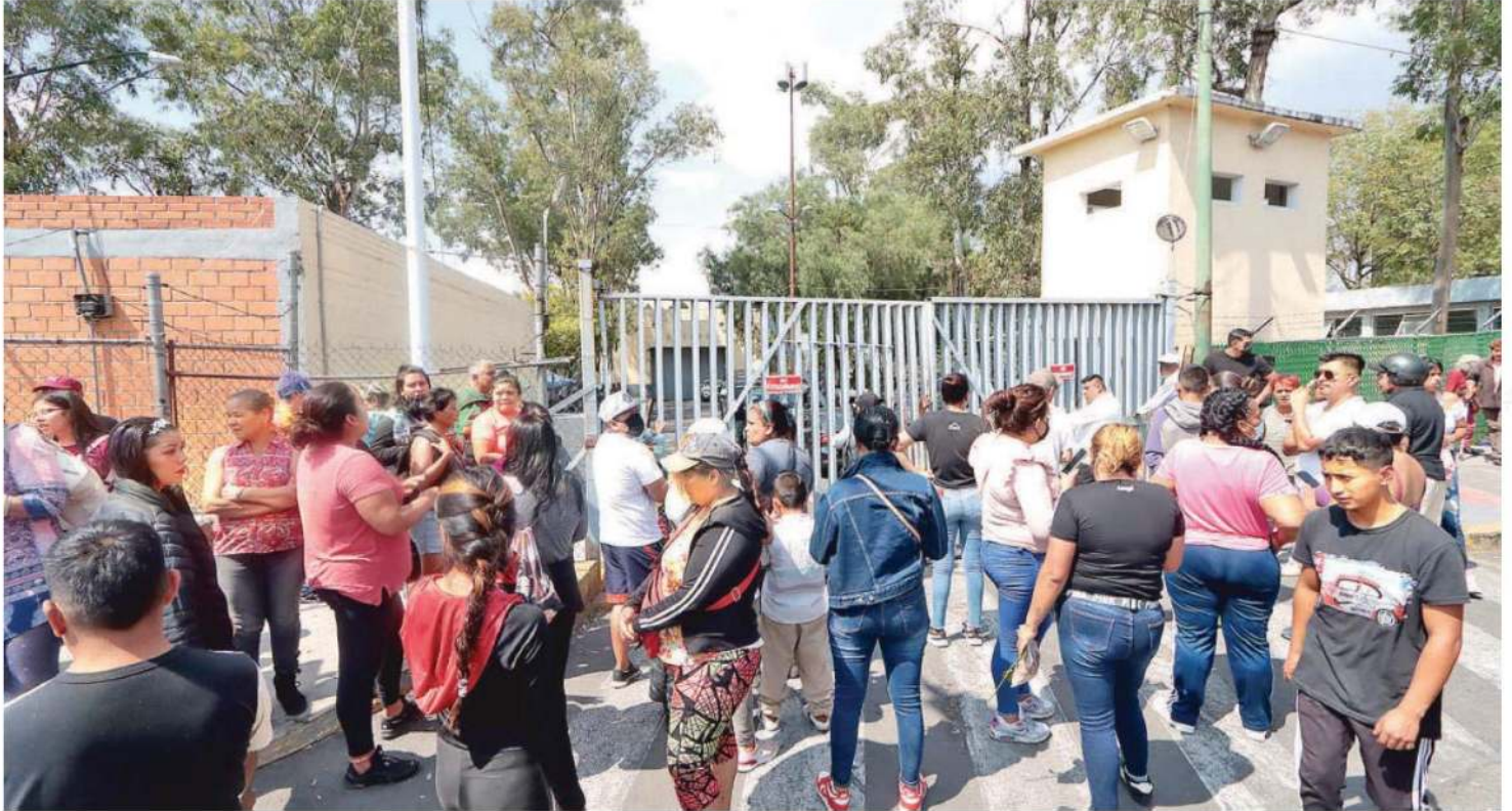
De acuerdo con información oficial, las acciones violentas tuvieron lugar aproximadamente a las 13:30 horas de este viernes, en los dormitorios 5, 6 y 7 del área de población