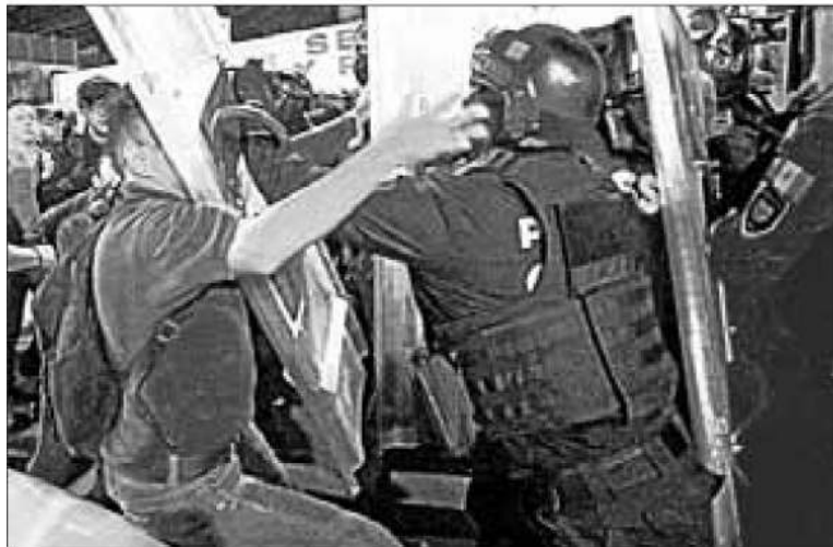
▲ Desde el mediodía, familiares de internos derrumbaron las rejas de acceso para exigir informes; por la noche continuaban las protestas para evitar traslados.