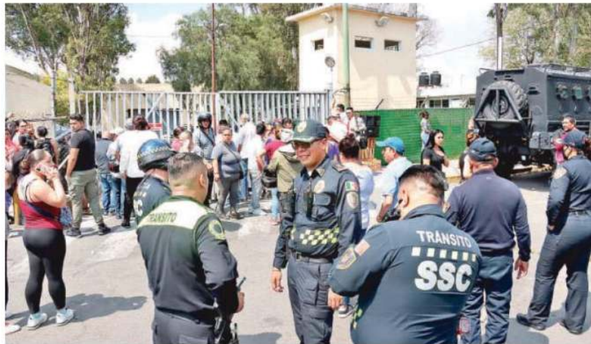
Un contingente de más de 200 elementos del Grupo Especial "Relámpagos" y del Agrupamiento Fuerza de Tarea "Zorros" se presentaron al lugar para controlar la situación, reforzados por integrantes de la GN