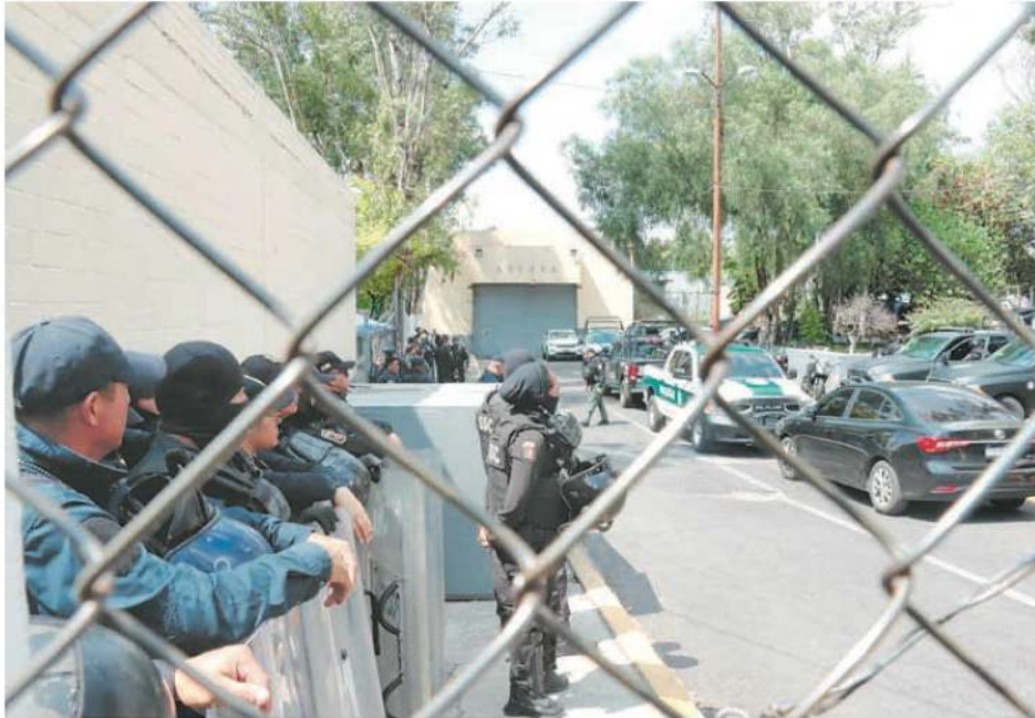
En el operativo participaron 200 elementos de la SSC