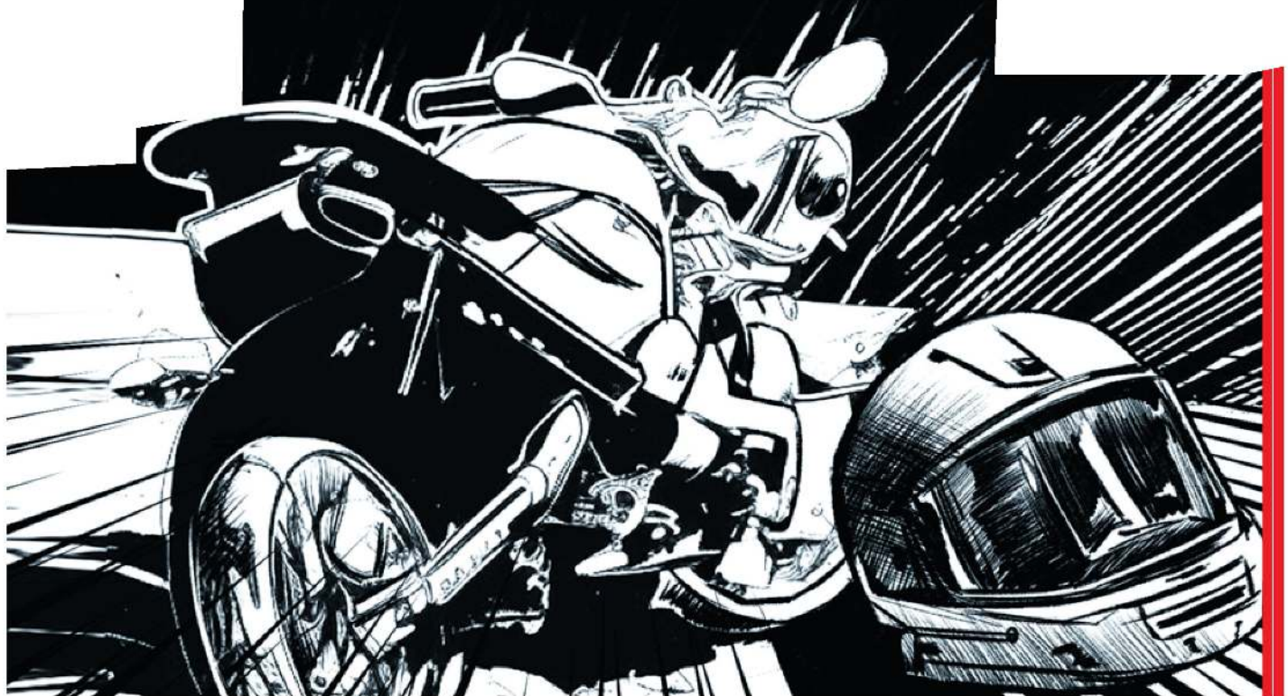
Ilustración: Jesús Sánchez