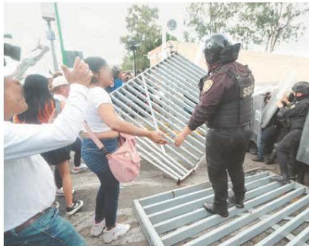
Familiares intentaron ingresar por la fuerza

POLICÍAS de la SSC participaron en el operativo de seguridad en el penal