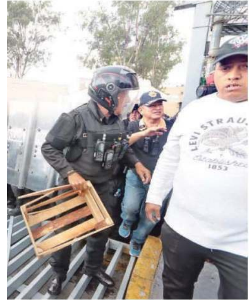
Luego que el hecho violento, familiares de internos se reunieron en la entrada para exigir información, pues aseguraban que había varios muertos