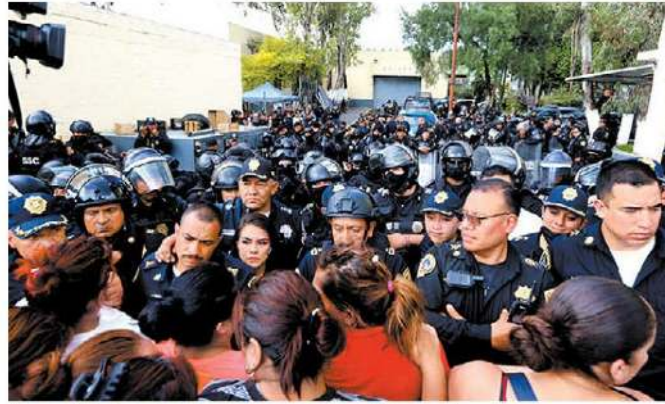
Autoridades desplegaron a 200 uniformados.

Al término de la entrega de obras correspondientes a la primaria Manuel Ruiz Rodríguez, en Gustavo A. Madero, dijo que el tema se abordará este sábado en la reunión de gabinete para reforzar acciones de seguridad. —