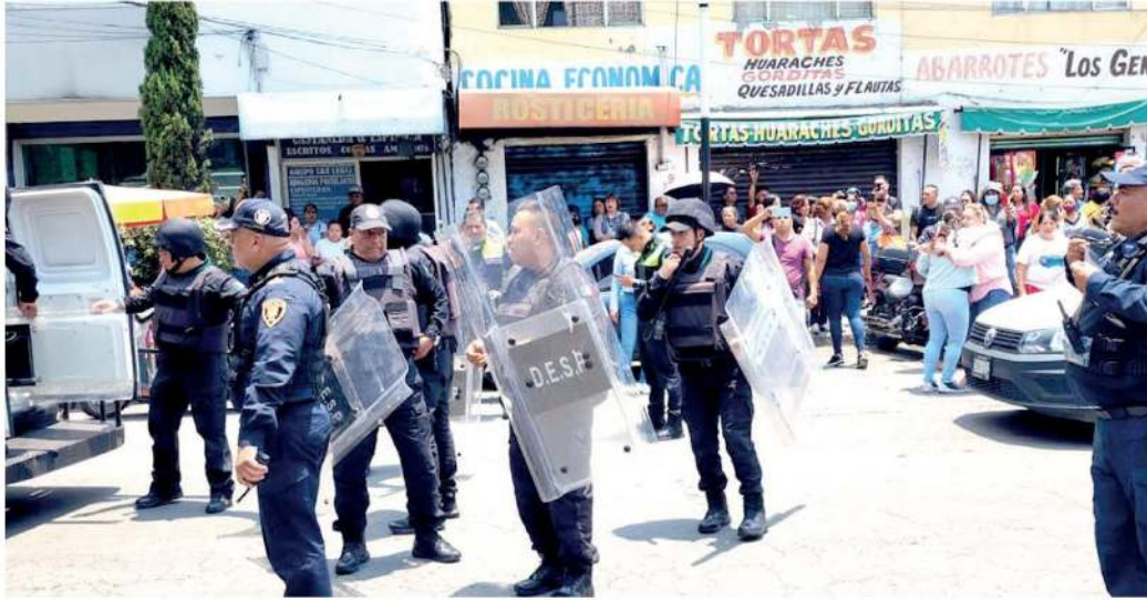
· Decenas de policías antimotines llegaron a controlar la situación