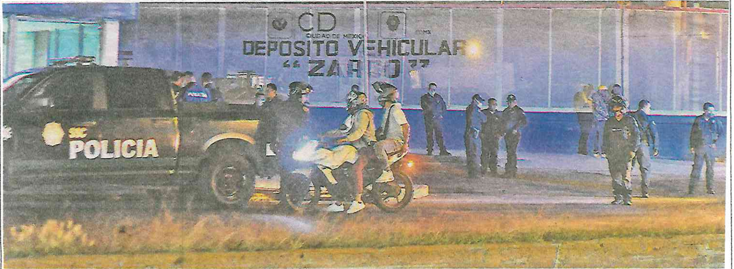
Los detenidos deberán acreditar la posesión de las motocicletas para recuperarlas