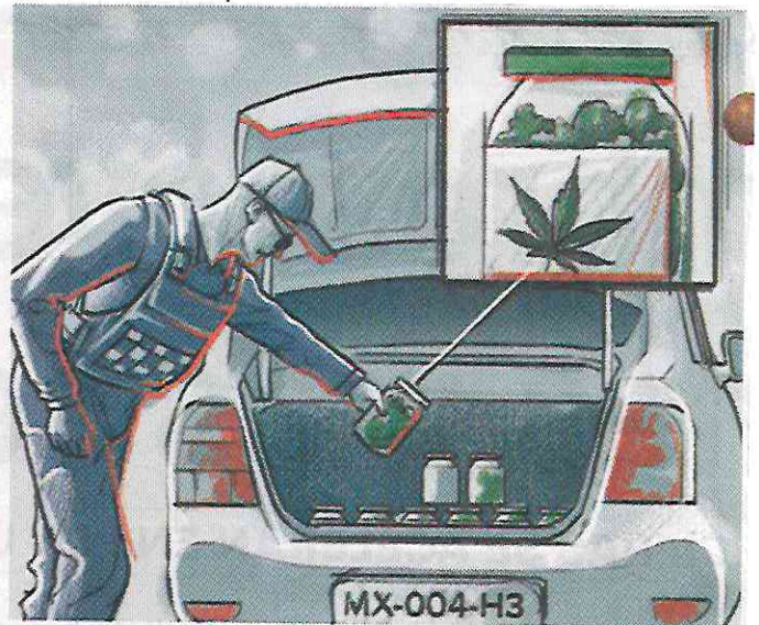
Ilustración: Horacio Sierra

En tanto, la patrulla fue remitida a la Fiscalía de