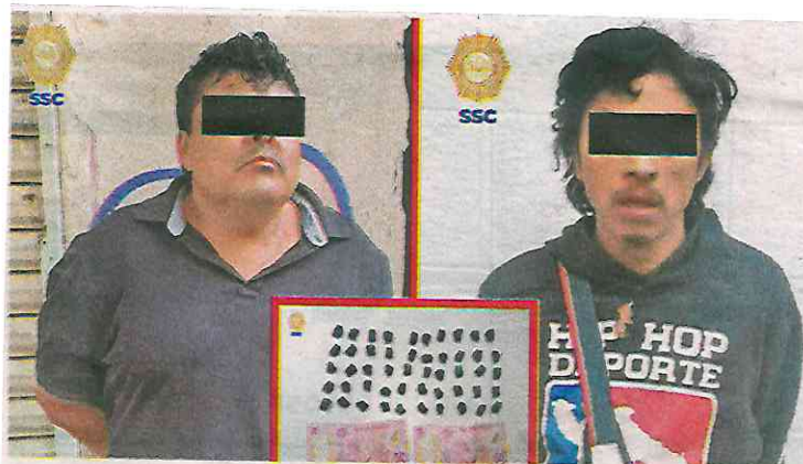
Estas personas serían parte de una banda dedicada a la compra y venta de droga en calles de Azcapotzalco

Por lo anterior los dos individuos de 39 y 46 años de edad, fueron detenidos e informados de sus derechos y juntos con el vehículo y lo asegurado, fueron puestos a disposición del agente del Ministerio Público, quién determinará su situación legal.