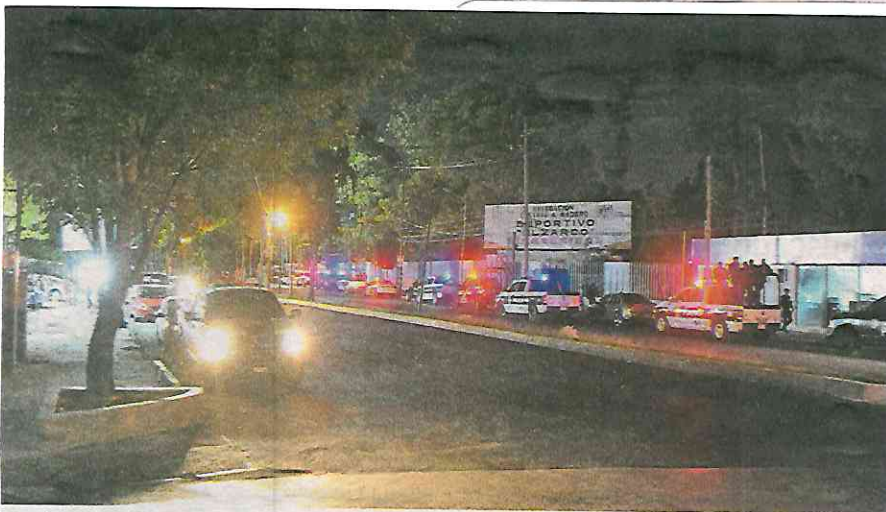
Se desplegó un dispositivo preventivo por parte de agentes de la Subsecretaría de Control de Tránsito y de policías de la SSC de la SSC

La SSC recuerda que la Ley de Cultura Cívica, señala en el artículo 28 del Título Tercero, que quien participe, organice o induzca a otros a realizar estas acciones será presentado ante un Juez Cívico quien fijará la multa, el arresto o trabajo comunitario, de acuerdo con el artículo 31 de la misma ley.