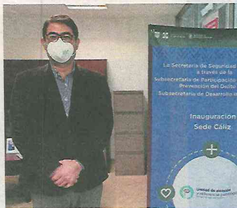
Los pacientes toman terapia con psicólogos que también tienen formación policiaca.