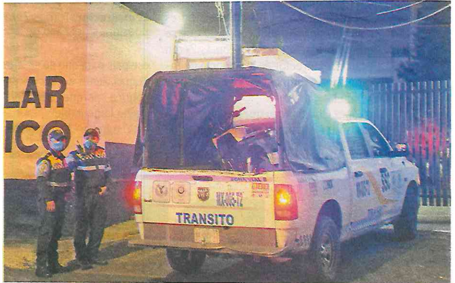
A diferentes corralones fueron trasladadas las motocicletas

parte de agentes de la Subsecretaría de Control de Tránsito, así como de los policías sectoriales de la SSC.