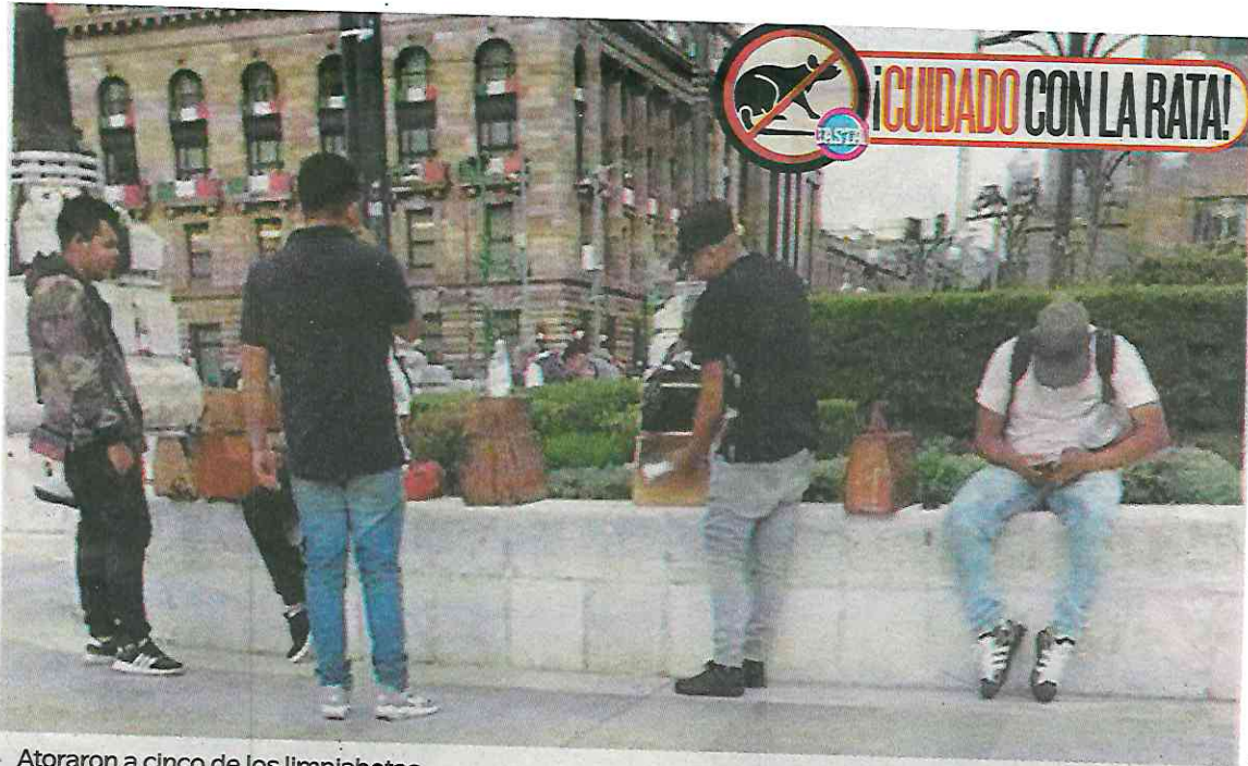
Atoraron a cinco de los limpiabotas