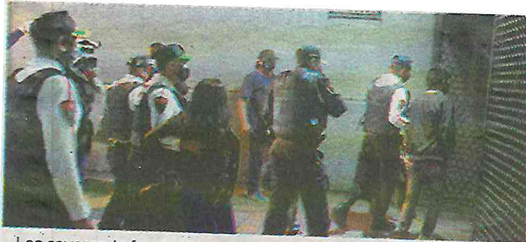
Les cayeron in fraganti

y otras cosas de valor, cuando fueron sorprendidos por elementos de la Policía Bancaria encargada de la seguridad al interior del sistema de Transporte Colectivo Metro, por lo que procedieron a detenerlos