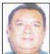
Por Augusto Corro

El próximo 18 de septiembre, en Morena, lanzarán la convocatoria para que se registren aquellos que aspiran a gobernar la Ciudad de México (CDMX).