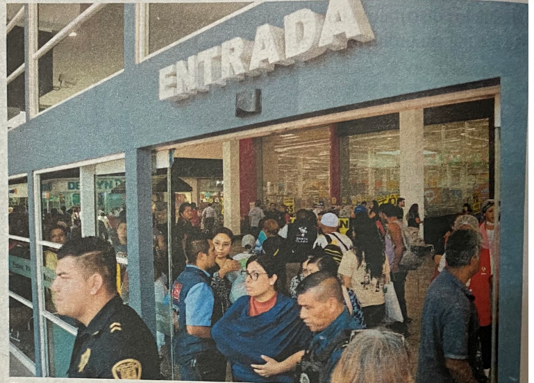
El personal de la tienda, así como los clientes fueron evacuados mientras se llevaban a cabo los trabajos por parte de peritos de la FGI de la CdMx

Tras abrir las puertas de inmediato revisaron a las víctimas, nada pudieron ha-