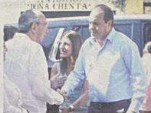
Anunció su intención de ir por la CDMX