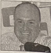
Por Víctor Sánchez Baños

- El cachorro revolucionario con ventaja - Brugada y Rubalcava, el segundo sitio - Mario Delgado y Monreal, bajos en encuestas - Los partidos van a la segura y sin errores