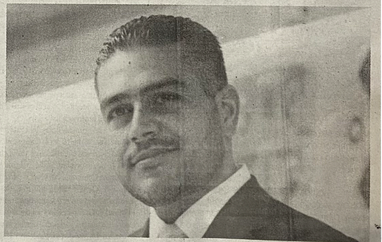
Desde el principal despacho de Palacio Nacional, no ven mal a García Harfuch.

poderydinero.mx vsb@poderydinero.mx @vsanchezbanos