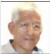
Por Ángel Soriano

Desde las más remotas comunidades hasta las más modestas escuelas y grandes congregaciones del país y del extranjero, cada año el 15 de septiembre es día de fiesta nacional y de celebración, lo mismo que en los domicilios y lugares de reunión de todo tipo, por lo que los poderes Legislativo y Judicial excluidos por el Ejecutivo para la celebración en Palacio, podrán dar su propio Grito.