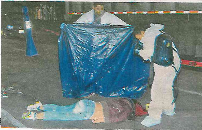
Ambas repartidoras iban a bordo de una moto cuando fueron embestidas, una murió

Para cuando paramédicos del Escuadrón de Rescate y Urgencias Médicas (ERUM), arribaron al lugar del accidente, confirmaron el deceso de una de ellas, sin embargo, la otra joven que se encontraba tirada, desorientada y cubierta de sangre fue auxiliada y tras ser estabilizada, fue trasladada al hospital para recibir la atención médica necesaria.