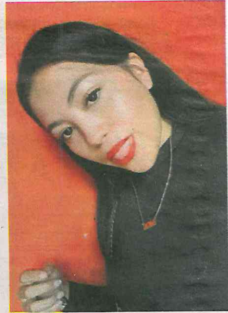
Ambos se esfumaron , ahora la Fiscalía ofrece jugosa recompensa

za investigaciones ministeriales, periciales, además de que agentes de la Policía de Investigación han interrogado a empleados y vecinos de El Barquito, así como de testigos de los acontecimientos; sin embargo, hasta el momento no aparecen los dos jóvenes, que, de acuerdo con las investigaciones, no se conocían y viven en diferentes puntos de la capital del país.