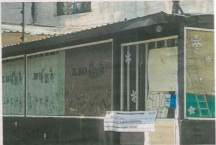
Ese día

Este miércoles así fue publicado en la Gaceta Oficial de la capital, donde tam-