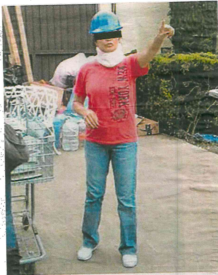
Miss Moni , durante las labores de rescate de las víctimas, tras el sismo del 19 de septiembre de 2017