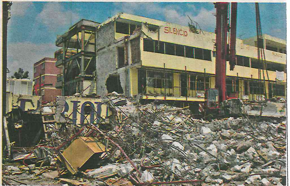
HOMICIDIO CULPOSO. Una parte del Colegio Rébsamen colapsó en el sismo del 19-S, debido a un departamento construido de forma ilegal sobre el inmueble.

“Como mamá me siento satisfecha, porque finalmente se le probó todo y conforme a la ley, lo que ganamos fue limpio, a diferencia de lo que ella hizo con su corrupción junto