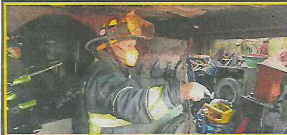
El incendio fue provocado por un cortocircuito.

Confusión en reporte provoca demora de bomberos, quienes ya no pudieron salvar a las víctimas, que quedaron atrapadas