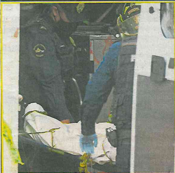
El cadáver fue levantado tras controlarse el fuego.