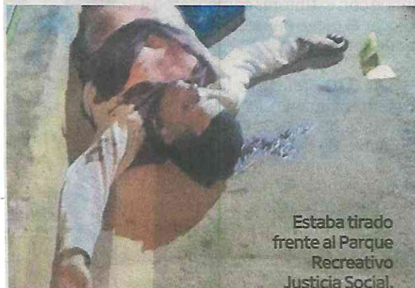
Estaba tirado frente al Parque Recreativo Justicia Social.

Rescatistas ratificaron el deceso del sujeto, de entre 25 y 30 años, quien tenía 17 tajaduras a la altura del tórax y dos más en el muslo derecho. Peritos lo trasladaron a la morgue como desconocido.