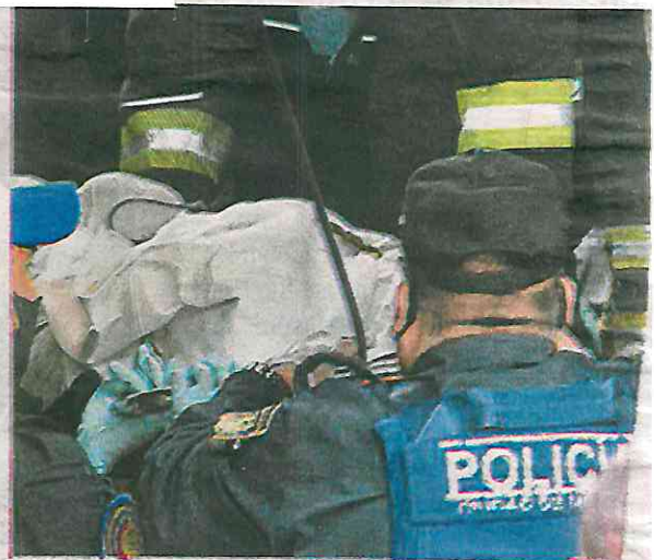
Los socorristas sólo certificaron la muerte por envenenamiento