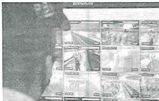
- Habrá mayor vigilancia

En los próximos días se sumará la activación del centro de monitoreo ubicado en el conjunto Pino Suárez