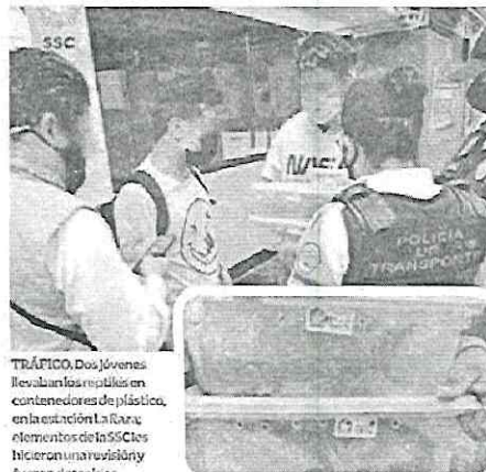
TRÁFICO. Dos jóvenes llevaban los reptiles en contenedores de plástico, en la estación La Raza. Elementos de la SSC les hicieron una revisión y fueron detenidos.