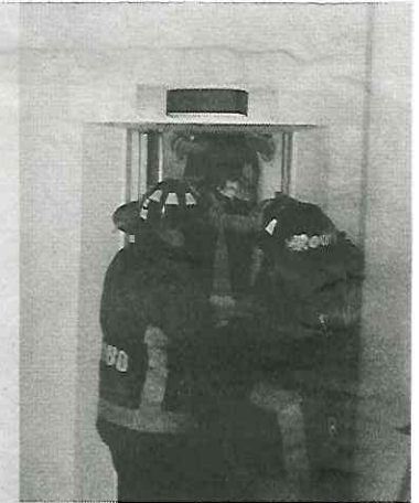
Bomberos en acción

Paramédicos atendieron a los tres policías intoxicados y no se reportaron civiles lesionados.