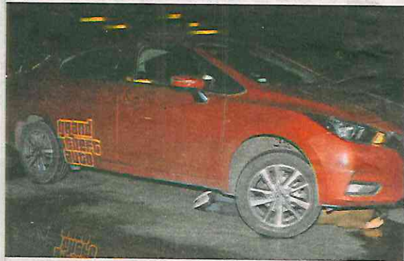
Después de presuntamente aventarse, el cuerpo del sujeto quedó debajo del auto

Policías de la Secretaría de Seguridad Ciudadana (SSC), llegaron al lugar de los hechos y aseguraron al conductor del vehículo para ponerlo a disposición del Agente del Ministe-