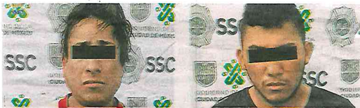
Ambos, presuntos narcomenudistas, fueron detenidos en flagrancia