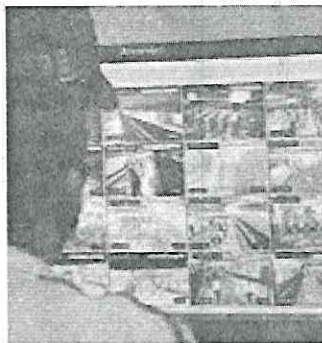
SEGURIDAD. Están equipados con unidades de cómputo enlazadas a las cámaras de vigilancia del Metro.

El STC implementa una serie de acciones encaminadas a inhibir la incidencia delictiva, con lo cual desde el inicio de la administración se registra una disminución del 73% en los casos de robo al interior de las instalaciones del Metro. /REDACCIÓN