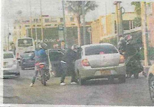
Decenas de atracos motorizados

A raíz de los operativos de revisión a vehículos implantados por la SSC se ha detectado que más del 50% de las motocicletas enviadas a corralones, no son reclamadas por los supuestos dueños, porque tienen alguna irregularidad.