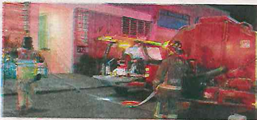
Uno a uno los inquilinos abandonaron el edificio humeante

Gracias a la oportuna acción de los policías, una mujer de 41 años de edad y una menor de 12, fueron evacuadas y atendidas por una intoxicación, ya que habían inhalado el humo que se desprendía del cubo del elevador.