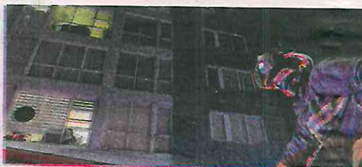
Una vez llegaron los vulcanos y con apoyo de la policía todo quedó tranquilo