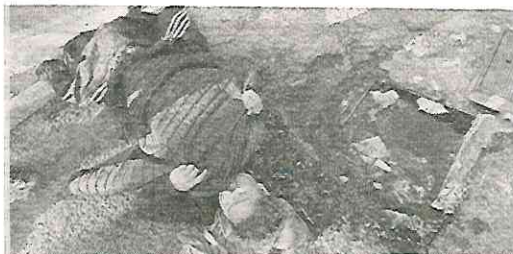
Otro nuevo caso