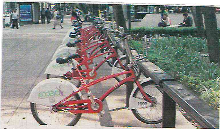
Bicicletas ya se volvieron un objeto de deseo para ladrones

la detención de un hombre que se dedicaba al robo de ecobicis y las comercializaba en redes sociales por un costo de mil 800 pesos.