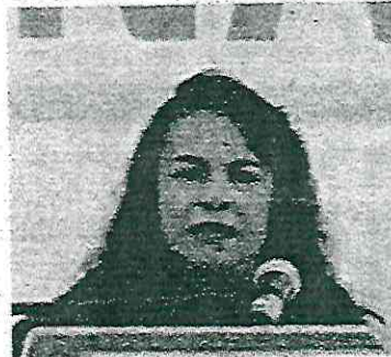
· Solo actúa cuando quiere

· Semanalmente, el ONC reporta 25.41 carpetas de investigación por robo a transeúnte