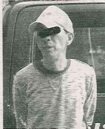
Ya está en chirona

Al investigar si el sujeto cuenta con antecedentes delictivos fue identificado como el mismo ladrón que en dos casos asaltó a otras personas.