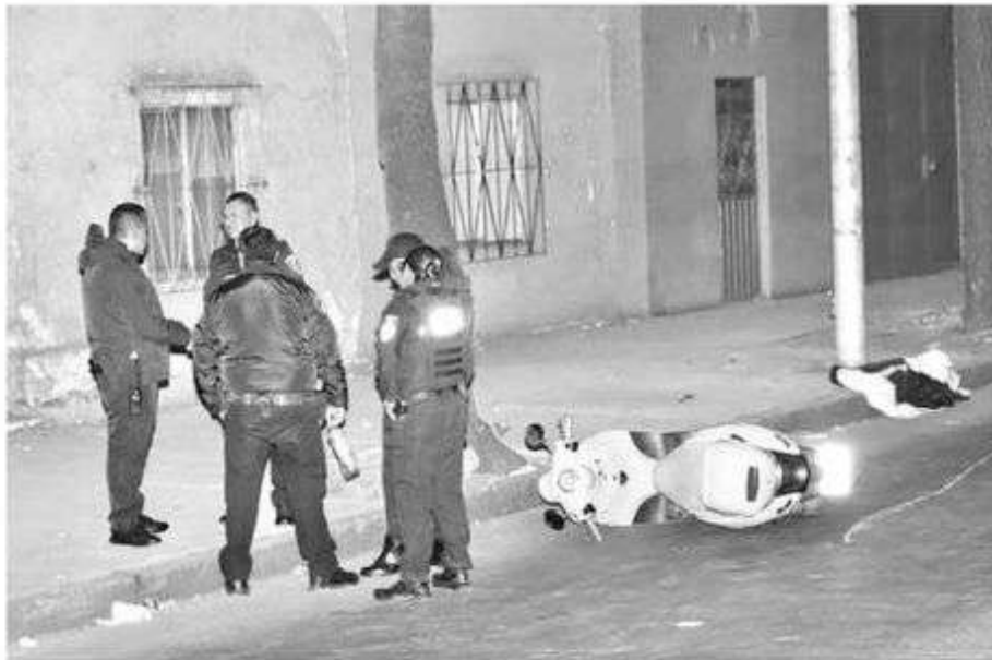
Homicidios asignatura pendiente en la demarcación