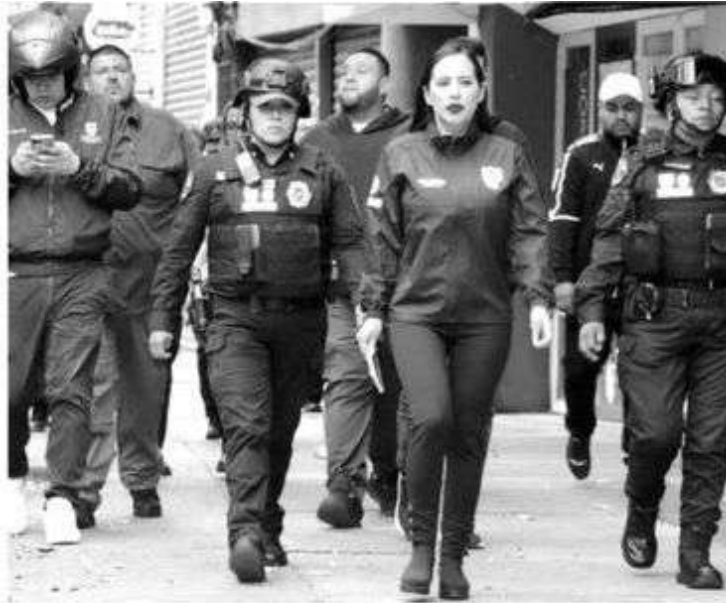
Edil encabeza operativos fallidos