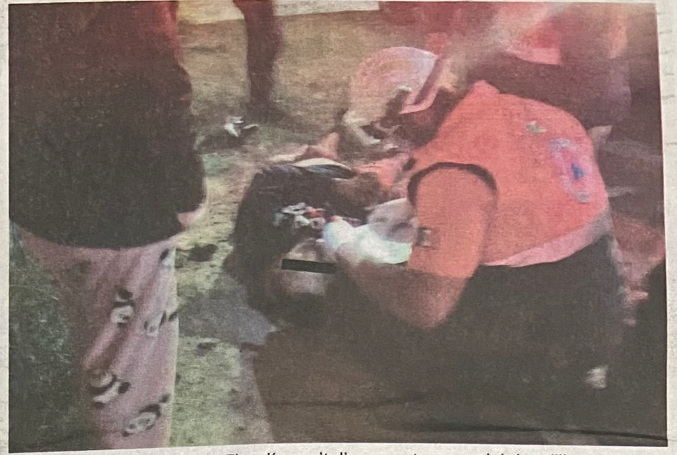
El sitio donde quedó el cuerpo sin vida de la víctima fue resguardado por los uniformados hasta el arribo del personal de la Fiscalía capitalina, que tras concluir las diligencias trasladaron el cadáver al anfiteatro