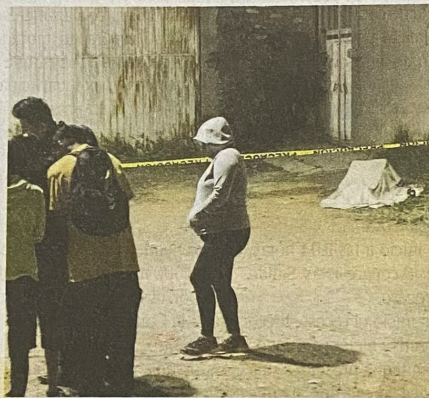
Autoridades ministeriales, periciales y agentes de la Policía de Investigación de la FGJ de la CDMx continúan con las pesquisas a fin de identificar a este hombre

La madrugada de este jueves, vecinos del callejón de la primera cerrada de Benito Juárez encontraron tirado sobre la tierra a un costado de una fábrica de aceros a un hombre de aproximadamente 45 años de edad con varios golpes en la cara y cuerpo, así como atado por