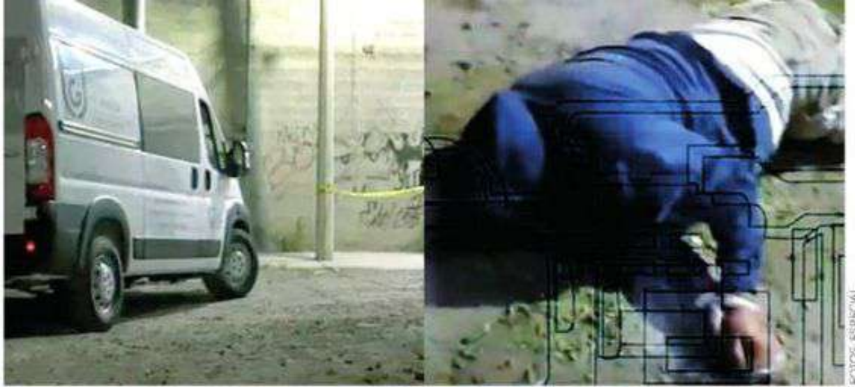
Presuntamente el móvil del crimen es un asalto