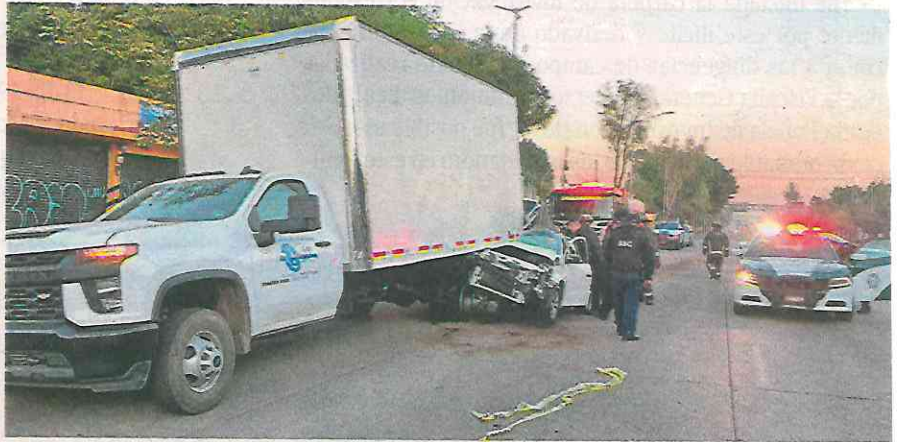
La zona fue acordonada y resguardada durante varias horas a la espera de personal de Investigación Forense

Al llegar justo al cruce con Poniente 115 se impactó en la parte traseras de una ca-