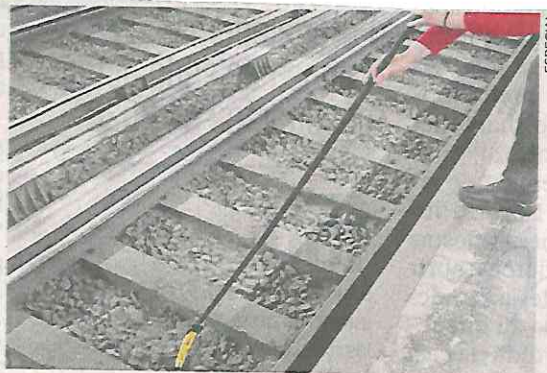
Esta semana, el Metro auxilió a un usuario a rescatar su teléfono de las vías de la estación Hidalgo.

El Sistema de Transporte Colectivo (STC) Metro informó que en lo que va del año rescató 37 objetos que cayeron a las vías del tren, de los cuales