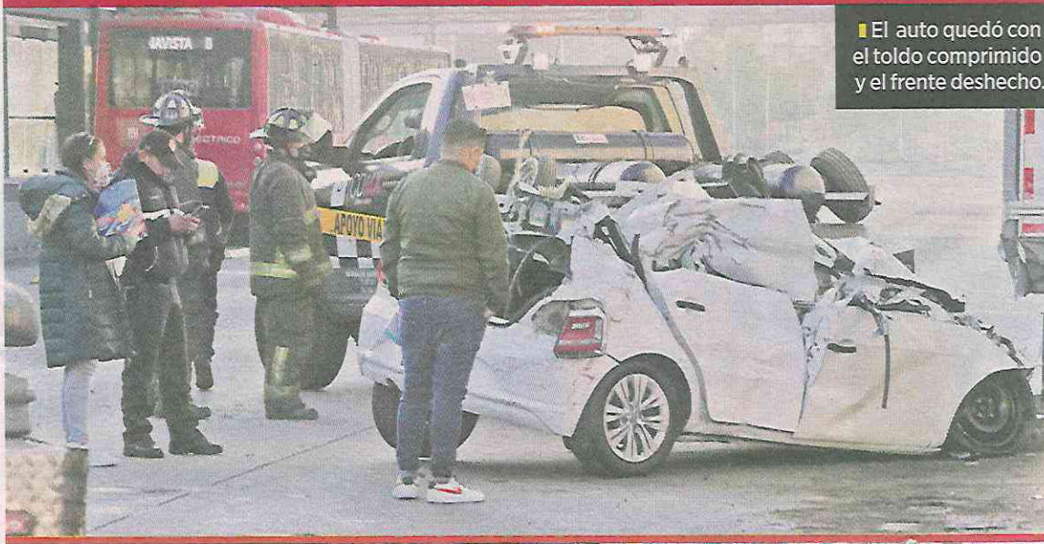
■ El auto quedó con el toldo comprimido y el frente deshecho.