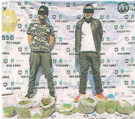
Policías se percataron de la presencia de dos sujetos que manipulaban una bolsa grande de plástico

Resultado del cruce de información se tuvo conocimiento que el detenido de 34 años, registra seis ingresos al Sistema Penitenciario de la Ciudad de México, por Delitos contra la salud en los años 2009, 2014, dos ocasiones en el año 2020 y una en 2021; y por Homicidio calificado en grado de tentativa en el año 2012.