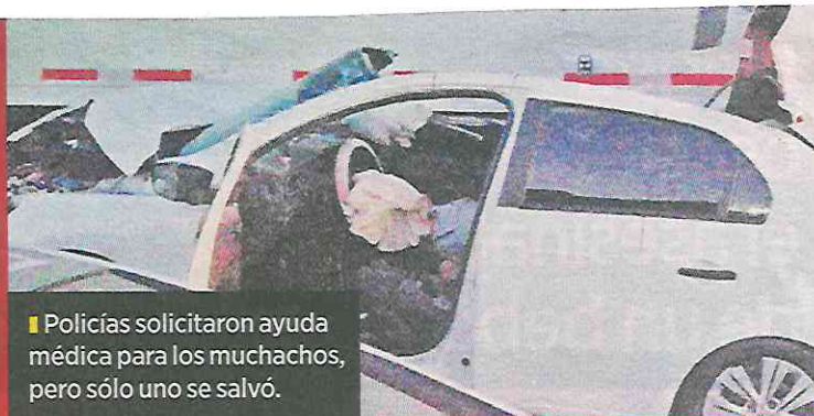
■ Policías solicitaron ayuda médica para los muchachos, pero sólo uno se salvó.