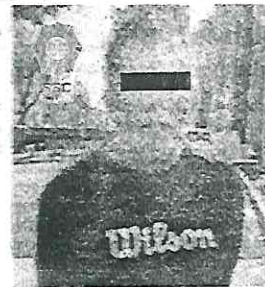
En atención a la denuncia, el posible responsable fue interceptado rápidamente.

En la misma alcaldía y quién después de subir a las unidades toman la avenida de Los Insurgentes para huir.