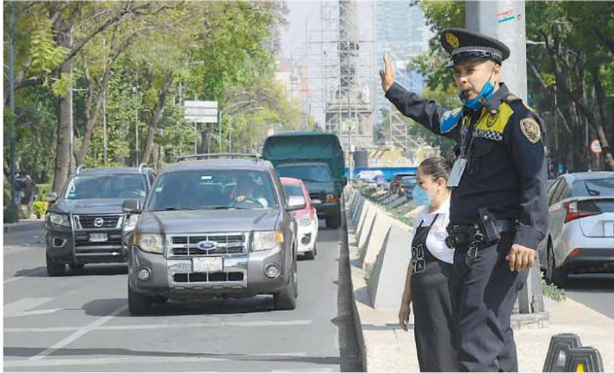
En la Ciudad de México sólo mil 635 policías están habilitados para emitir boletas por infracciones de tránsito