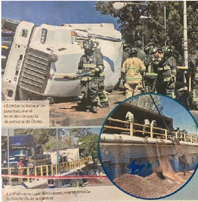
Bomberos trabajaron para traspalar el lepetate con ayuda de personal de Obras.