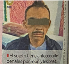
El sujeto tiene antecedentes penales por robo y lesiones.

El detenido cuenta con cuatro ingresos al Sistema Penitenciario de la capital, entre los años 1993 y 2003, según datos de la SSC.