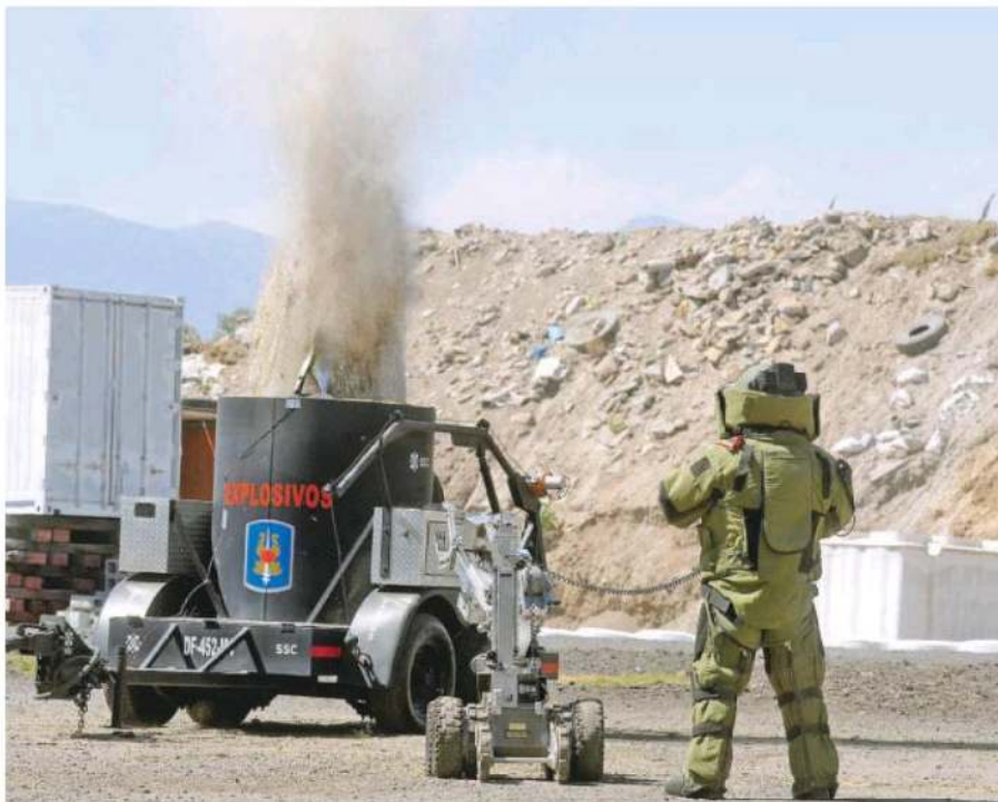
Cuerpo élite de la Secretaría de Seguridad Ciudadana (SSC) de la Ciudad de México