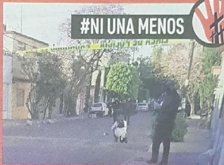
Los gritos de la pareja despertaron a los vecinos.

En la calle hallaron el cuerpo ensangrentado de la mujer. Ella sólo