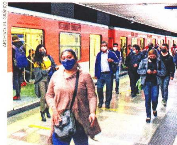
ARCHIVO. EL GRÁFICO

POR CIENTO de quienes fueron llevados ante juez cívico, fumaron en el Metro.