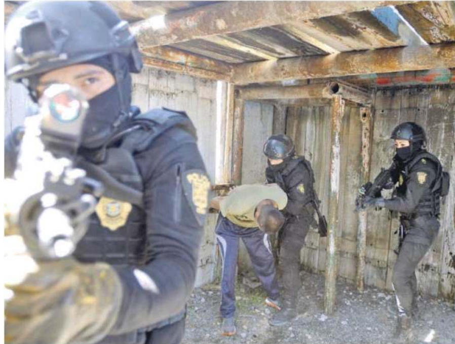
El grupo Zorros está conformado exclusivamente por policías preventivos que tuvieron que estudiar en la Unipol y prestar sus servicios operativos en un mínimo de dos años