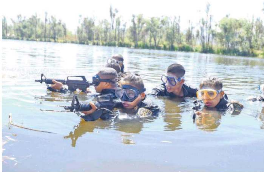
Los extenuantes entrenamientos a los que son sometidos, se extienden varias horas al día en escenarios extremos