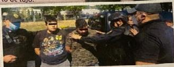
LA BANDA Tenía en su poder armas, drogas y joyas.