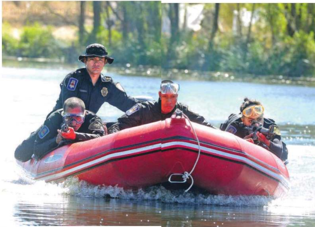
La alta preparación con la que cuenta el agrupamiento, los hace una unidad de élite

Durante las últimas tres semanas, han tenido una destacable participación en el combate contra la delincuencia organizada, que llevó al decomiso de más de dos toneladas de cocaína y la detención de varios presuntos narcotraficantes