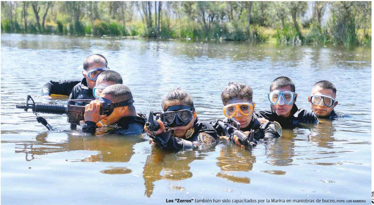
Los "Zorros" también han sido capacitados por la Marina en maniobras de buceo.