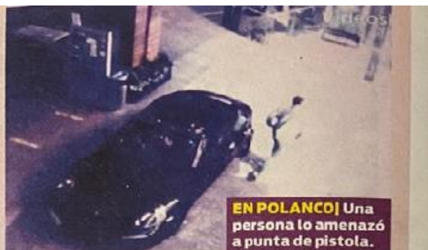
EN POLANCO Una persona lo amenazó a punta de pistola.