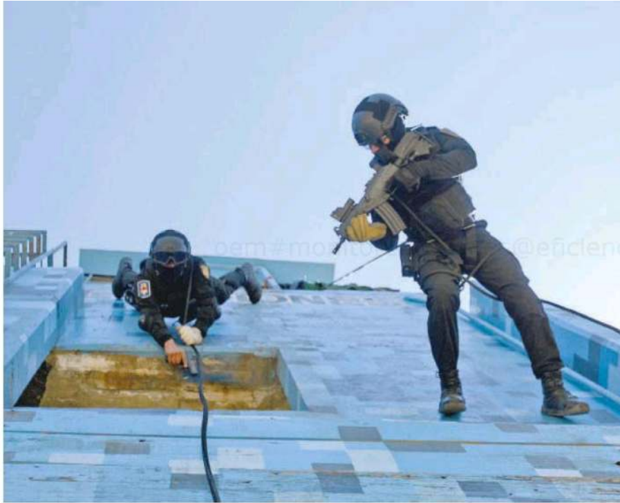
Los Zorros deben demostrar carácter y habilidades físicas, así como emocionales para poder lidiar con el estrés en situaciones de riesgo