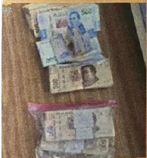
Los sujetos portaban una mochila con fajos de billetes de diferentes denominaciones.