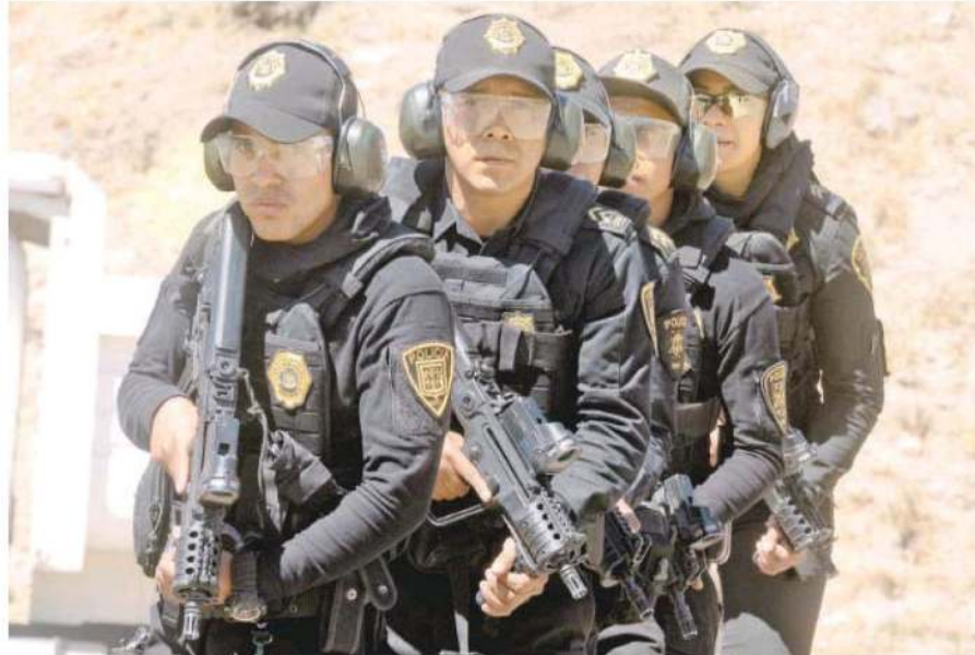
Cuerpo élite de la Secretaría de Seguridad Ciudadana (SSC) de la Ciudad de México

Antes de ingresar al Curso Básico de Fuerza de Tarea, me encontraba en la Subsecretaría de Control de Tránsito realizando infracciones a los automovilistas. Yo quisiera poder pertenecer a este grupo, porque es el mejor de la Secretaría y donde se encuentran policías totalmente capacitados”