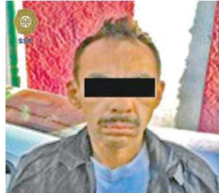
El detenido de 53 años de edad cuenta con antecedentes penales.

Los paramédicos que arribaron al lugar, diagnosticaron sin signos vitales por motivos a determinar a la mujer; derivado de ello, los uniformados acordonaron la zona y dieron parte a las autoridades para el arribo de los servicios periciales.