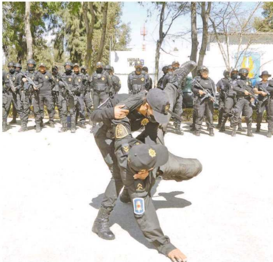
Combate cercano cuerpo a cuerpo