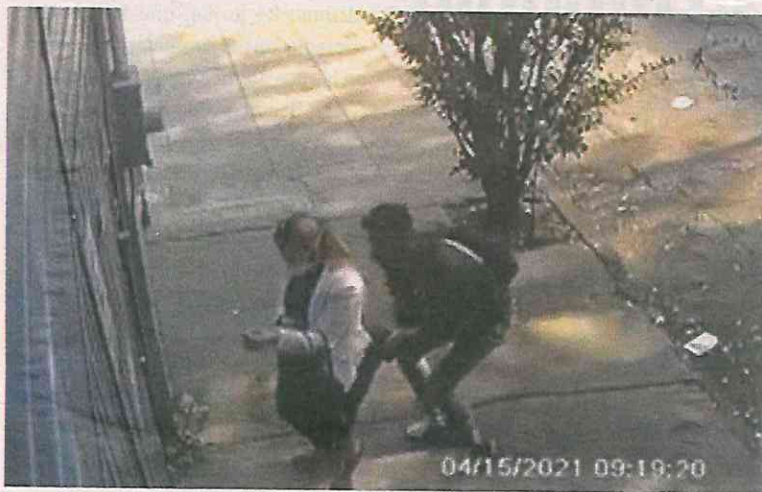
Ya se investiga la identidad del agresor.

“En seguimiento a un video que circula en redes sociales, donde se percibe la agresión sexual de la que fue víctima una mujer en calles de la colonia Portales, alcaldía Benito Juárez, #FGJCDMX inició una carpeta de investigación, además de que brinda acompañamiento a la afectada”, se escribió en twitter.