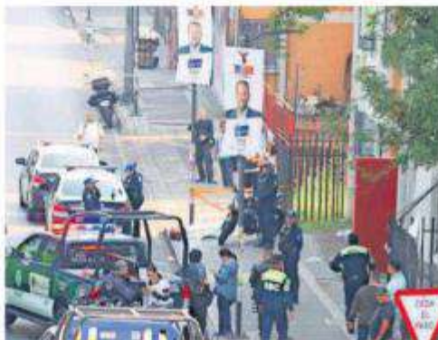
Cuerpos de emergencia llegaron al punto para resguardar el perímetro y brindar los primeros auxilios a la víctima, pero tras una pronta revisión por parte de paramédicos solo pudieron confirmar que ya no contaba con signos vitales.

Un motociclista perdió la vida al derrapar y golpear un poste de alumbrado público cuando circulaba por calles de la Colonia Unidad Habitacional Vicente Guerrero en la alcaldía Iztapalapa.