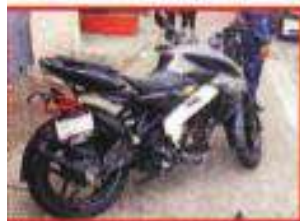
La Bajaj Pulsar 200 color blanco y negro tenía placas 9L2DY.