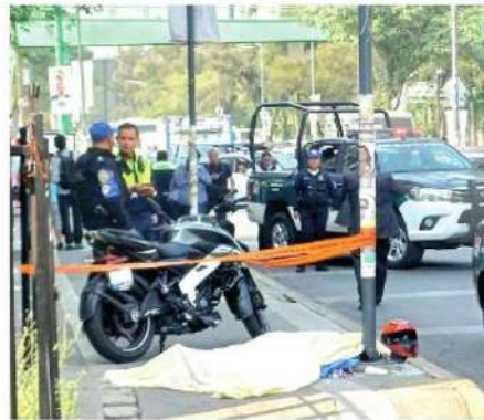
Otro biker que termina sin vida

El presunto responsable asesinó a su prima porque había abusado de ella sexualmente y lo iba a denunciar con la policía