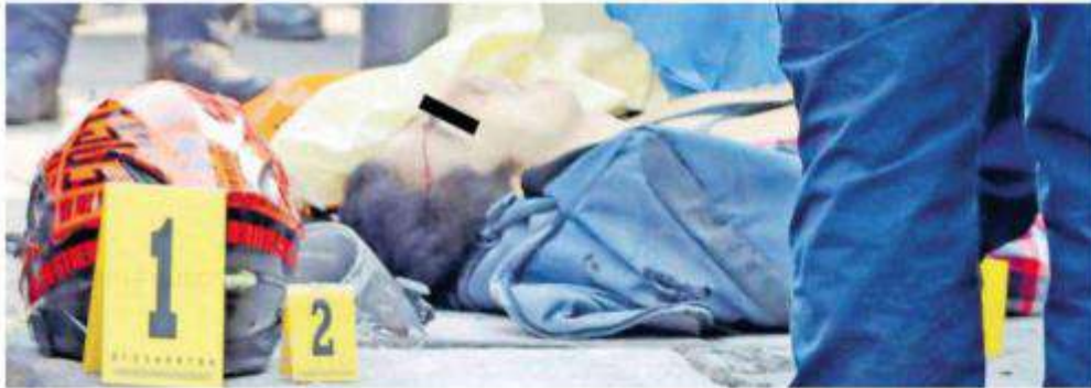
Transeúntes corrieron para tratar de ayudar al biker, el cual tenía una herida en la frente y no respondía a los llamados