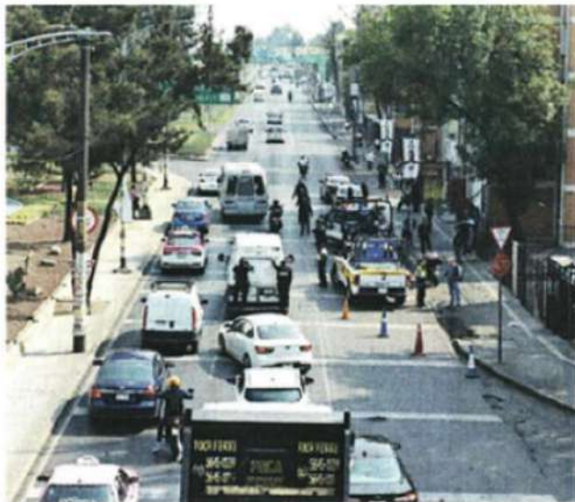
El accidente ocurrió en Avenida Antonio Soto y Gama, Unidad Habitacional Vicente Guerrero, en la Alcaldía Iztapalapa.

Durante los peritajes, algunos colonos se acercaron al acordonamiento, pero nadie lo identificó, pues no les permitieron observar el rostro de la víctima.