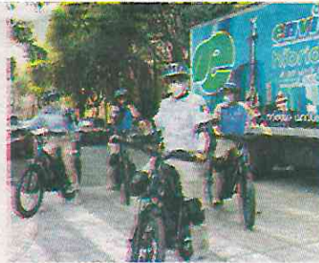
· Policía de gran nivel

De acuerdo al organismo de turismo mundial, la presencia nacional de una Policía Turística en México, además de brindar seguridad y bienestar al turismo