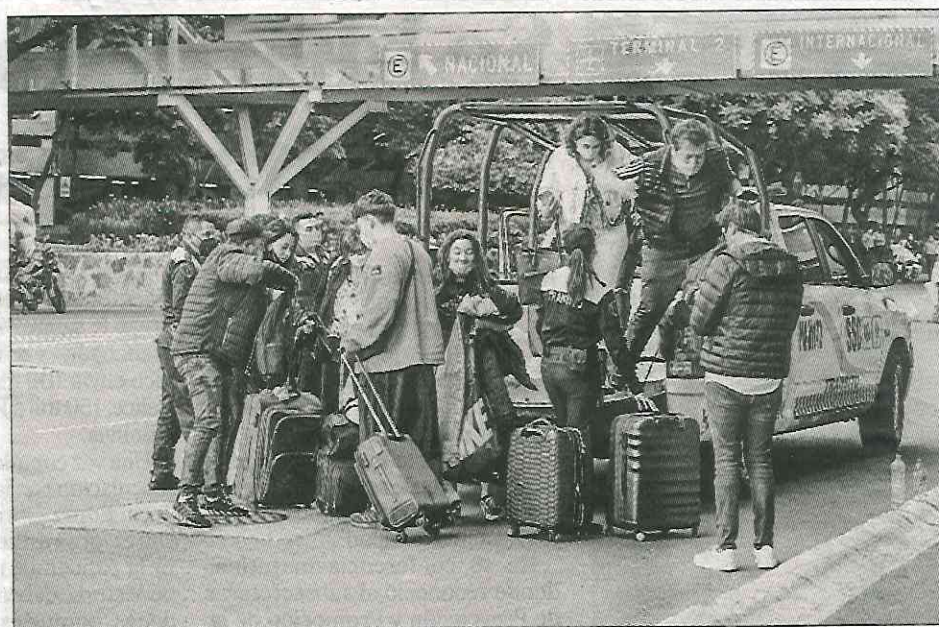
▲ Padres de niños con cáncer bloquearon el acceso de automovilistas a la Terminal 1 del Aeropuerto Internacional de la Ciudad de México (foto izquierda). A la derecha, viajeros son trasladados en vehículos de la Secretaría de Seguridad Ciudadana capitalina para que accedan a la terminal aérea.