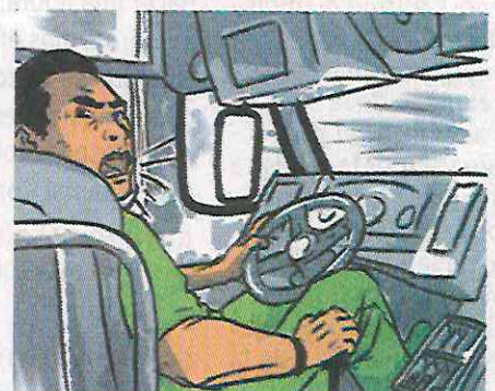
Al darse cuenta que la unidad no frenaba gritó a los pasajeros la situación.