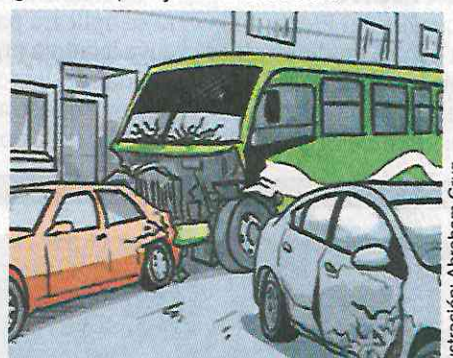
El conductor perdió el control del camión e impactó a seis vehículos.