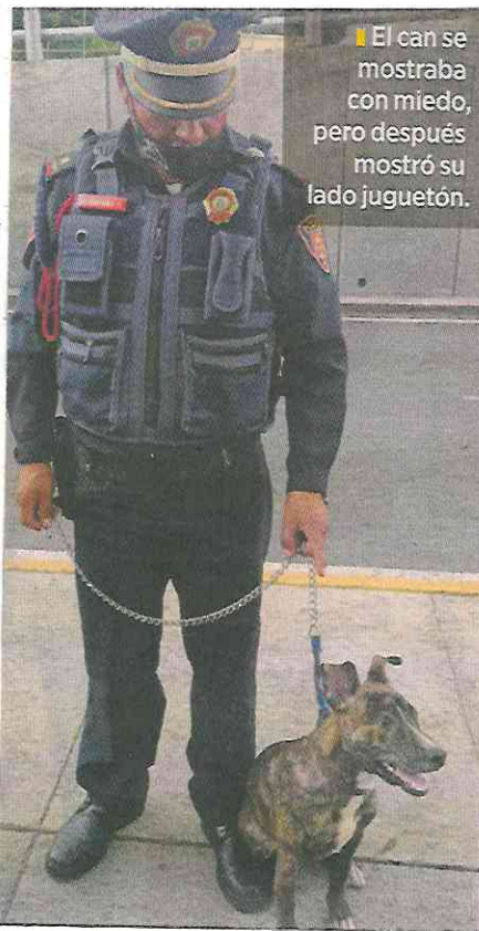
El can se mostraba con miedo, pero después mostró su lado juguetón.

Tras corroborar que tenía una fuente de ingresos para sustentarlo se lo dieron en adopción.