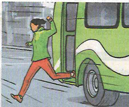
Testigos en el lugar informaron que dos mujeres saltaron de la unidad.