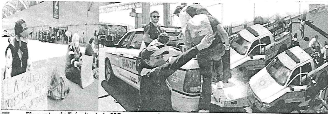
Elementos de Tránsito de la SSC, apoyaron a las personas para que pudieran llegar al aeropuerto