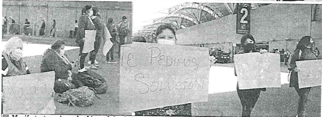
Manifestantes exigen al gobierno federal que se dé atención médica y se garanticen los tratamientos e insumos