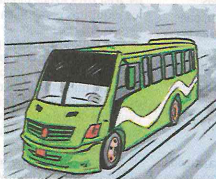
El conductor circulaba por Alta Tensión, presuntamente a exceso de velocidad.