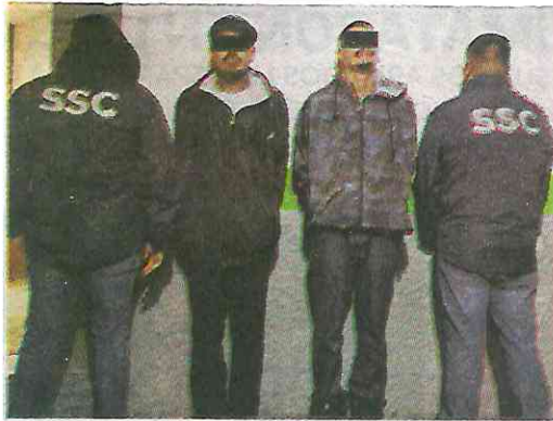
Se vinieron a esconder a la GAM