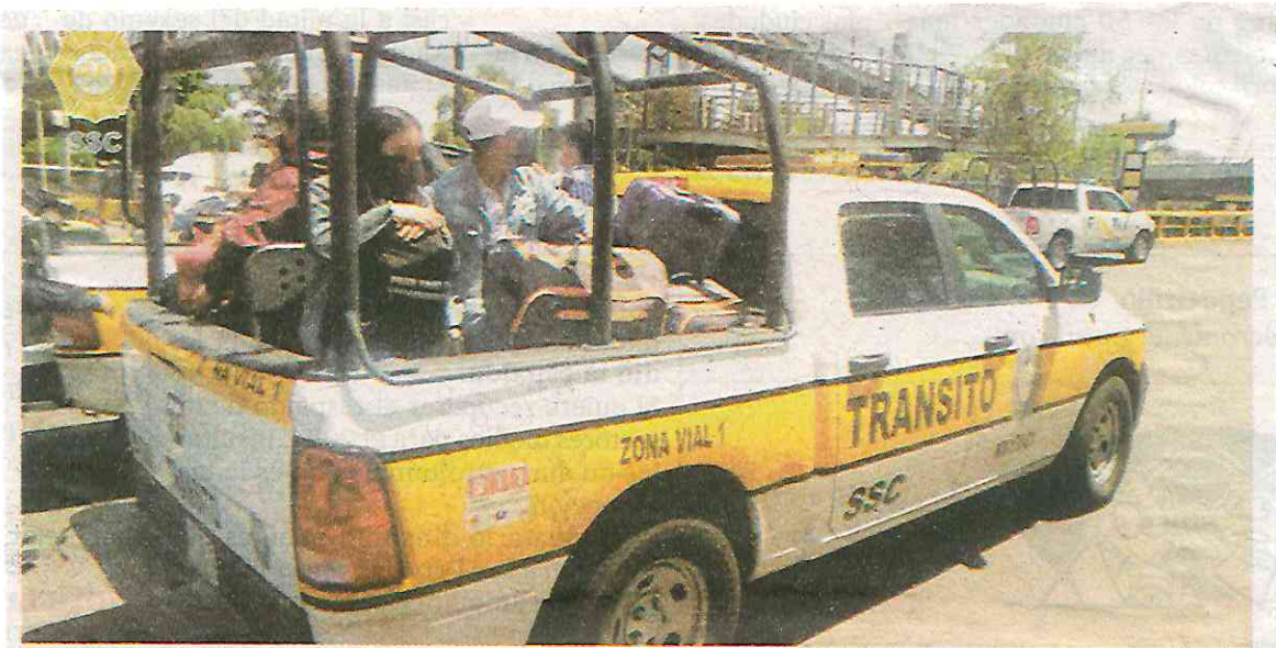
Oficiales de la SSC trasladaron a usuarios del AICM para evitar mayores contratiempos.