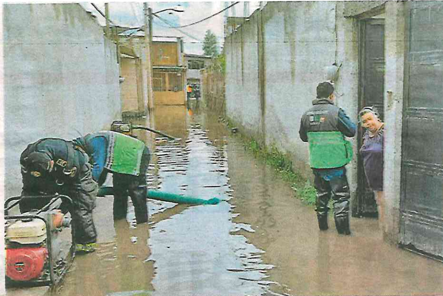
Personal del Sistema de Aguas, Protección Civil y del Heroico Cuerpo de Bomberos atendieron las afectaciones en las distintas demarcaciones de la capital del país

tierra de un talud con dimensiones de 7 metros de largo y 7 de profundidad, un aproximado de 5 metros cúbicos que se depositaron en el patio de la vivienda ubicada a desnivel.