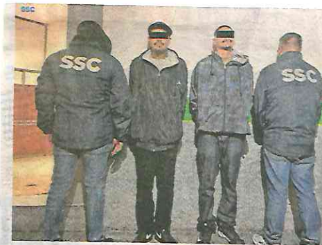
Fueron detenidos cuando vendían marihuana en la colonia San Felipe de Jesús, alcaldía GAM

En un recorrido de seguridad, vigilancia y prevención en calles de la colonia San Felipe de Jesús, alcaldía Gustavo A. Madero, los policías de la Secretaría de Seguridad Ciudadana descubrieron a un grupo de personas que intercambiaban envoltorios por dinero en efectivo.