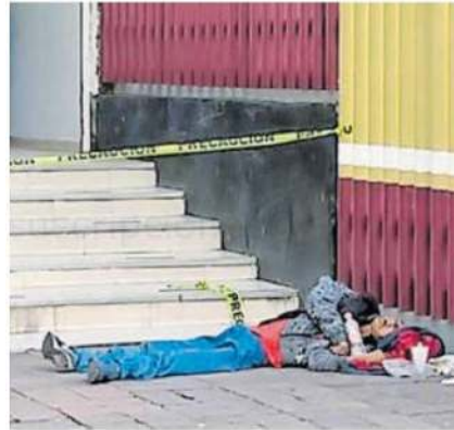
Paramédicos llegaron solo para certificar la muerte del masculino

Elementos de la Secretaría de Seguridad Ciudadana de la CdMx, acordonaron la zona, mientras que varios curiosos se acercaron para intentar reconocerlo. Lo único que se supo es que deambulaba por la zona desde hacía algún tiempo.