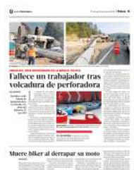
Fallece un trabajador tras volcadura de perforadora

El sitio donde quedó el cuerpo sin vida del biker y su moto destrozada fue resguardado por uniformados hasta el arribo de peritos de la Fiscalía General de Justicia FGI de la Ciudad de México quienes tras concluir las diligencias trasladaron el cadáver al anfiteatro correspondiente donde se espera que familiares acudan a reconocerlo.