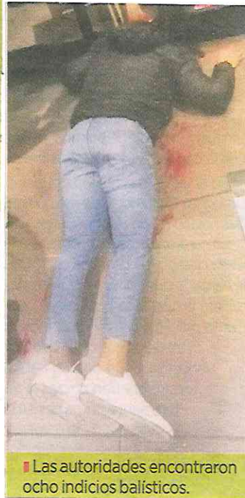
Las autoridades encontraron ocho indicios balísticos.

La carpeta de investigación CI-FIEDH/2/UI-1C/D/00238/07-2021 indica que hay un testigo.