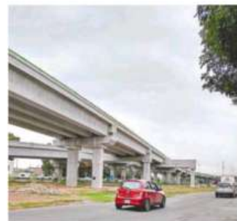
Demandan acelerar los trabajos de construcción de la autopista Siervo de la Nación

También se abordó el tema de las condiciones viales y de movilidad peatonal y vial en el puente de la Avenida Primero de Mayo, en Ecatepec, el cual representa una de las entradas al fraccionamiento Las Américas, donde además de las miles de viviendas existe un gigantesco centro comercial.