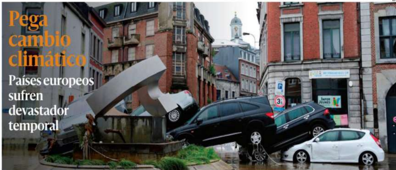
Las peores inundaciones del Siglo XXI en Alemania, Bélgica, Países Bajos, Luxemburgo y norte de Francia provocaron ayer al menos 69 muertos por culpa de deslaves que golpearon sobre todo la zona oeste del país germano. Hay, además, mil 300 personas desaparecidas. PAG 15

Países europeos sufren devastador temporal