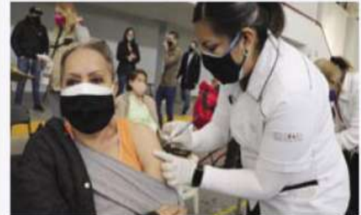
TOLUCA, Edomex.- Se aplicará el biológico en Huixquilucan, Metepec, Zinacantepec, Lerma y San Mateo Atenco.

De igual forma, se reitera que la vacuna es gratuita y segura, por lo que no es necesario pernoctar o llegar de madrugada a los módulos, y en la medida de lo posible tratar de escalonar su arribo para no exponerse a largas filas o aglomeraciones que pongan en riesgo su salud, además de acudir desayunados y en caso de estar en tratamiento por alguna enfermedad, tomar puntualmente sus medicamentos.