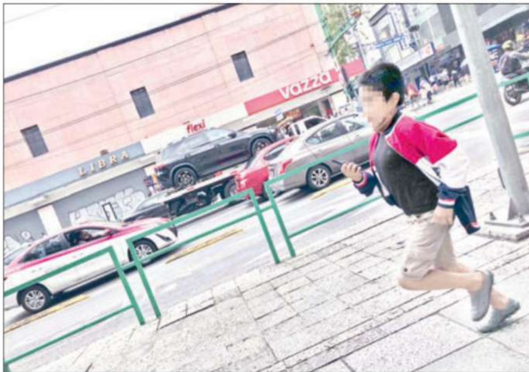
▲ Momento en que uno de los menores realiza su labor de alerta, mediante un radio portátil de banda civil, a comerciantes ambulantes que se despliegan en el Eje Central Lázaro Cárdenas, debido a los