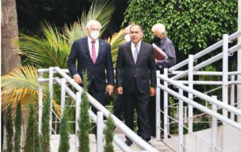
EL MANDATARIO de Guerrero (der.), con el secretario de Agricultura, ayer.