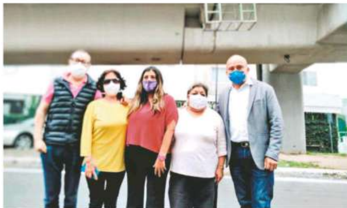
Constatan diputados locales del PAN que el puente Muyuguarda está en riesgo de sufrir un colapso

Los panistas, quienes junto con vecinos de la zona, llegaron al lugar para constatar los daños, expusieron que es necesario que la titular de la Fiscalía General de