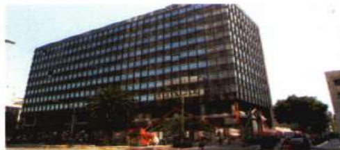
El objetivo es que el edificio embellezca el entorno del Centro Histórico y sea un símbolo de la Ciudad, precisó la Seduvi.

Seduvi detalló que el objetivo del concurso público es obtener una propuesta conceptual urba-