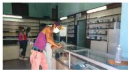
UN HOMBRE espera ser atendido en una farmacia en medio de la crisis por Covid, en La Habana, Cuba, ayer.

Evalúa si tiene capacidad tecnológica; población acusa bloqueo a mensajería; va otra protesta el domingo. pág. 18