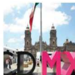
Efecto. La COVID enfrió ingresos.

Pandemia. La CDMX obtuvo menos ingresos durante 2020 en comparación con 2019, registrándose una disminución del 4.8% en la recaudación de impuestos, dio a conocer el INEGI. Datos preliminares de 2020 de las Finanzas públicas estatales y municipales señalan que la capital obtuvo ingresos por $219 mil 374 millones, mientras que en 2019 obtuvo $230 mil 640 mil millones. PAG 12