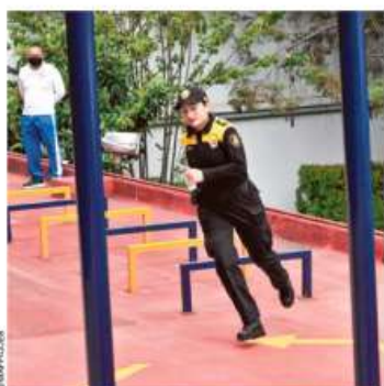
COMPETENCIA. Participarán 1,540 policías, expertos en diferentes deportes.