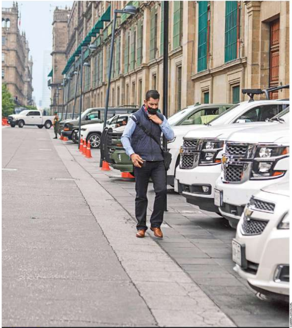
HAY LUGAR. De plano, los peatones dejan de transitar por la calle Corregidora cuando los invitados a Palacio Nacional estacionan sus camionetas sobre la banqueta.

Con la mudanza a Palacio Nacional de la residencia del Presidente y una parte de las actividades que se realizaban en Los Pinos, la histórica calle de Corregidora fue cerrada y convertida en estacionamiento de gobernadores y empresarios que visitan o acuden a reuniones de trabajo con el jefe del Ejecutivo. En la administración de Peña Nieto, éste llenó el Zócalo de coches... pero solo por un día MÉXICO P. 4