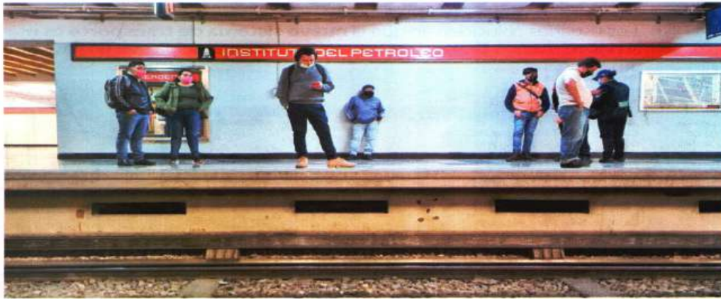
La avería del convoy ocurrió en Instituto del Petróleo. Después de cinco horas, el servicio se reanuda.