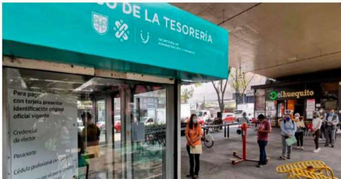
Se obtuvieron 55 mil 966 millones de pesos durante el año 2020 en impuestos.

En cuanto a la recaudación de impuestos, se obtuvieron 55 mil 966 millones de pesos durante el año 2020, lo que representa una disminución del 4.8%, en comparación con lo recaudado en el