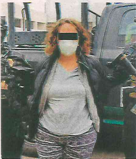
Avanza el proceso penal en su contra

En la continuación de la audiencia, el impartidor de justicia les ratificó a los ahora imputados la medida cautelar de prisión preventiva oficiosa en el Reclusorio Preventivo Varonil Oriente y en el Centro Femenil de Reinserción Social Santa Martha Acatitla, impuesta el pasado 11 de agosto, mientras se desarrollan los cuatro meses que fijó para el cierre de la