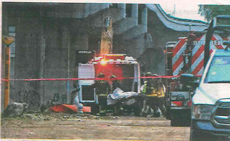
Elementos de rescate sacaron del canal de aguas negras el cuerpo putrefacto de una persona

Policías de la Secretaría de Seguridad Ciudadana SSC y elementos del Heroico Cuerpo de Bomberos bajaron a las aguas sucias y mal olientes para verificar la