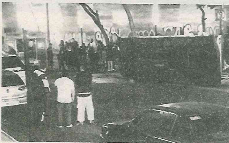
Los hechos fueron catastróficos

Al lugar arribaron policías de la Secretaría de Seguridad Ciudadana (SSC), elementos