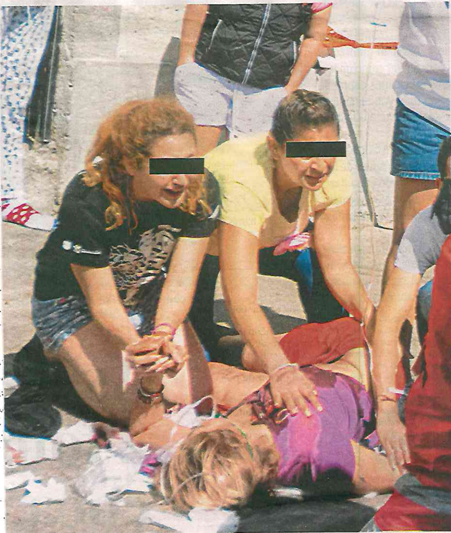
La mujer descendió de un vehículo, herida de muerte

alcaldía, arribaron al lugar de los hechos, entre la Casa Rivas Mercado -una mansión del Siglo XIX- y dos vecindades.