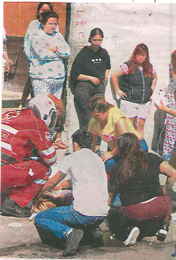
Los socorristas hicieron lo posible para contener la hemorragia, pero todo fue en vano