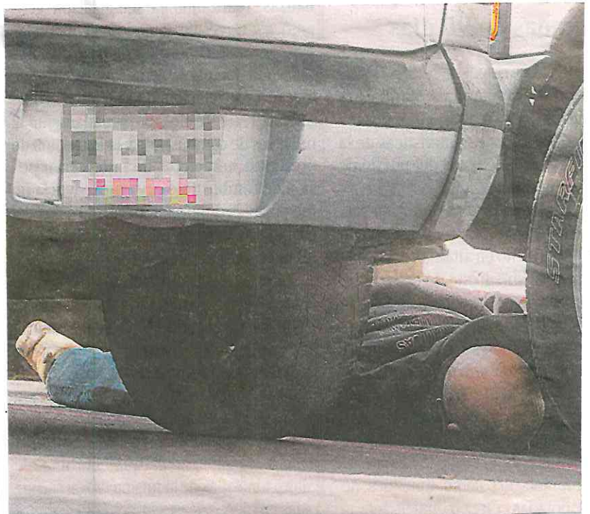
El cuerpo del sexagenario quedó tendido al lado de su vehículo

Aproximadamente, 15 minutos después, una ambulancia de la Cruz Roja Mexicana y dos motocicletas de Protección Civil de la