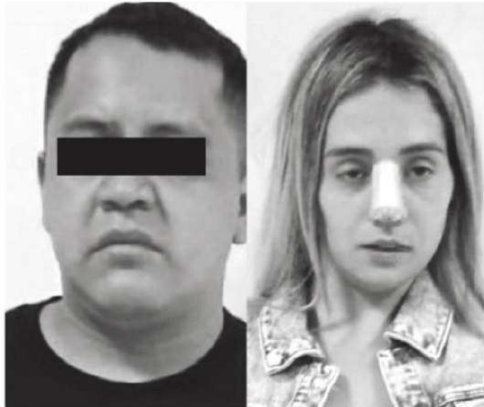
Está vinculado con cinco carpetas de investigación