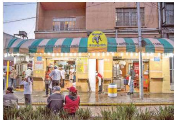
Un mesero fue puesto a disposición del MP, que definirá su situación jurídica

Con las medidas preventivas del caso, los policías controlaron la situación y resguardaron al afectado de 29 años, quien refirió que, momentos antes, uno de los meseros lo agredió físicamente, lo que derivó en una riña.