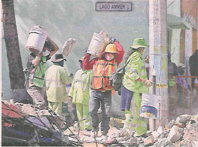
Los trabajadores del Gobierno local ayudan también a los vecinos a buscar entre los restos.