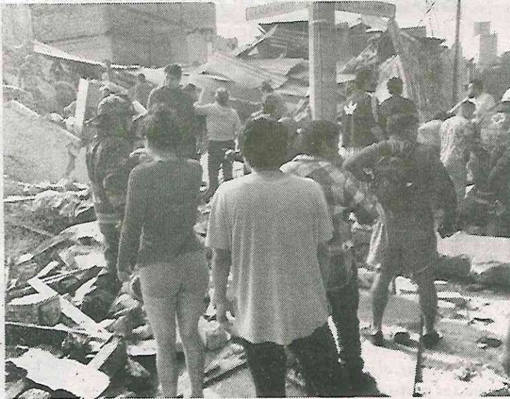
La gente no podía creer lo que estaba pasando