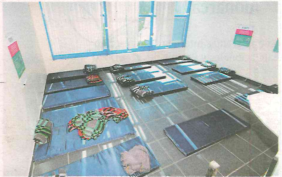
En el albergue, ubicado en la colonia Tabacalera, brindan atención a aproximadamente 22 personas

En los alrededores del inmueble, a temprana hora, se observaba la presencia de personal militar y de la Guardia Nacio-