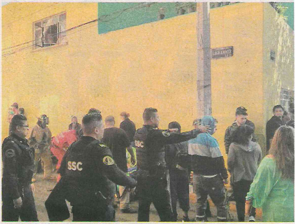
Elementos de la Secretaría de Seguridad Ciudadana resguardan la zona cero en la Pensil.