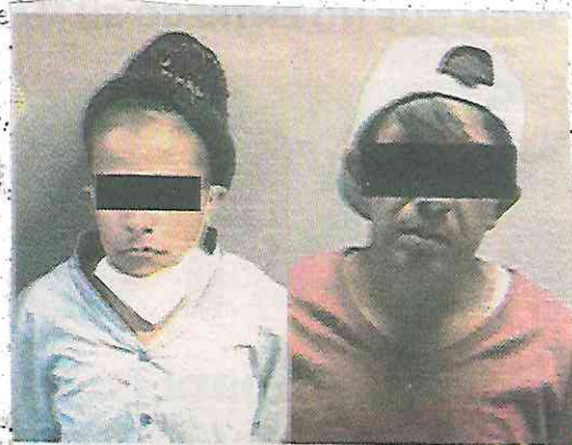
Un juez determinará su situación

La policía demostró capacidad con la captura de la pareja de presuntos ladrones