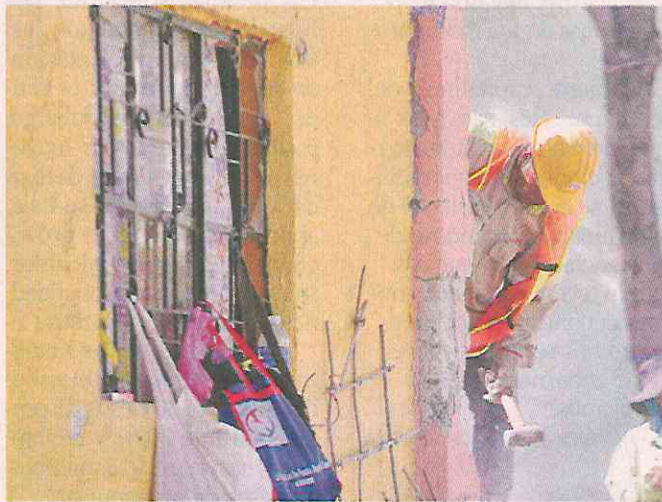
Las labores remoción de escombros siguen en esta colonia de Miguel Hidalgo desde el sábado.