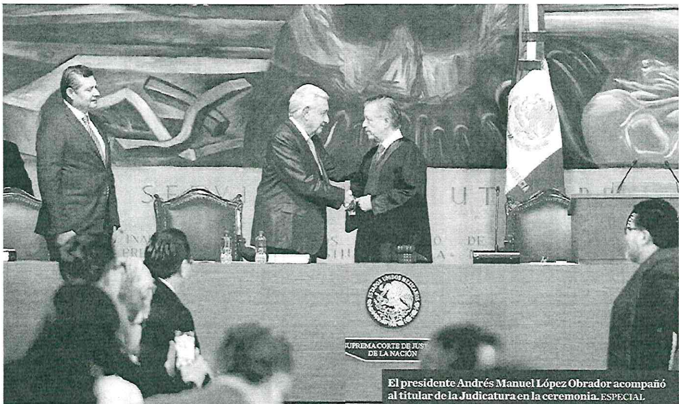
El presidente Andrés Manuel López Obrador acompañó al titular de la Judicatura en la ceremonia.

Recordó que tras su visita a Santa Martha Acatitla, el Instituto Federal de Defensoría Pública ha atendido a casi mil mujeres; nueve recuperaron su libertad.