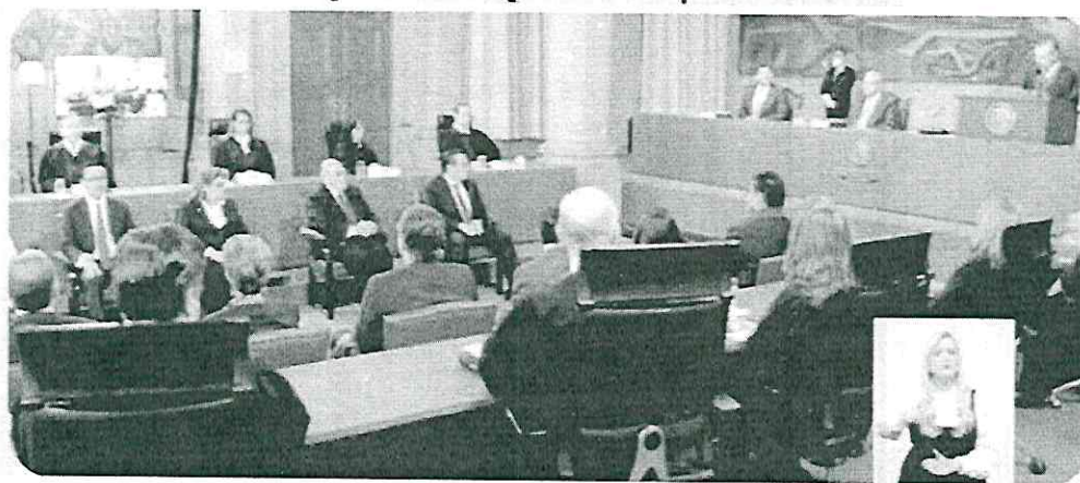
En cuatro años se desarticuló redes de corrupción y tráfico de influencias, dijo Zaldívar