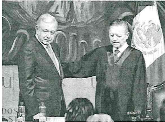
López Obrador asistió al informe de Zaldívar