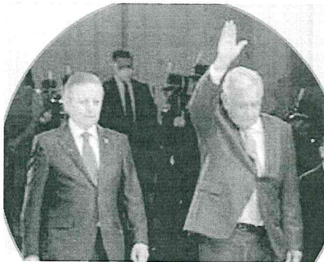
El presidente López Obrador y Arturo Zaldívar