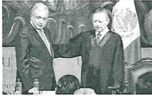
López Obrador asistió al informe de Zaldívar