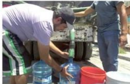
Miles de capitalinos resultan afectados

Entre 2019 y 2023, el Sistema de Aguas de la CDMX recibió más de mil denuncias por el huachicoleo de este recurso