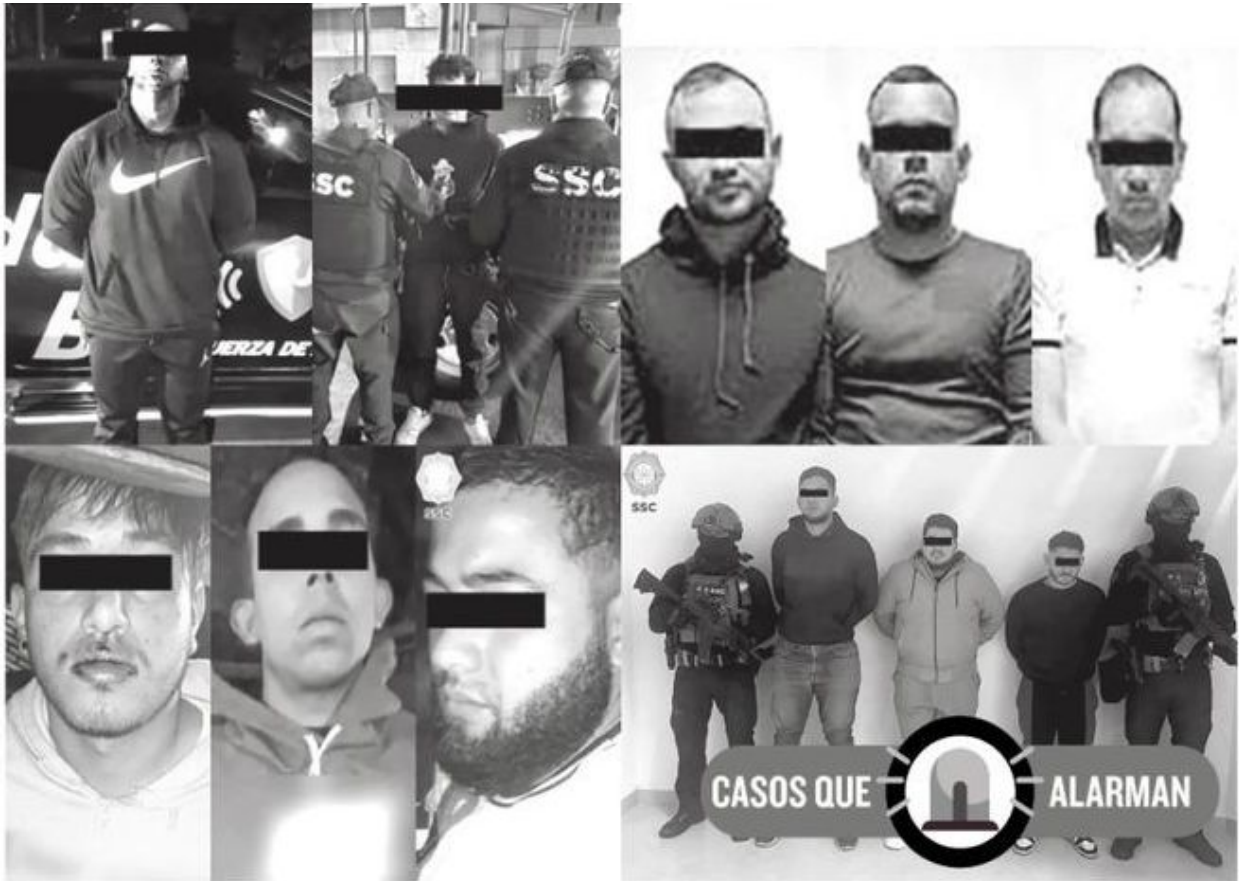
Las detenciones de los indocumentados delincuentes son cada vez más frecuentes

Según la Secretaría de Gobernación de México (SEGOB), 686 mil 732 personas en situación migratoria irregular ingresaron al país entre enero y noviembre de 2023