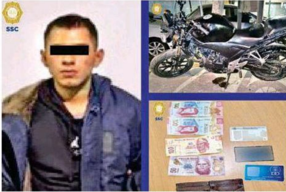
Cayó uno de los presuntos asaltantes del hijo de la actriz Susana Zabaleta