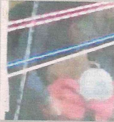
El video de la agresión causó indignación entre la gente.