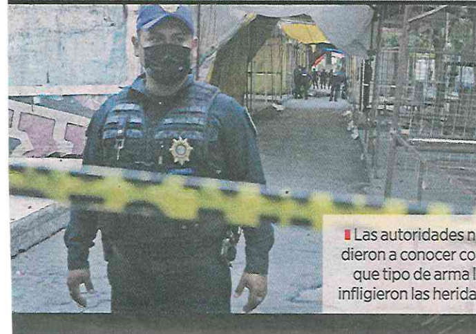
■ Las autoridades no dieron a conocer con que tipo de arma le infligieron las heridas.