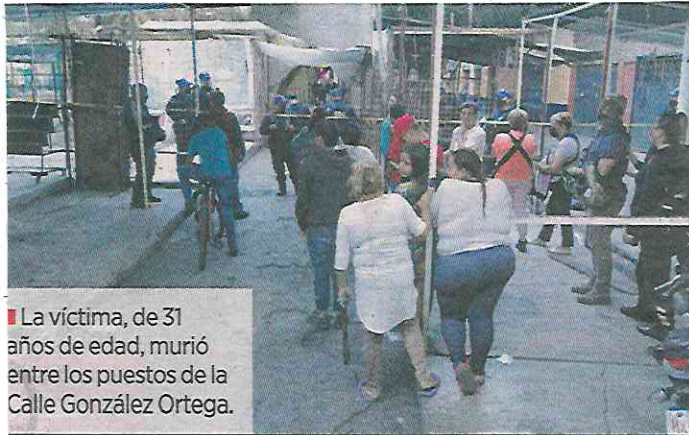
■ La víctima, de 31 años de edad, murió entre los puestos de la Calle González Ortega.

En este caso la Policía capitalina logró detener a dos presuntos responsables, quienes habían escapado en una motocicleta y fueron perseguidos.