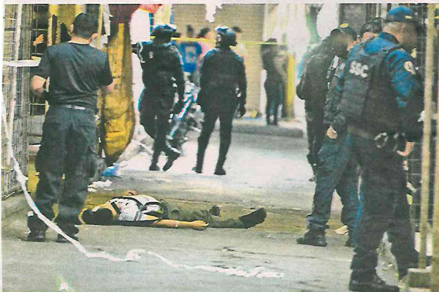
Un familiar reconoció a la víctima por un tatuaje con la leyenda: Toledo

La mujer permaneció en todo momento a un costado del cordón de seguridad hasta que recibió una llamada telefónica y se acercó con los policías para dialogar sobre la media filiación del occiso.