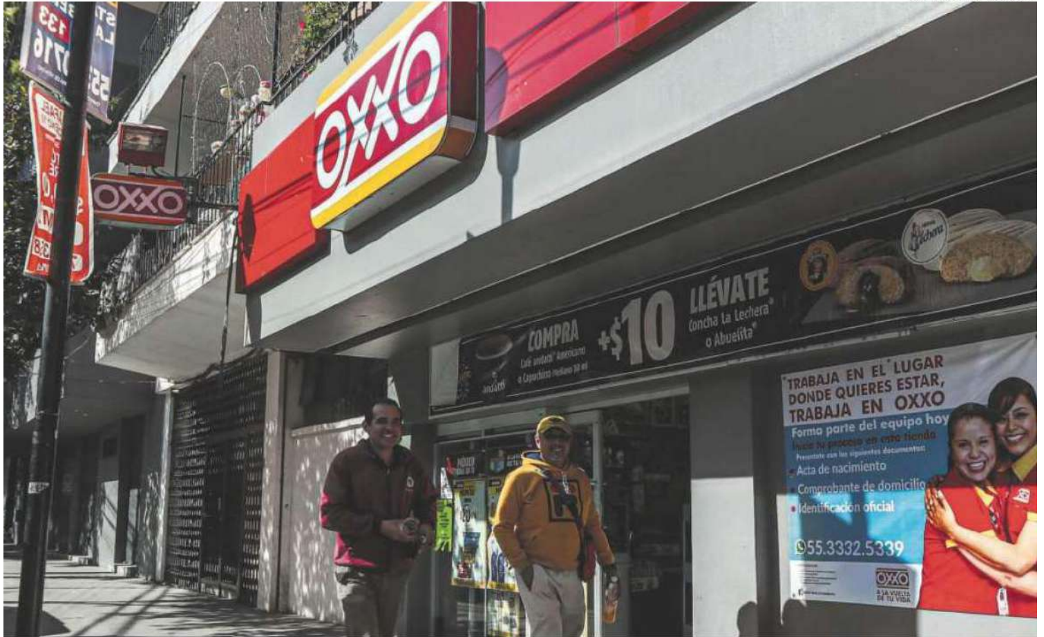
La ANTAD aconseja colocar en los vidrios de las tiendas los retratos de los asaltantes porque operan en la misma colonia