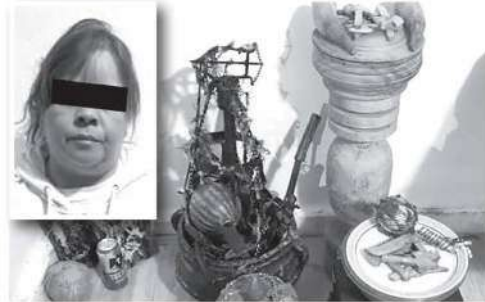
· Ni sus altares la salvaron