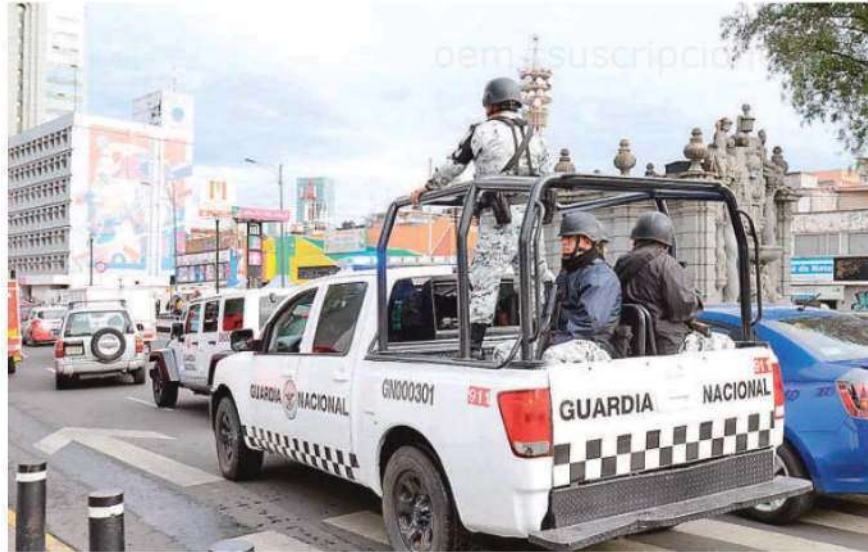
Hasta la Guardia Nacional participará en la vigilancia de escuelas