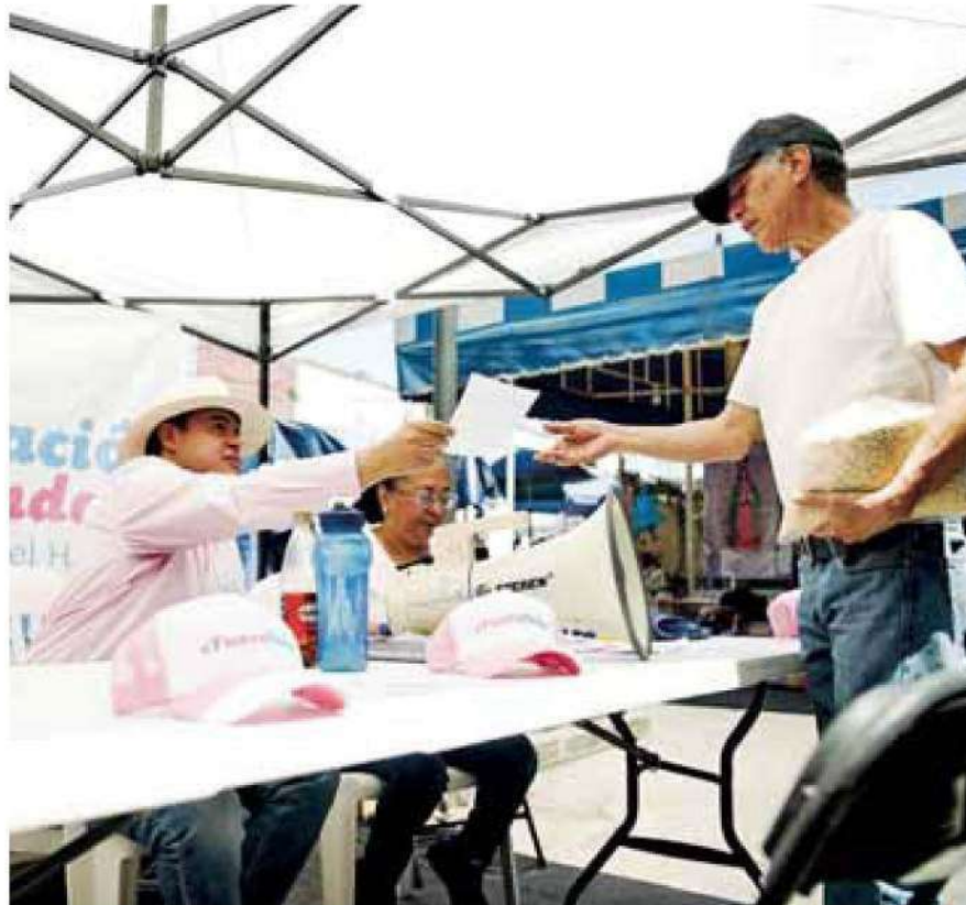
Revocación. En la Miguel Hidalgo ya inició la recolección de firmas.

En marcha. Los procesos más avanzados son los de Xochimilco, Benito Juárez y Miguel Hidalgo