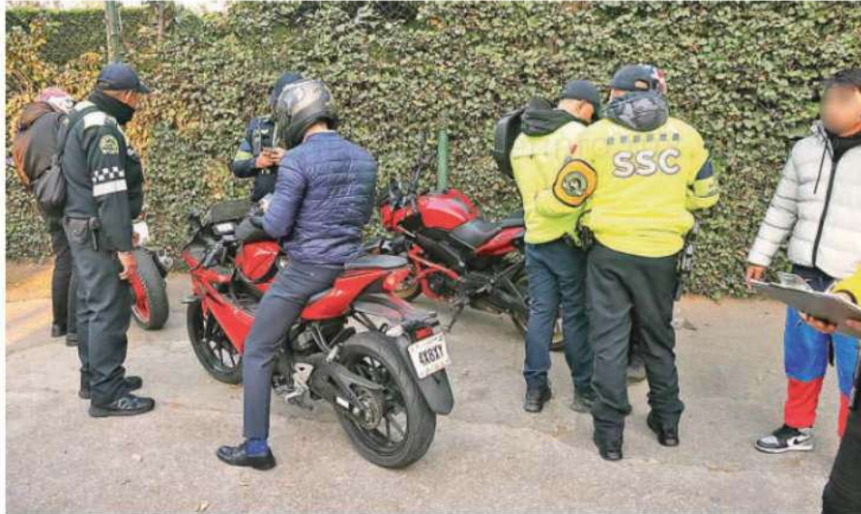
Los elementos revisan que las unidades cuenten con placas y licencias vigentes, además de no incumplir con alguna falta al Reglamento de Tránsito