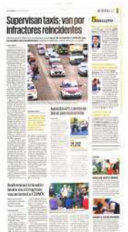
El arribo de vacacionistas se observó en las diversas entradas a la capital, así como en las centrales de autobuses.