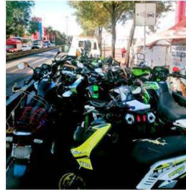
SANCIONES. Del 25 de enero al 31 de marzo 2023, mil 385 motocicletas fueron remitidas al corralón.

En tanto, del 25 de enero al 31 de marzo en los dispositivos de revisión a motocicletas se han realizado mil 385 remisiones a depósitos vehiculares por no contar con las placas en regla y la documentación vigente. Del mismo modo, también se levantaron seis mil 439 infracciones por faltas al reglamento. / ARMANDO YEFERSON