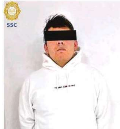
Los policías le encontraron un arma de fuego, cuatro cartuchos útiles y un casquillo

Por lo anterior, el implicado de 34 años de edad fue detenido y se le leyó su cartilla de derechos de ley, posteriormente, junto con la droga, el arma de fuego y el auto asegurados, fue puesto a disposición ante el agente del MP correspondiente, quien determinará su situación jurídica.