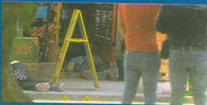
Afuera de una tienda ocurrió el asesinato de los familiares.

Al lugar arribaron peritos de la fiscalía quienes hicieron levantamiento de los cuerpos; agentes de la policía de investigación recabaron los primeros testimonios para iniciar las indagatorias por el delito de homicidio.