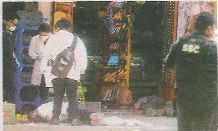
Les dispararon a corta distancia

Con las características del vehículo que utilizaron los criminales se ha implementado una búsqueda exhaustiva