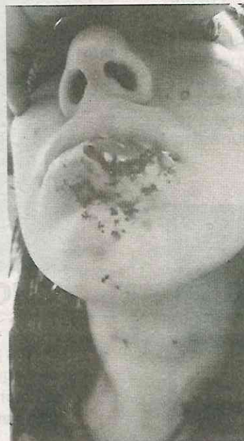
La dejó marcada para siempre

Presentó denuncia y el MP le dijo que regresara en diez días!