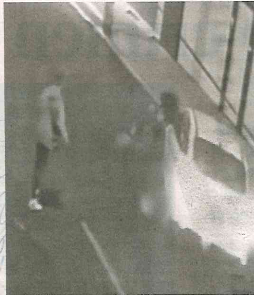
Los hechos ocurrieron el pasado sábado en la colonia Viaducto Piedad, alcaldía Iztacalco

Por lo anterior, el representante social de la Fiscalía de Investigación Territorial en Iztacalco, quien judicializó la carpeta de investigación por tentativa de feminicidio, giró un oficio a la Secretaría de Seguridad Ciudadana para que dichas medidas sean otorgadas a favor de ambas personas.