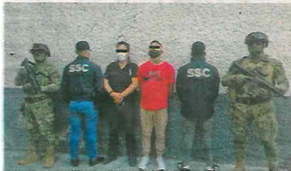
"El Chiquis" fue puesto a disposición del MP de la Fiscalía General de Justicia

Los reportes de la Secretaría de Seguridad Ciudadana señalan que "El Chiquis" y la organización delictiva se dedican a la extorsión, despojos y narcomenudeo en varias zonas de la CDMX, principalmente en Álvaro Obregón.