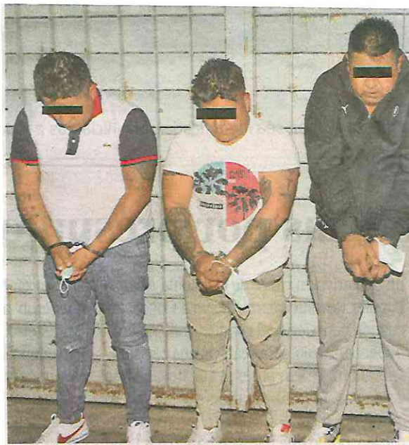
Los sujetos están acusados de delitos de extorsión, cobro de piso, narcomenudeo y robo

Les aseguraron 92 bolsas con vegetal verde con características de la marihuana, 42 más con polvo similar a la cocaína, 360 pesos en efectivo y una motocicleta.