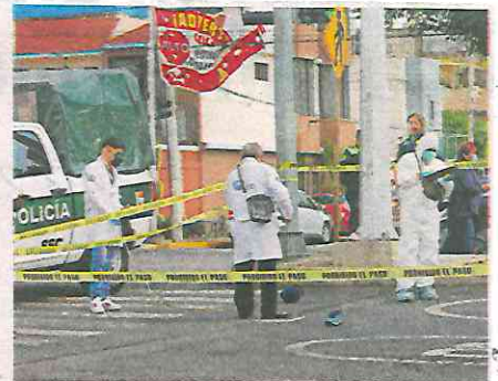
Luego de arrastrar al abuelito, el chofer siguió su camino, pero fue detenido