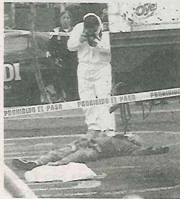
Le pasó por encima

El fatal accidente ocurrió sobre Canal de Tezontle y Maguey, donde, de acuerdo a testigos, el conductor del vehículo de la al-