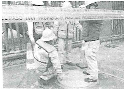
Los hechos ocurrieron en Avenida 508 de la Colonia San Juan de Aragón, en Gustavo A. Madero.

Debido al golpe, la mujer dijo sentir dolor en el cuerpo, por lo que fue trasladada al Hospital General Regional No.2 del IMSS, en la alcaldía Tlalpan.