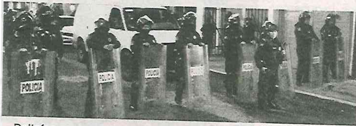
Policías aseguraron el perímetro

kilos de estupefacientes le fueron decomisados al narcomenu-dista