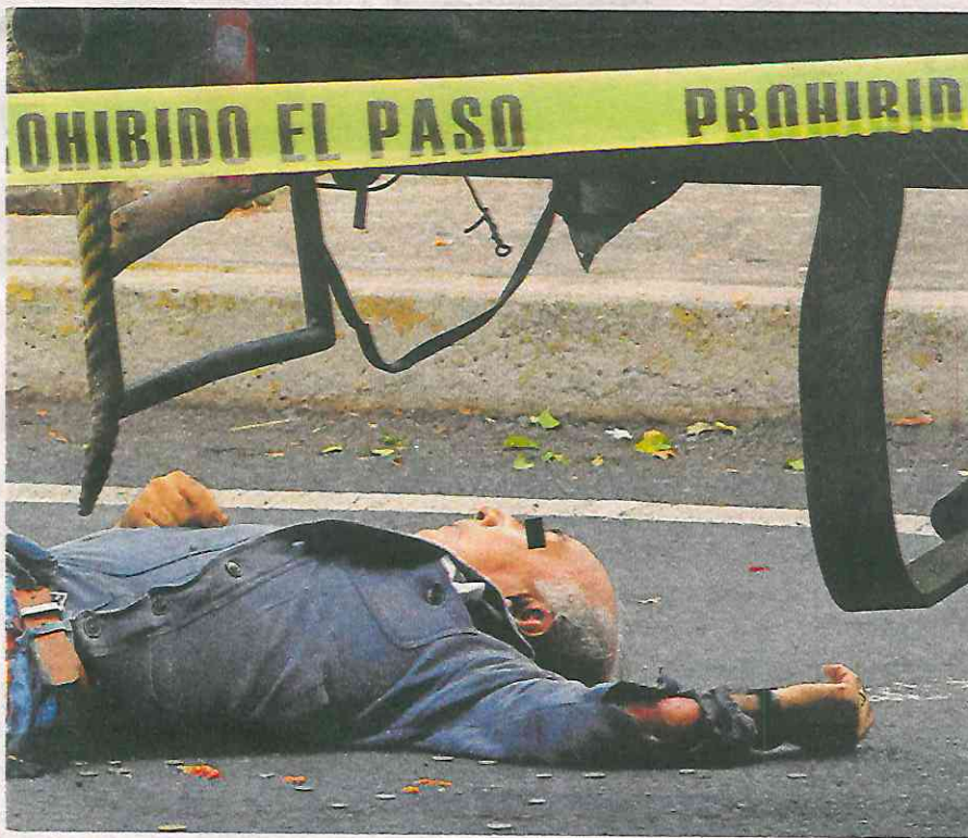
El sujeto de la tercera edad murió antes que pudiera recibir apoyo médico