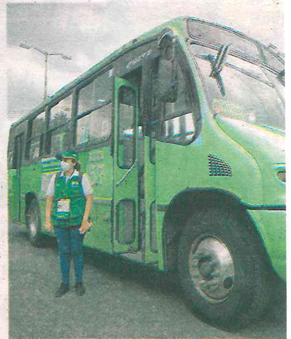
La ruta 57 se convirtió en una de las prioridades de atención del Gobierno de la Ciudad de México

Derivado de esto la ruta se convirtió en una de las prioridades de atención del Gobierno de la Ciudad de México. La Secretaría de Movilidad continuará con los operativos a transporte público para corroborar el cumplimiento de acuerdos de mejora hecho por parte del gremio transportista en la capital del país e invita a la ciudadanía a seguir realizando reportes a través de LOCATEL o de las redes sociales de esta dependencia