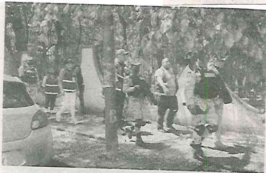
La vigilancia aumentó en Los Viveros