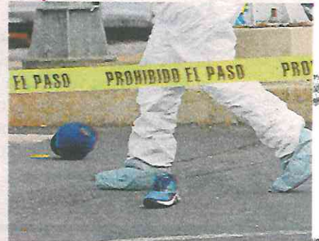
Heridas de gravedad por aplastamiento vieron curiosos, que apuran su andar