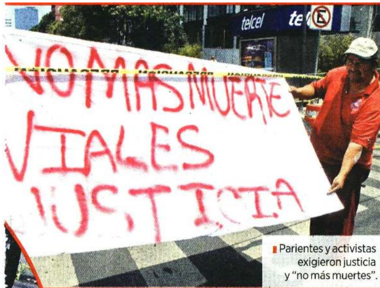
■ Parientes y activistas exigieron justicia y "no más muertes".