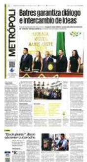
Martí Batres rindió protesta como jefe de Gobierno de la Ciudad de México en el Congreso capitalino.