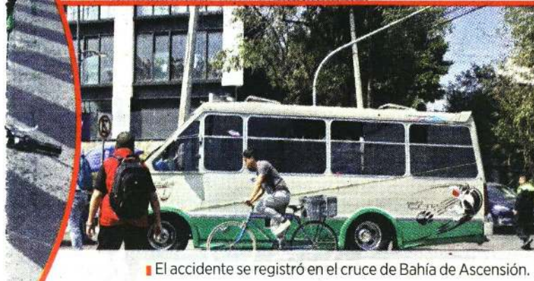
■ El accidente se registró en el cruce de Bahía de Ascensión.