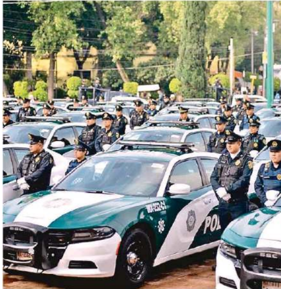
Se contará con elementos pertenecientes a la Subsecretaría de Control de Tránsito

Se contará con el apoyo del Centro de Comando, Control, Cómputo, Comunicaciones y Contacto Ciudadano (C5), así como los Centros de Comando y Control (C2), lo que permitirá una coordinación inmediata, en caso de que llegue a ser requerida la presencia de los uniformados.