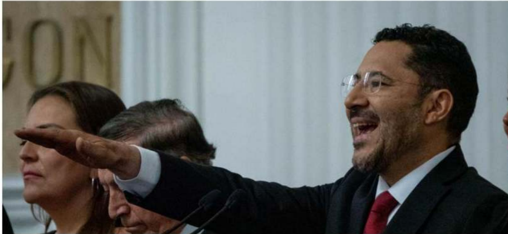
Batres Guadarrama tomó protesta como jefe de gobierno de la Ciudad de México.