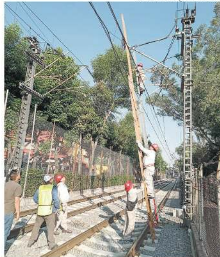
La falla fue entre Periférico y Tepepan