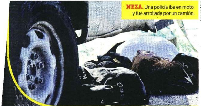
NEZA. Una policía iba en moto y fue arrollada por un camión.

MUEREN DOS MUJERES ATROPELLADAS POR TRANSPORTE PÚBLICO PÁGS. 2 Y 3