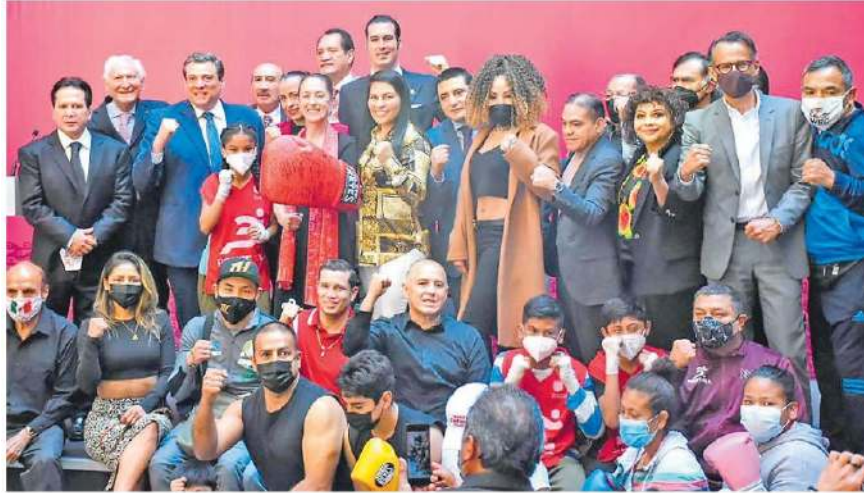
Fuerte impulso al boxeo por el Gobierno de la Ciudad de México. wbc