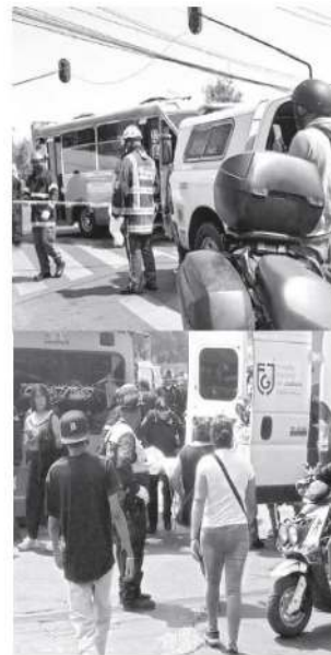
- Otras más de los cafres

El chofer de la unidad de transporte público fue detenido por la policía