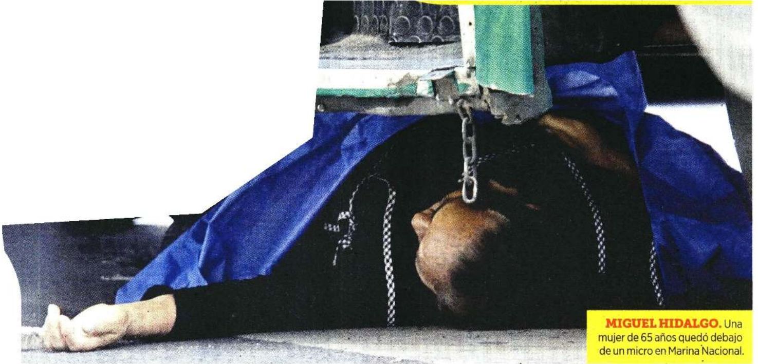
MIGUEL HIDALGO. Una mujer de 65 años quedó debajo de un micro en Marina Nacional.