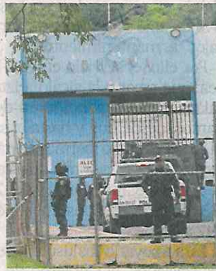
Un juez imputó a los detenidos por crimen organizado.

Ninguno de los detenidos quiso declarar respecto a cuáles eran sus actividades en la Ciudad. La jefa de Gobierno señaló que estos sujetos sí están ligados al crimen organizado. ●