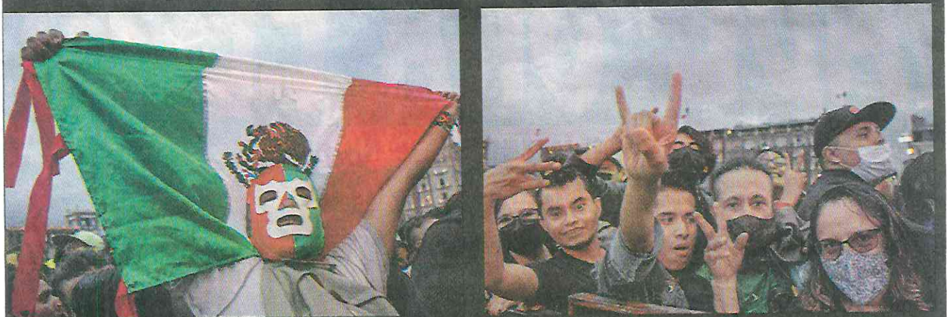
A pesar de la amenaza de lluvia, los fans mostraron su alegría por volver a los conciertos masivos.

tarima se pronunciaba por la tolerancia y unidad: "para toda la comunidad arcoíris, ¡que viva el amor!"