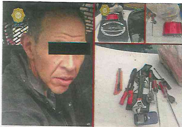
Con accesorios automotrices y herramienta fue detenido; no dio razón de su posesión

Al no acreditar la legal propiedad de los objetos y ser reconocido por el denunciante, el hombre de 43 años de edad fue detenido, informado de sus derechos de ley y, junto con lo asegurado, quedó a disposición del agente del Ministerio Público, quien determinará su situación jurídica.