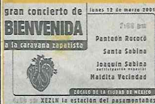
Joaquín Sabina canceló por un malestar gástrico.