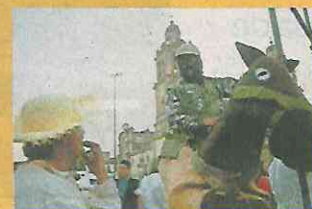
El evento se realizó para apoyar al EZLN.

nido bajo ninguna tiranía y ninguna violencia”, añadió para aplaudir a la saxofonista, que subió al escenario con un cubrebocas negro, entre gritos y aplausos efusivos de los asistentes.