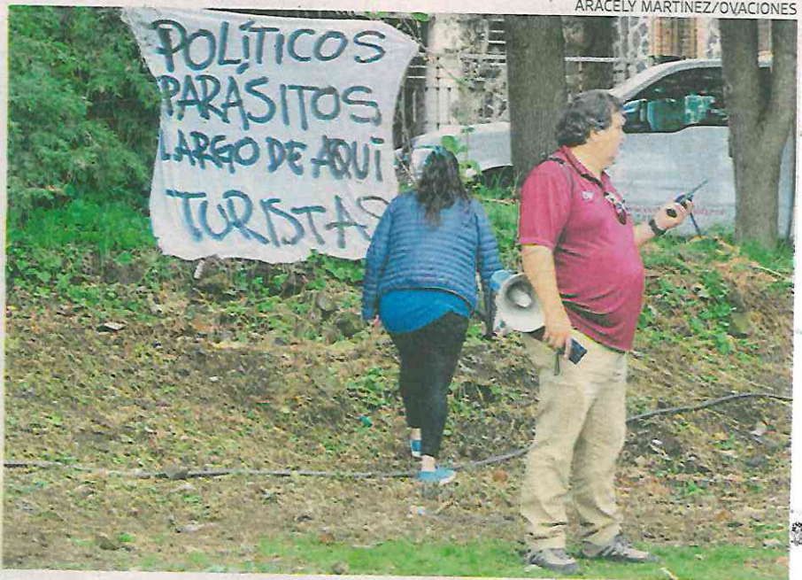
Esta manta fue colocada en el camino que recorrió la mandataria en el pueblo

"No vamos a permitir la entrada de estos grupos delictivos a la ciudad. Están la Secretaría de Seguridad Ciudadana , la Fiscalía General de Justicia en coordinación con el gobierno de México, con la Secretaría de Seguridad y Protección Ciudadana, la Secretaría de la Defensa Nacional (Sedena), la Marina y la Guardia Nacional trabajando en conjunto y hasta ahora ha habido detenciones muy importantes", dijo Sheinbaum.