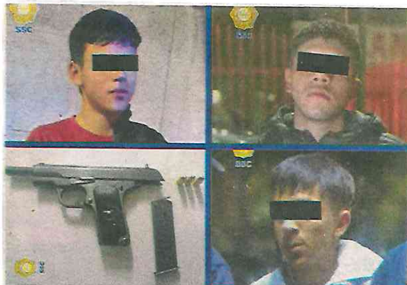
Presentados ante el MP junto con la motocicleta y el arma de fuego

también fueron asegurados, informados de sus derechos de ley y junto con la motocicleta, el vehículo y el arma de fuego, fueron presentados ante el agente del Ministerio Público, quien determinará su situación jurídica.