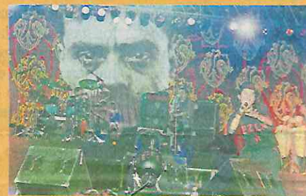
Maldita Vecindad cerró su primer concierto en el Zócalo con el tema “Kumbala”.

● Otro incidente, capturado por EL UNIVERSAL en la crónica “Rock, abucheos y plantón”, fue cuando entre abucheos, bajaron a Miguel Ríos del escenario. ●