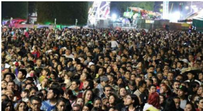
La alegría de los carrancenses no paró y siguió en la noche bailando con los éxitos de la Trakalosa de Monterrey y la Sonora Dinamita.