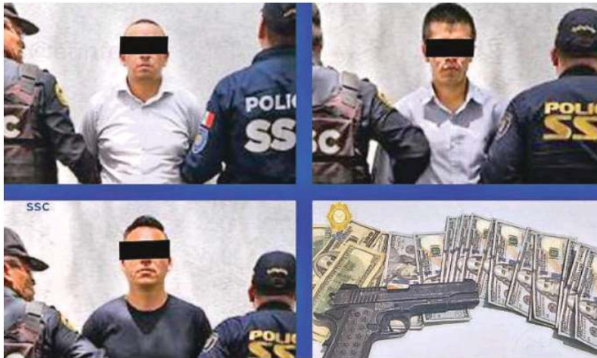
Tras ser reconocidos por el afectado, los hombres de 22, 35 y 43 años de edad, fueron detenidos