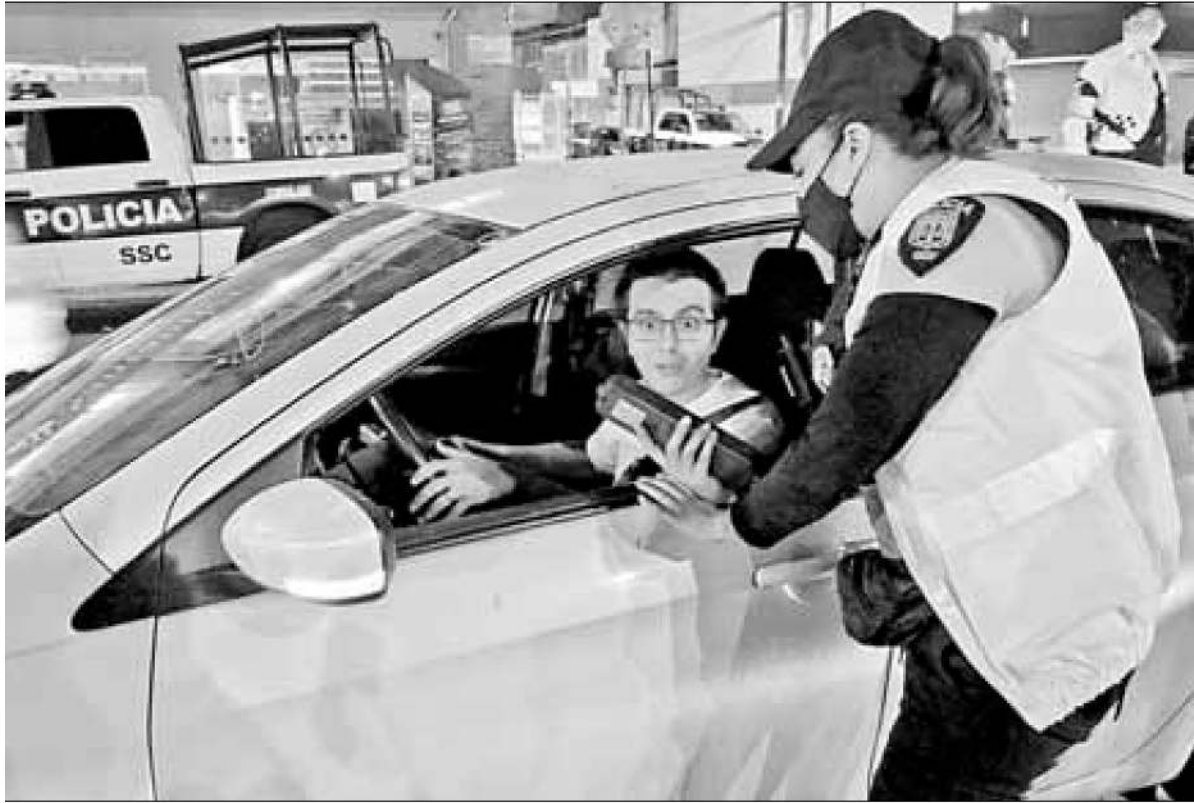
► Algunos conductores sorprendidos actuaron bajo la vieja premisa de que una no es ninguna.