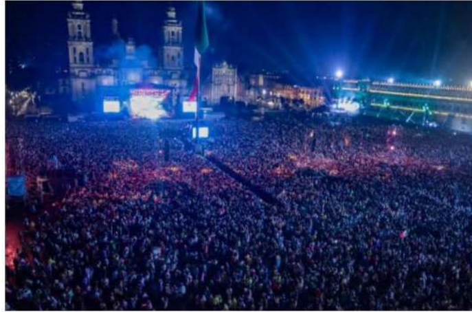
Grito de Independencia de México en el Zócalo de la CDMX-2023.