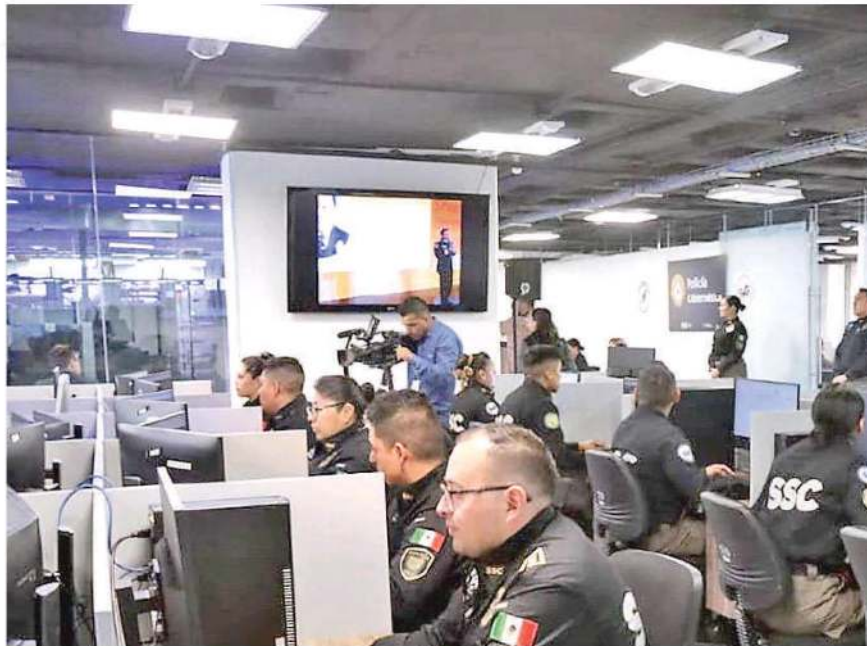
Cuerpo policiaco participa en la Semana Nacional de la Ciberseguridad desde el año 2020