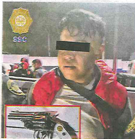
El imputado trató de robarle sus pertenencias a un repartidor y al oponerse le disparó en una pierna

Por lo anterior, y al ser reconocido por el denunciante, el hombre de 25 años de edad fue detenido, enterado de sus derechos constitucionales y presentado ante el agente del Ministerio Público, quien realizará la investigación correspondiente para determinar su situación jurídica.