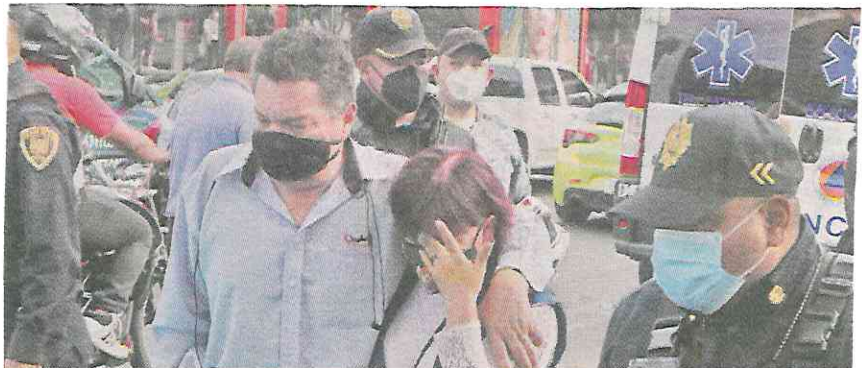
Una vez atendidas sus heridas, otros involucrados fueron llevados al MP.

Peritos de la Fiscalía retiraron el cadáver con ayuda de bomberos y personal del ERUM, quienes con pinzas hidráulicas cortaron la carrocería para sacarlo.