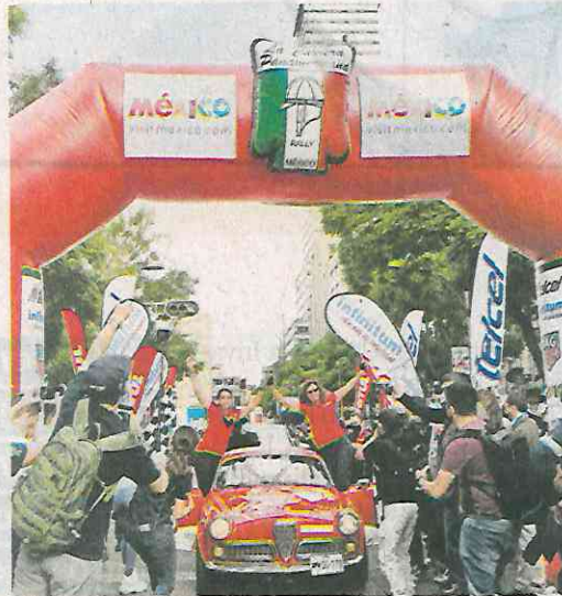
La carrera llegó al Arco de Meta en la Alameda Central, cerca de las 16:00 horas.

El personal de la Subsecretaría de Control de Tránsito coordinó las labores de vialidad para garantizar la movilidad vehicular a lo largo de la ruta de desplazamiento de la carrera, que pasó por Puente de la Concordia, calzada Ignacio Zaragoza, viaducto Río de la Piedad, Francisco Mora-