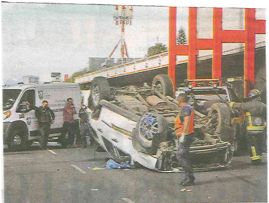
Testigos señalaron que los tres de los ocupantes de la camioneta sufrieron golpes y que salieron por su propio pie

“El de la troca venía en chinga y no se dio cuenta del tráiler que estaba en medio y estacionado. Por eso empezó a frenar ya tarde y se derrapó, después le pegó a los otros chavos y la troca salió volando”, narró un usuario del Metro que salía de la estación.