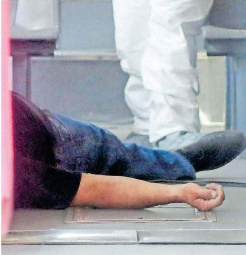
Testigos relataron que el pasajero se encontraba de pie, cuando repentinamente se desvaneció hasta caer sobre el pasillo central