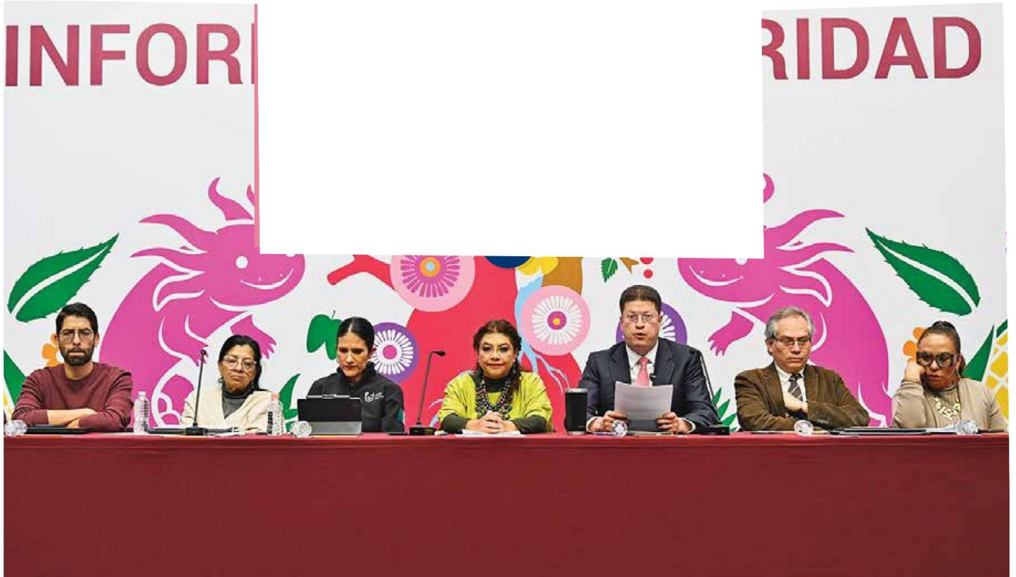
• ENFOQUE. Autoridades capitalinas presentaron ayer los resultados en materia de seguridad de enero a septiembre.