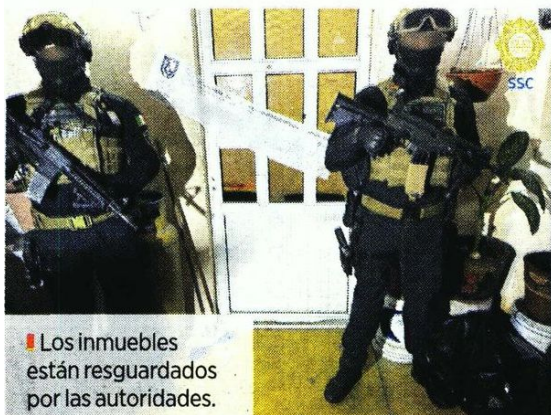
■ Los inmuebles están resguardados por las autoridades.