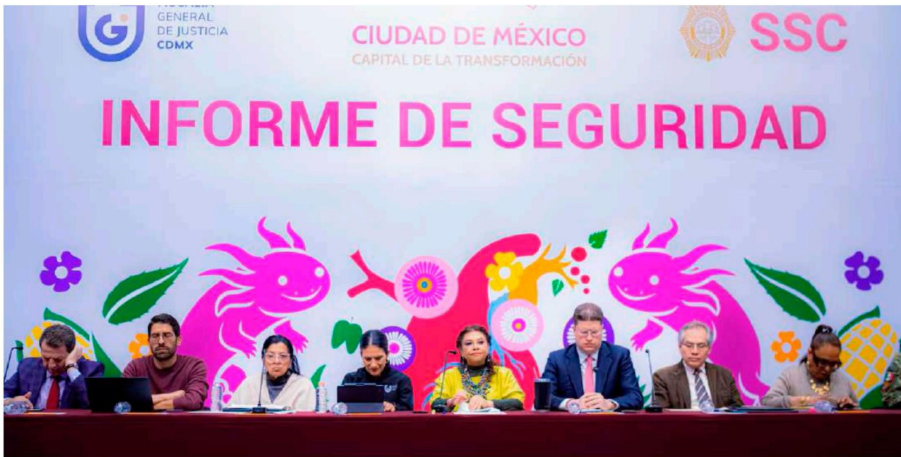
Clara Brugada, jefa de gobierno capitalina, encabezó la presentación del Informe de Seguridad capitalino.

El robo de vehículo registró un descenso de 55% frente a 2019 y de 9% respecto a 2024 El robo con violencia a automovilistas se redujo 80% en seis años y 32% en un solo año