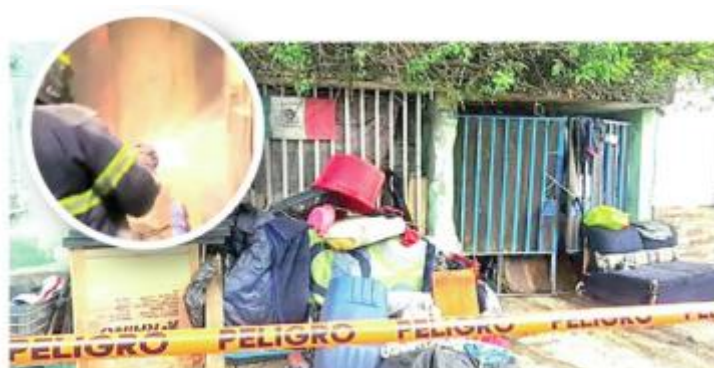
Los hechos ocurrieron en la casa número 1511, en la intersección de Norte 1 M con avenida Cuitláhuac

Al llegar, servicios de emergencia se encargaron de sofocar las llamas que habían alcan-