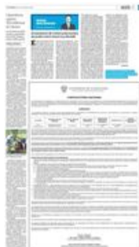
En Sinaloa incautaron químicos por 37 millones de pesos.