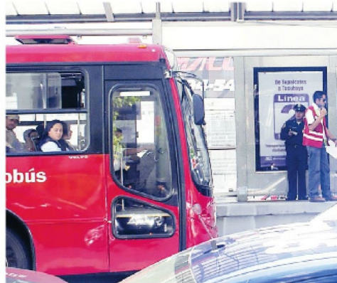
· Bajos números reportados por la SSC

por ciento es el promedio de robos donde se logró que el responsable compareciera ante las autoridades