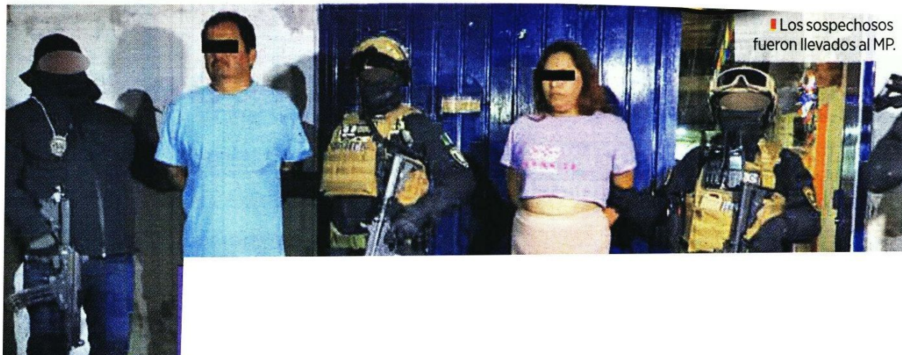
Los sospechosos fueron llevados al MP.