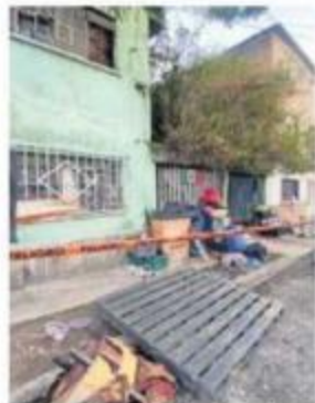
El incendio ocurrió en la colonia Defensores de la República.

con quemaduras, huyeron a un hotel, pero no fueron localizadas.