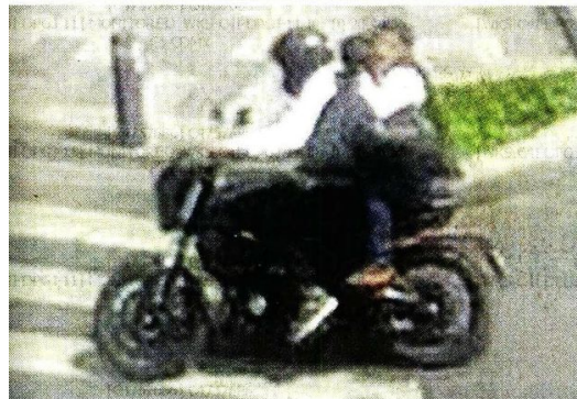
Los tres delincentes escaparon con el botín en una moto.