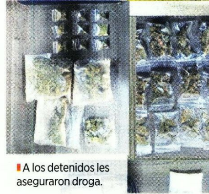
■ A los detenidos les aseguraron droga.

Los capturados fueron puestos a disposición del agente del Ministerio Público junto a lo asegurado.