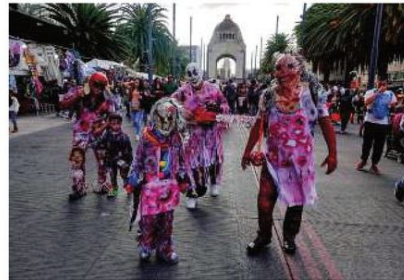
Serán actividades familiares "a favor de la Cultura Alternativa".

El mismo día, la capital también albergará el Desfile de Alebrijes Monumentales 2025, organizado por el Museo de Arte Popular (MAP), como parte de "La Noche de los Alebrijes". El recorrido partirá desde el Zócalo de la Ciudad de México a las 12:00 horas y concluirá en el Ángel de la Independencia.●