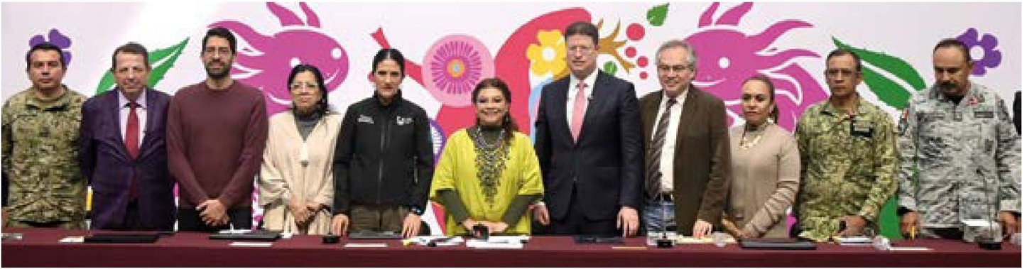
Informe. Clara Brugada [centro], jefa de Gobierno de la CDMX, dio a conocer los resultados de su estrategia de seguridad en la capital.