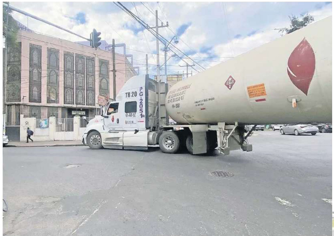
Vecinos de la colonia Tránsito denunciaron que sobre avenida del Taller es frecuente observar pipas circular a plena luz del día.

“Las autoridades dijeron que iban a restringirlas, pero siguen pasando diario. Algunas son enormes, se estacionan incluso un rato y nadie las detiene”