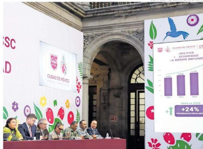
Clara Brugada, junto con su gabinete de seguridad en conferencia.