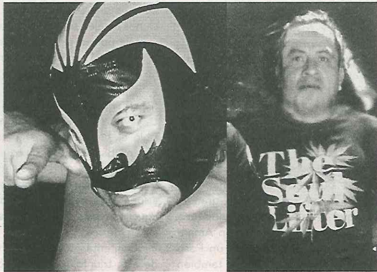
● Black Boy se habría molestado por la alta tarifa del taxista

Hasta el momento se desconoce el móvil del asesinato, aunque todo apunta a que se debió a un altercado que tuvieron con el trabajador del volante, por el tema de la tarifa que les había cobrado, lo cual ya es indagado por Policías de Investigación de la Fiscalía General de justicia de la Ciudad de México.