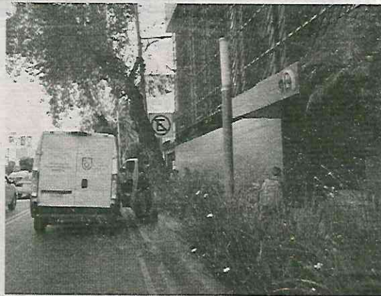
Al interior de este inmueble ocurrió el homicidio