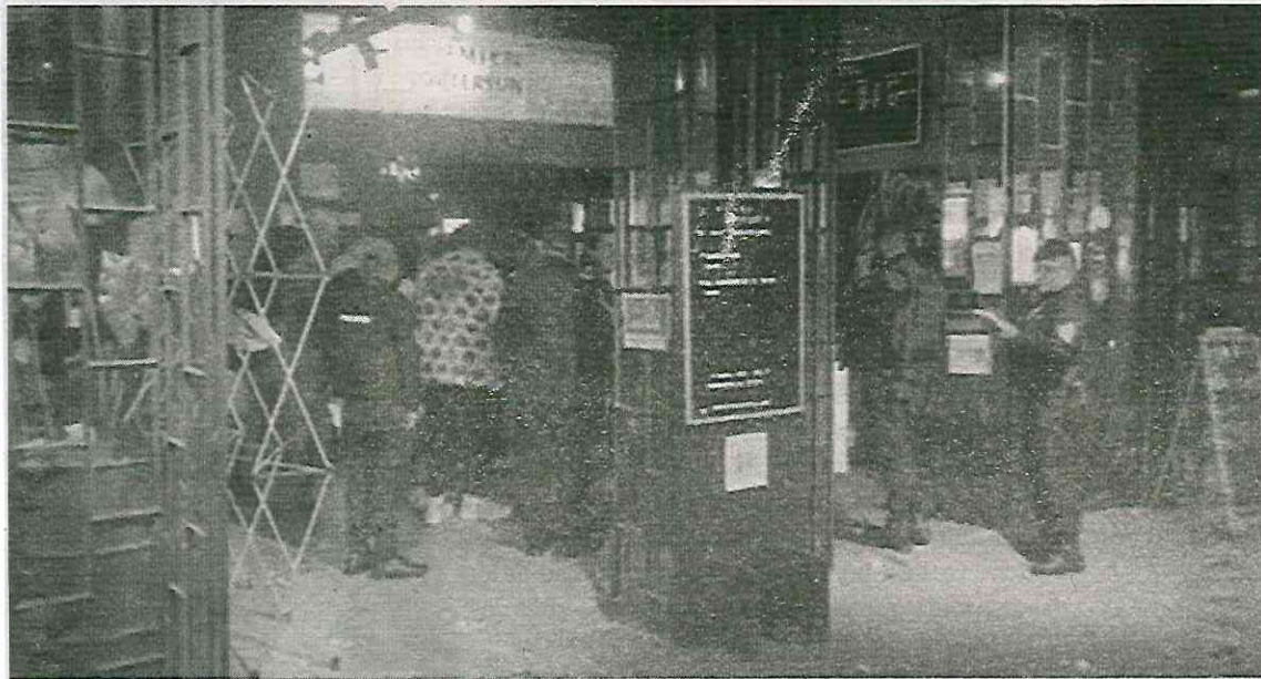
Se les escaparon las ratas a los policías

Cerca del lugar del atraco la policía encontró una moto abandonada en las que iban los ladrones