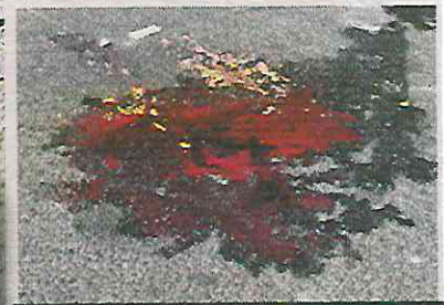
La mancha de sangre y masa encefálica quedaron en el piso.

Los paramédicos que fueron movilizados no pudieron hacer nada más que cubrir su cadáver con una sábana blanca.