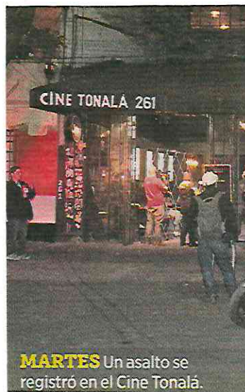
MARTES Un asalto se registró en el Cine Tonalá.

La Fiscalía de Justicia inició una investigación por robo en el Cine Tonalá y aseguró una motocicleta que presuntamente fue usada para realizar el delito.