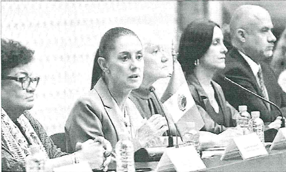
▼ La jefa de Gobierno se reunió con diplomáticos para mostrar los avances en su política.