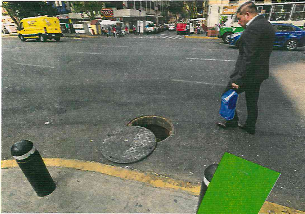
En Cuajimalpa atenderán las coladeras sin tapa

el techo presupuestario que le asignó la Secretaría de Administración y Finanzas por tres mil 958 millones de pesos, y consideró que merecía un incremento, sin dar una cifra, porque su demarcación proporciona servicios a una población flotante de seis millones de personas.