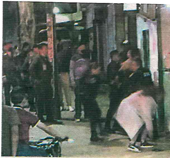
La SSC llegó al sitio para rescatar al ladrón que se hallaba tendido en el piso y ensangrentado

Elementos de la Secretaría de Seguridad Ciudadana SSC llegaron al sitio para rescatar al ladrón que se hallaba tendido en el piso y ensangrentado rodeado por personas furiosas, por lo que fue atendido por paramédicos y puesto a disposición del Ministerio Público.