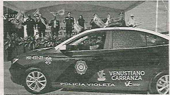
Mejorará seguridad en las calles de la zona

Asimismo, se han realizado 1,200 recorridos de presencia y disuasión en las 78 colonias y en los pueblos del Peñón de los Ba-