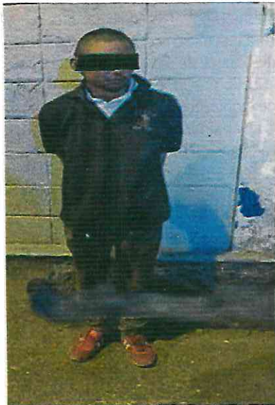
Con las manos en la coladera.

RESUMEN: Masculino de 30 años es detenido por sustraer una tapa de coladera por lo que es puesto a disposición ante la fiscalía.