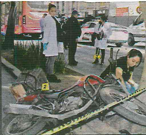
■ Sobre el carril confinado, del lado contrario: la moto abrazada del árbol.