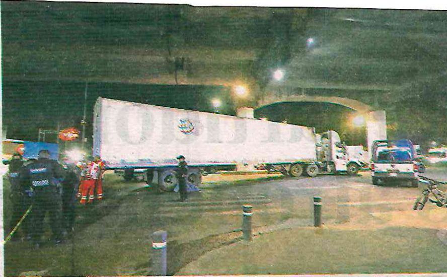
El chofer de la unidad involucrada, quien detuvo la marcha al notar que había pasado sobre algo, permaneció en el lugar y fue puesto a disposición del MP

tema de Bicicletas Públicas de la CDMX, unos tres metros.