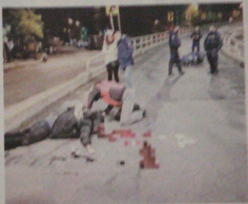
La mezcla del alcohol y la velocidad lo llevó a la muerte

Peritos realizaron las pesquisas correspondientes y trasladaron el cadáver del desconocido al Semefo local