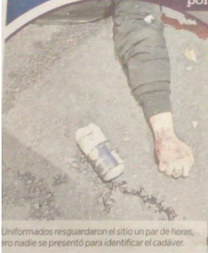
Uniformados resguardaron el sitio un par de horas, pero nadie se presentó para identificar el cadáver.

Las autoridades indagaron si el joven conducía en estado de ebriedad, ya que durante los peritajes fue localizada una lata de cerveza a un costado.