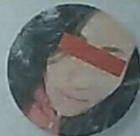
Buscan dar con el paradero de la presunta asesina.

Al ver que ella huía, los hijos del sujeto ingresaron para ver