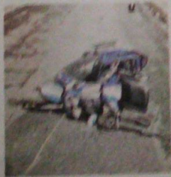
La moto quedó destruida

Al lugar arribaron los servicios de emergencia, cuyos paramédicos tan sólo corroboraron su deceso, junto a su cuerpo quedaron tres latas de cerveza que llevaba y a varios metros de distancia su caballo de acero.