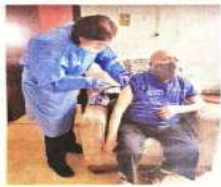
Las 46 brigadas visitaron Magdalena Contreras, Cuajimalpa y Milpa Alta.