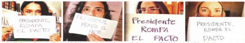
Académicas, artistas, escritoras y ciudadanas se unieron a la campaña luego que el Presidente defendió a Salgado.