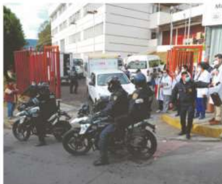
Cuatro motocicletas custodiaron cada brigada

La llegada de la brigada fue recibida con entusiasmo, pero mientras este equi-