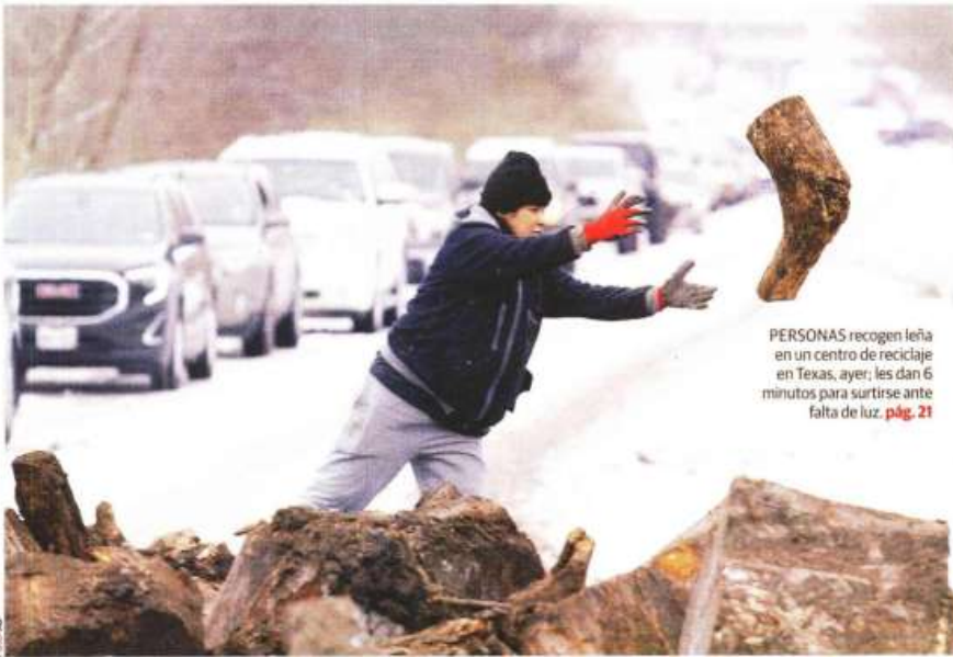
PERSONAS recogen leña en un centro de reciclaje en Texas, ayer; les dan 6 minutos para surtirse ante falta de luz. pág. 21

• Gobierno activa plantas de combustóleo y carbón para ayudar a CFE; además, llega barco con gas natural; paran producción cuatro armadoras. págs. 9 a 11