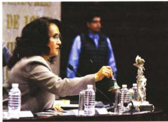
Dolores Padierna, en la sesión ordinaria de la Cámara baja, en febrero de 2020.

A él se sumó el propio Villanueva, “Compañero, coincidido contigo al 100. Quienes construimos #Morena en la Cuauhtémoc desde cero no podemos respaldar la candidatura anunciada por @MorenaPartidoMX”, escribió quien también busca reelegirse en su curul como diputado de la CDMX. “La gente es quien decide y la imposición significa retroceder”, añadió.