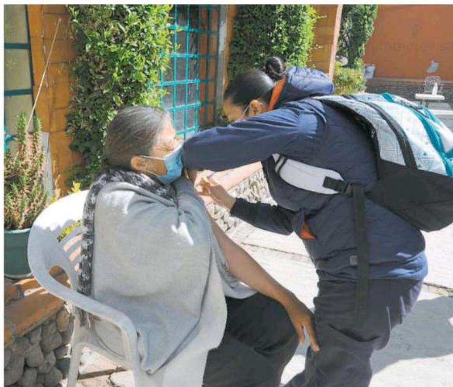
Las brigadas acudirán a casas de descanso y asilos para vacunar a los adultos mayores

"Y es dentro de todo lo que ha significado el Covid en la Ciudad, las dificultades lo que ha sufrido pues muchísimas familias en nuestra ciudad tanto en términos de pérdidas de vidas humanas, de pérdida de familiares como personas enfermas o la situación económica. Claro que está bien que estén bajando las hospitalizaciones".