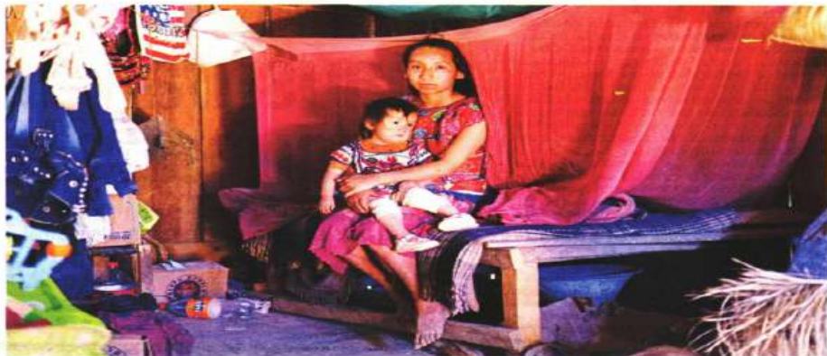
Cochoapa El Grande. — En la comunidad de Lázaro Cárdenas, en La Montaña de Guerrero, no tienen centros de salud y al médico lo vieron por última vez hace un año. Han escuchado hablar del Covid-19, pero, por fortuna, no se han contagiado. No saben si la vacuna llegará hasta ellos. | ESTADOS | A12