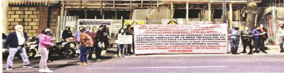
ALZAN LA VOZ. Vecinos de Álvaro Obregón han denunciado diversas obras y acciones que amenazan la Barranca de Tarango.