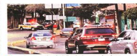
La protesta causó embotellamiento, pero el reclamo fue escuchado por la Alcaldía.