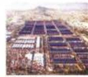
13 Mil 852 toneladas de CO 2 reducidas anualmente 73.5 MDP ahorrados en luz por año

Construcción fotovoltaica en Central de Abasto busca generar luz equivalente a consumo de 15,200 viviendas. pág. 8