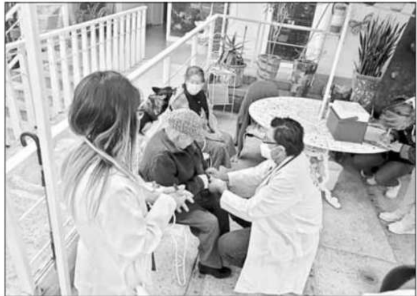
▲ Con el apoyo de 20 brigadas formadas por personal de la Secretaría de Salud de la Ciudad de México, ayer comenzó la vacunación en las alcaldías Cuajimalpa, Magdalena Contreras y Milpa