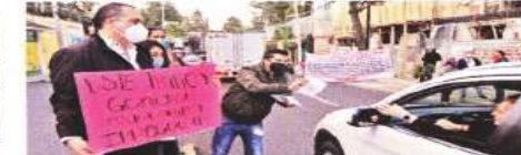
Colonos cuestionan el proyecto que el Instituto de Vivienda realiza en Centenario 1812.

La edificación es parte de las obras irregulares que gradualmente urbanizan la Barranca de Tarango; a pesar de que había sido declarada Área de Valor Ambiental, para proteger el área verde a partir de la construcción de la Supervía del Poniente.