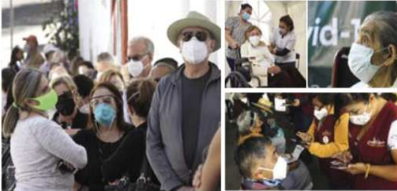
Faltan casi tres mil adultos mayores por vacunar en Cuajimalpa, Milpa Alta y Contreras.