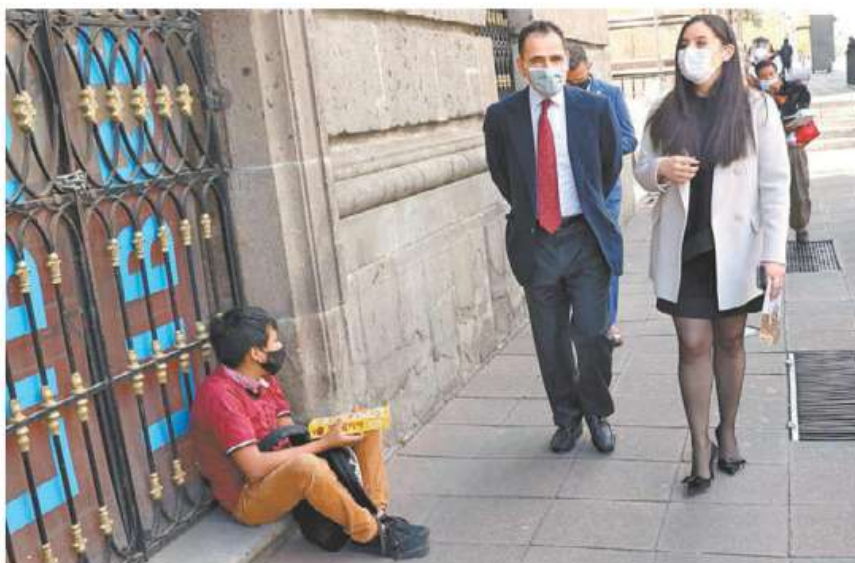
El secretario de Hacienda, Arturo Herrera, sobre la calle 5 de Mayo.