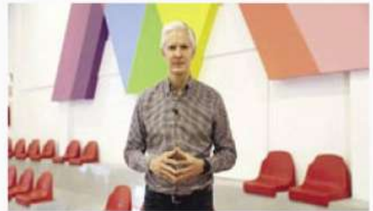
CHICONCUAC, Méx.- Alfredo del Mazo.

"Quiero agradecer mucho al personal del sector salud que nos está ayudando en este proceso; hay más de 400 vacunadoras en el Estado de México, que forman parte del sector salud, y que nos están ayudando en 48 centros de vacunación a poder atender a quienes se está aplicando ya esta vacuna", externó.