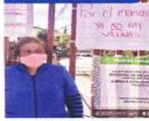
La vecina Pilar visitó ayer 4 centros de vacunación.