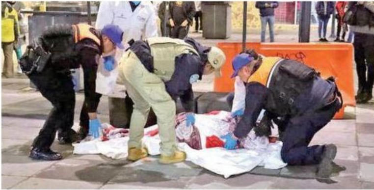
El hombre de la tercera edad quedó tendido en el piso tras morir de frío