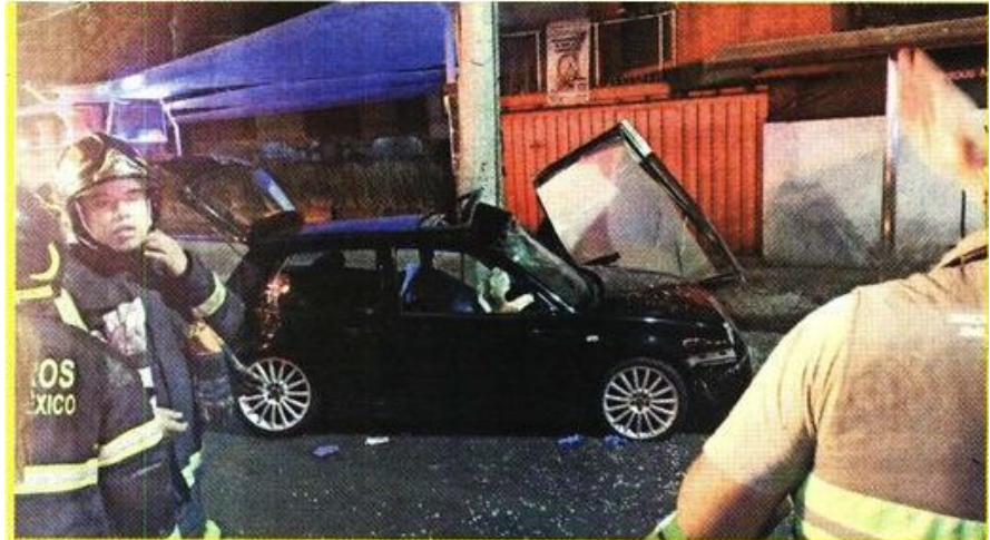
La autopsia revelaría si el hombre al volante del Golf negro manejaba en estado de ebriedad.

El automovilista no fue identificado en el lugar del accidente.