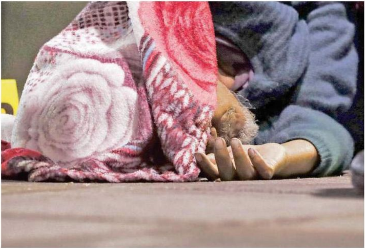
Todo parece indicar que el abuelito vivía en condición de calle por la Plaza Garibaldi