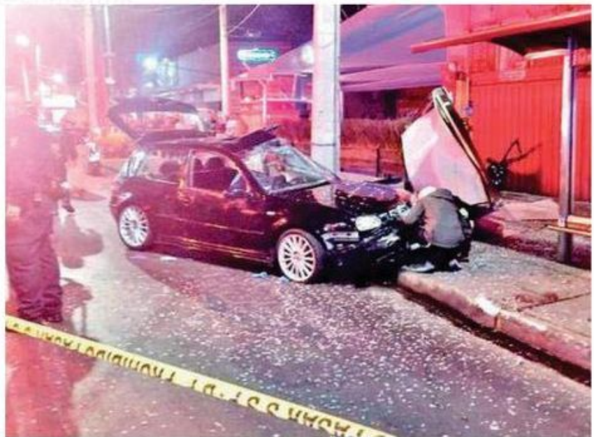
Un automovilista murió tras chocar en Coyoacán; al parecer iba a gran velocidad

Horas más tarde, integrantes del área pericial y Forense de la Fiscalía capitalina llegaron al sitio y tras recabar los indicios necesarios para esclarecer los hechos procedieron a realizar el levantamiento del cadáver para trasladarlo al anfiteatro correspondiente.