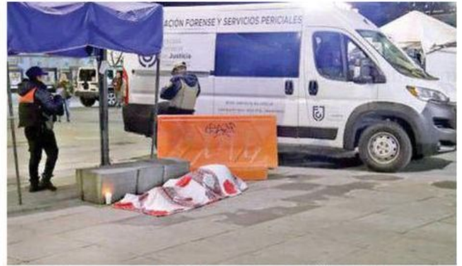
Los servicios de emergencia llegaron, pero ya nada pudieron hacer por él