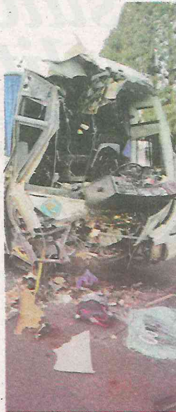
•El impacto fue brutal

El impresionante accidente se presentó alrededor de las 5 de la mañana en el kilómetro 37, con dirección a la Ciudad de México, a la altura