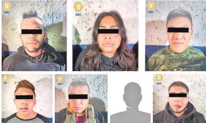
Los siete detenidos, que, según autoridades policíacas, presuntamente son integrantes del Cártel Jalisco Nueva Generación