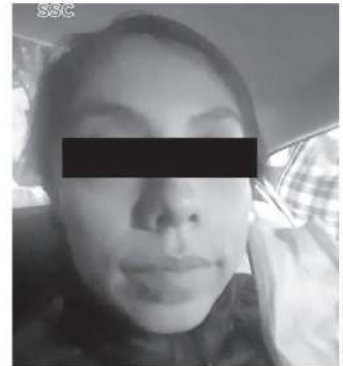
Otra detención por el caso

Se espera que en las próximas horas sean cumplimentada otras órdenes de aprehensión contra otros implicados en los hechos, como lo adelantó el secretario de Seguridad Ciudadana de la Ciudad de México, Omar García Harfuch .