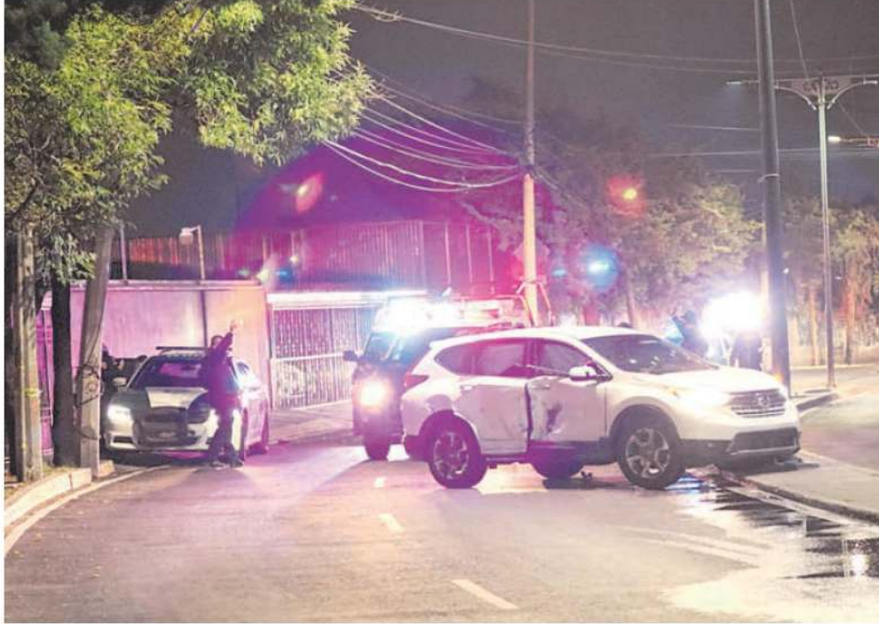
Entre los siete detenidos hay dos con antecedentes penales, indicó la SSC