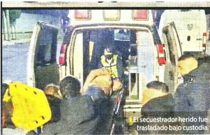
El secuestrador herido fue trasladado bajo custodia.