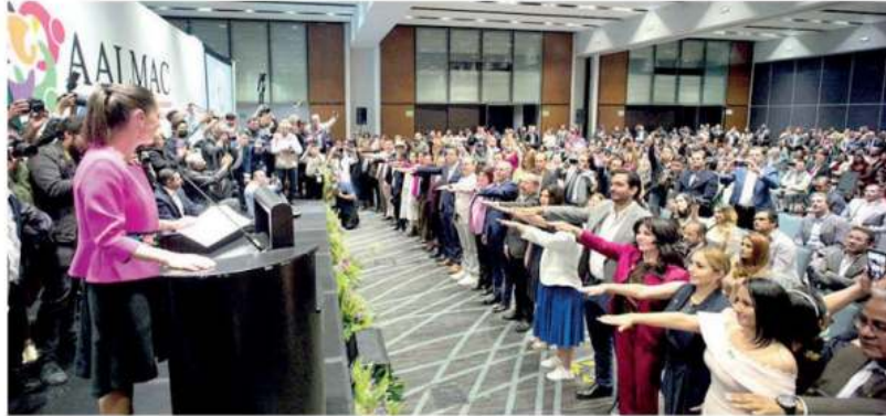
Con presidentes municipales del país