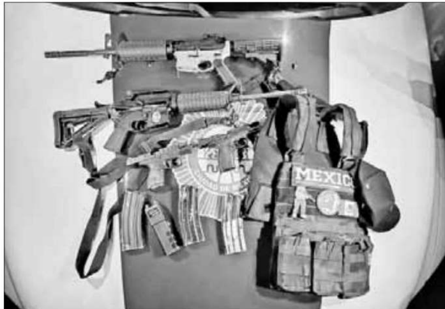
lugares. Un efectivo de la SSC murió, al igual que dos mexiquenses y uno de los atacantes.