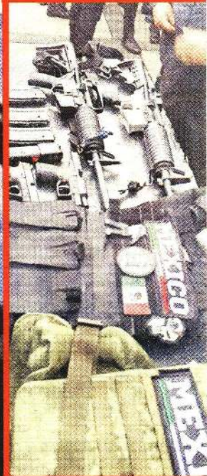
LOS HÉROES. Los agentes murieron en cumplimiento de su deber.