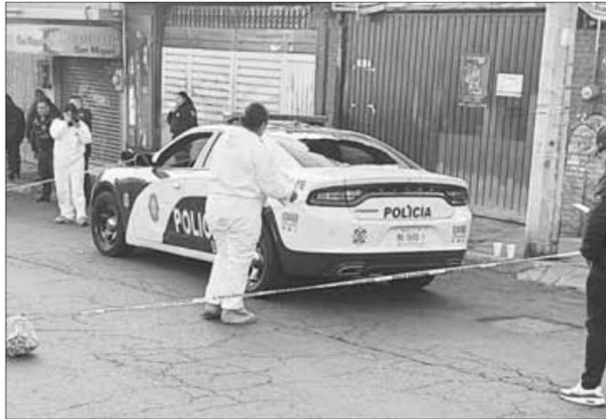
▲ Gran movilización policiaca y alarma entre vecinos que despertaron por el ruido de sirenas y proyectiles en la alcaldía Álvaro Obregón, tras el intercambio de fuego en dos