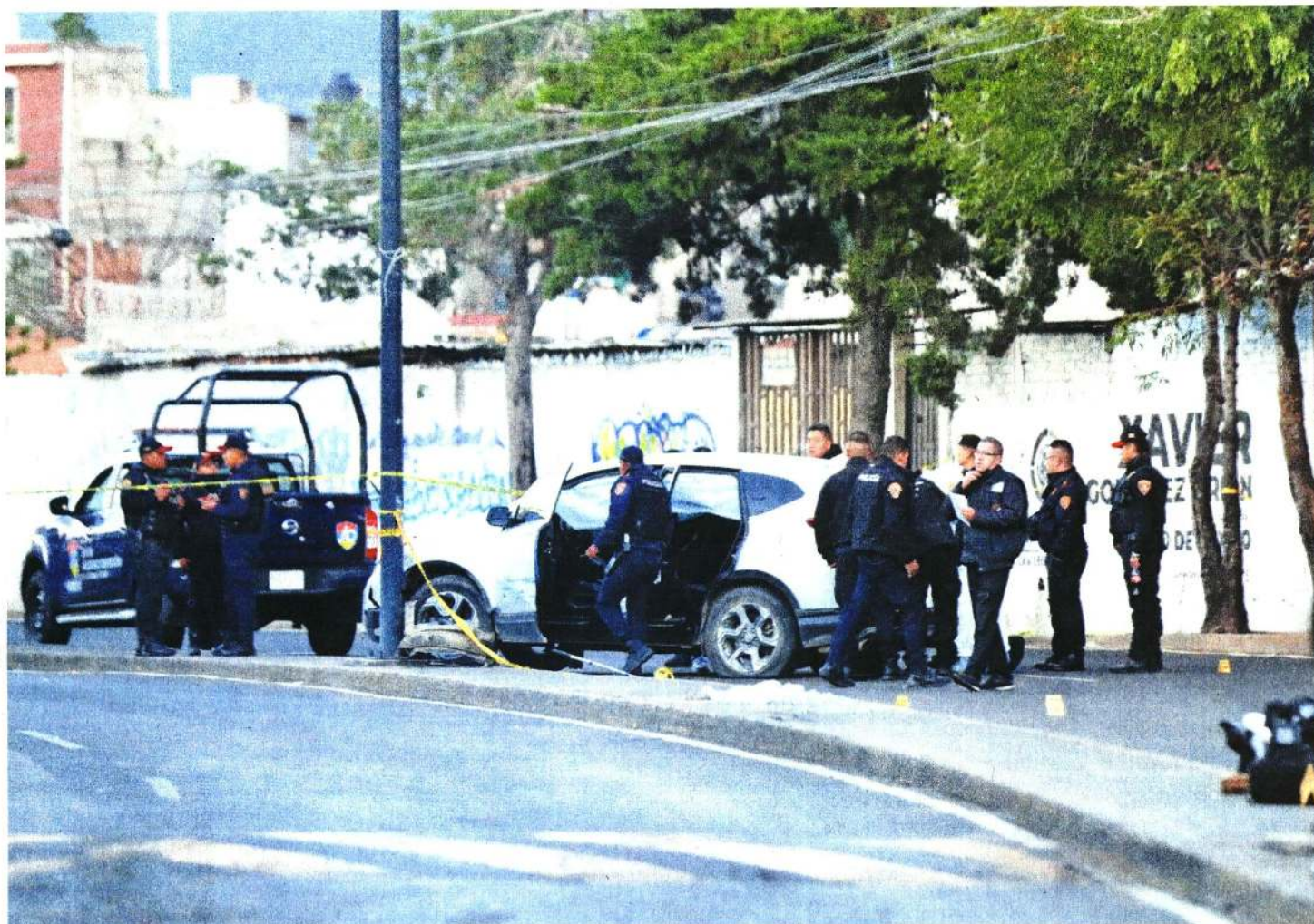
Los presuntos criminales viajaban en una camioneta CRV-Honda color blanco, sin placas, portaban armas largas y cortas, así como chalecos balísticos.