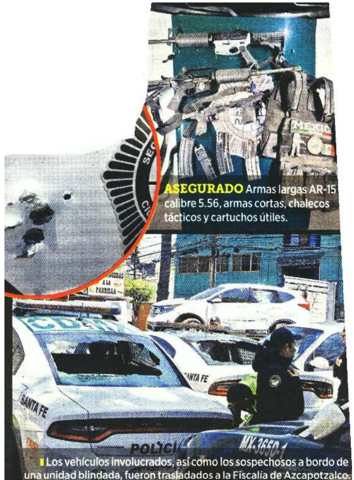
ASEGURADO Armas largas AR-15 calibre 5.56, armas cortas, chalecos tácticos y cartuchos útiles.