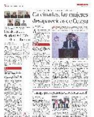
FICHA POLICIAL de los siete detenidos en la alcaldía Álvaro Obregón compartida por la SSC en redes sociales, ayer.