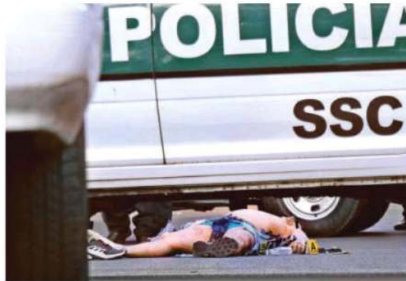
Uniformados a bordo de una patrulla del sector Santa Fe fueron atacados a la altura de la colonia Tlacuitlapa