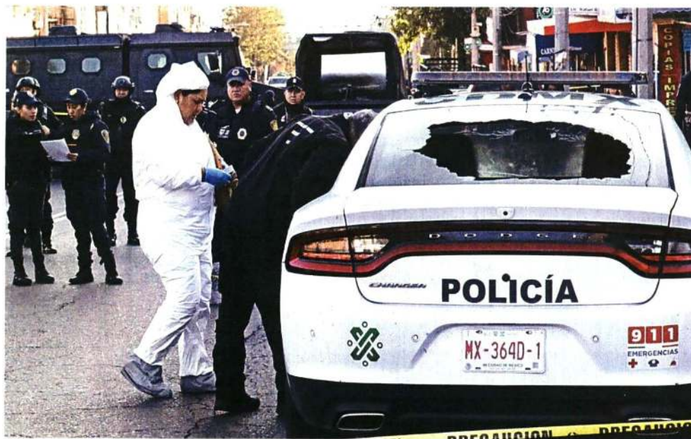
Peritos y policías llegaron a la colonia Arcos del Centenario, donde culminó la persecución.