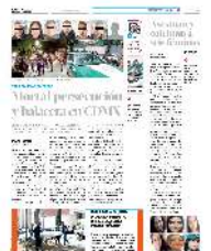
Los delincuentes dispararon con armas de alto poder