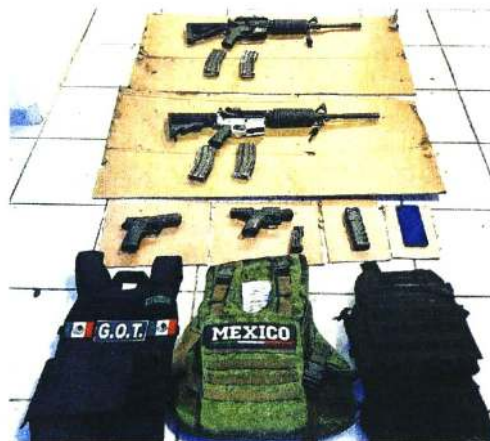
Autoridades aseguraron armas largas y chalecos balísticos.