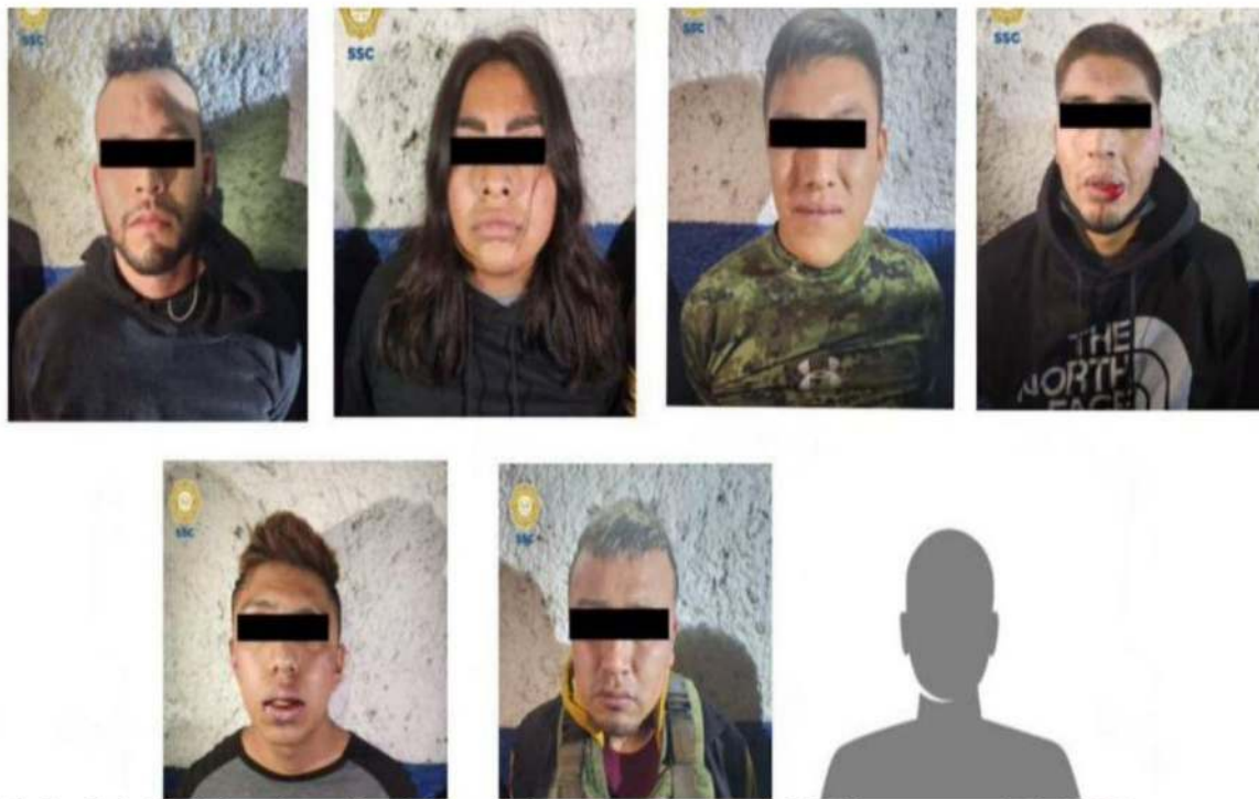
El titular de la SSC informó que dos de los policías que murieron eran del Edomex y uno de la CDMX.