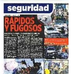
Los vehículos involucrados, así como los sospechosos a bordo de una unidad blindada, fueron trasladados a la Fiscalía de Azcapotzalco.