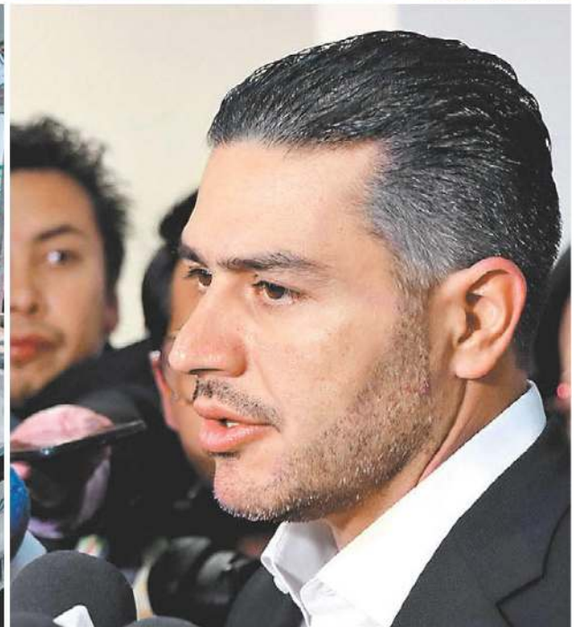
Casa donde retenían a víctimas, patrulla con impactos de bala y el jefe policiaco.