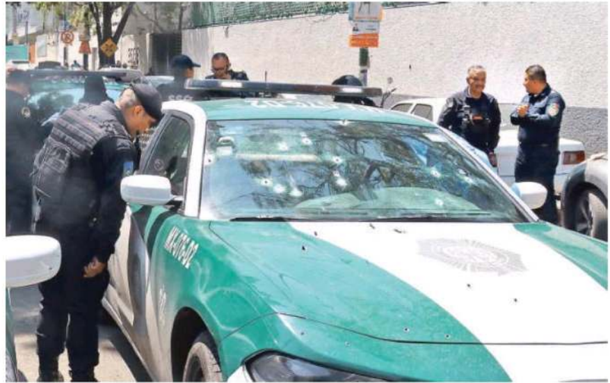
La patrulla con matrícula MX-076-D2 fue alcanzada por las balas y un uniformado falleció