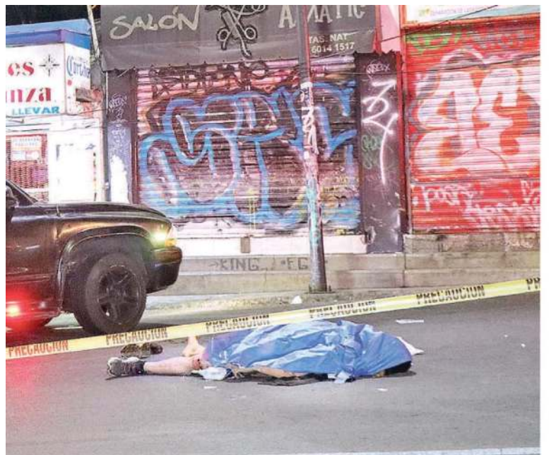
Dos policías municipales perdieron la vida luego de que protagonizaron un enfrentamiento a tiros con presuntos integrantes del Cártel Jalisco Nueva Generación