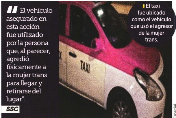
El vehículo asegurado en esta acción fue utilizado por la persona que, al parecer, agredió físicamente a la mujer trans para llegar y retirarse del lugar”.