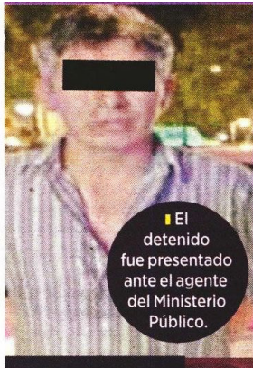
El detenido fue presentado ante el agente del Ministerio Público.