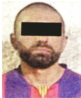
El presunto atacante, de 29 años, fue llevado ante el MP.

“Valoraron al otro uniformado, quien presentó una herida a la altura del tórax y tres heridas en el cuerpo, por lo que fue canalizado a un hospital cercano”, detalló la Policía capitalina.