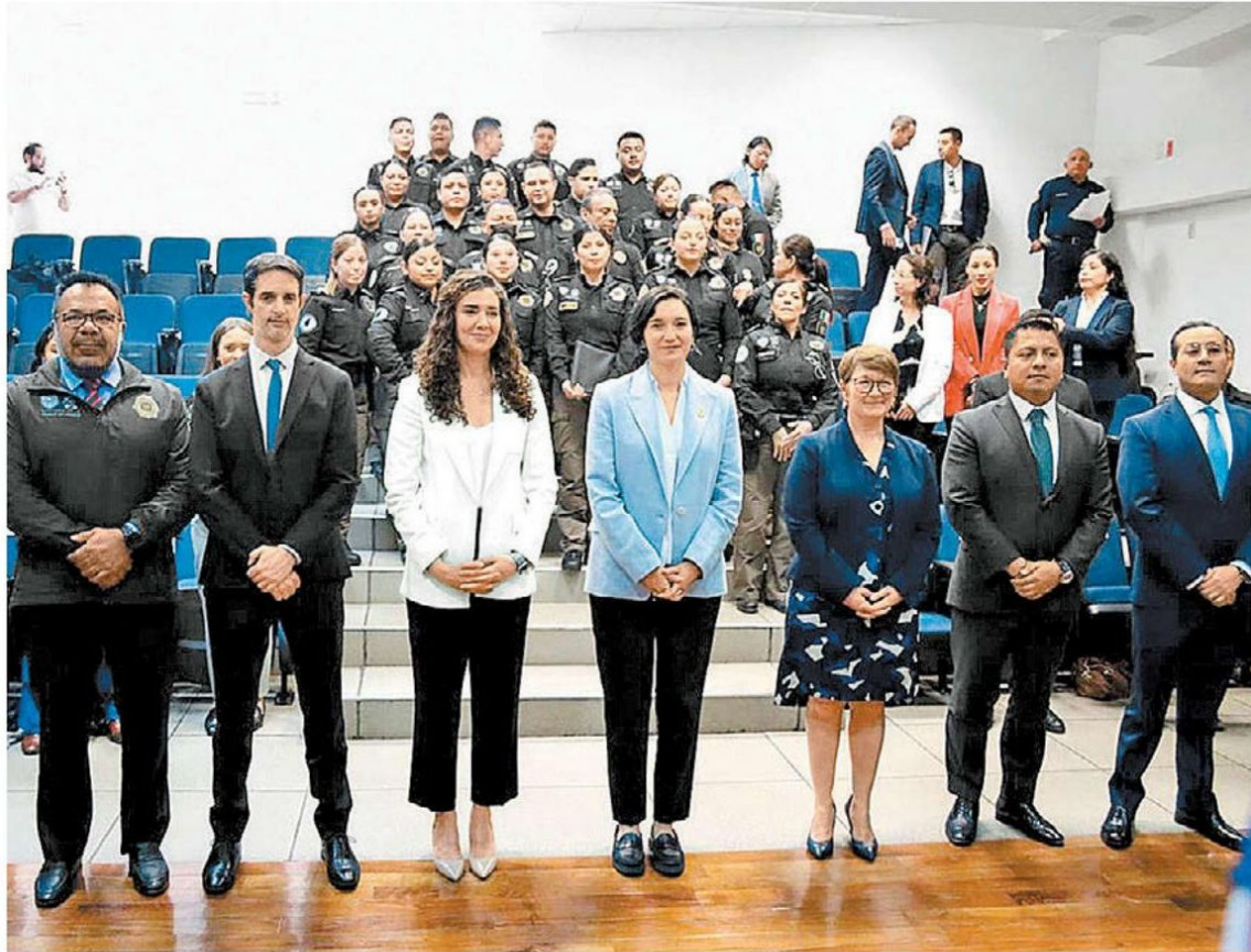
La Secretaría de Seguridad Ciudadana es la primera institución en recibir el curso.