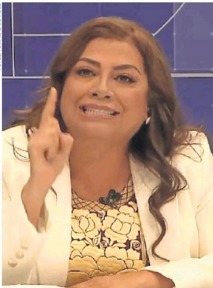
Clara Brugada Coalición "Sigamos haciendo historia en la Ciudad de México" morena