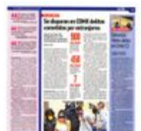
En 2023, fueron encarceladas por extorsión nueve personas extranjeras; en 2021, solo una.