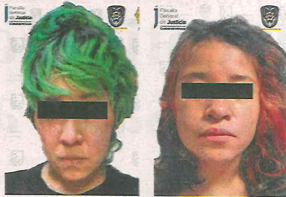
Fueron presentadas ante un juez de control por su probable participación en delitos contra la salud

Cabe mencionar que durante la inspección al inmueble fueron encontrados un megáfono, una caja con botellas con líquido (aparentes bombas molotov), cohetones y una bolsa con vegetal verde, cuyas características son similares a la marihuana, así como las tres personas al interior.