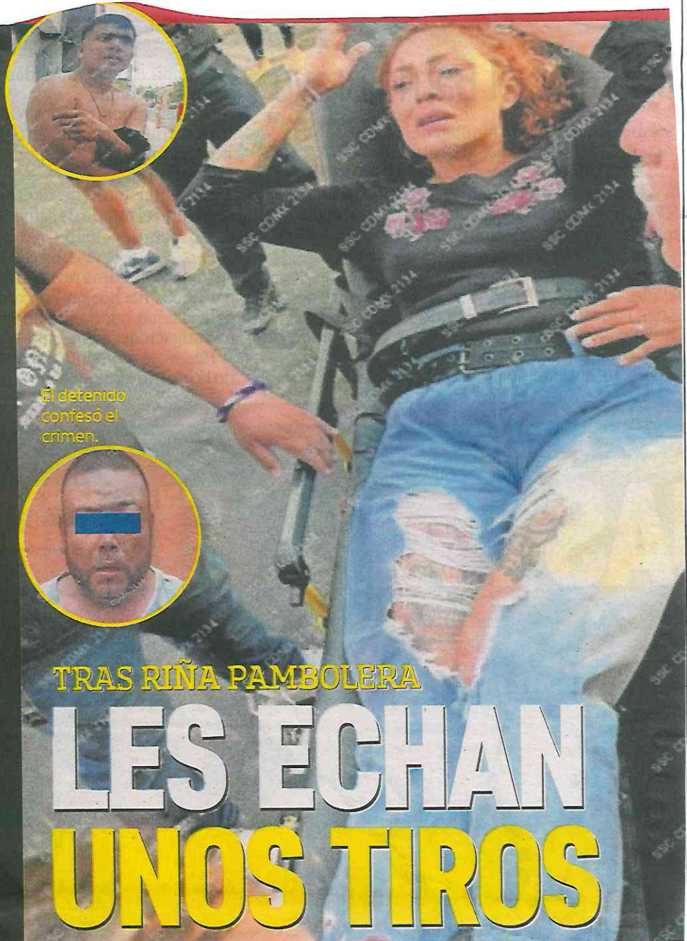
El detenido confesó el crimen.