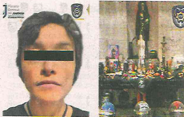
El altar a la muerte hallado durante el cateo para recuperar el inmueble

Durante la inspección al inmueble fueron encontrados un megáfono, una caja con botellas con líquido (aparentes bombas molotov), cohetones, una bolsa con vegetal verde, cuyas características son similares a la marihuana, y un altar a la muerte