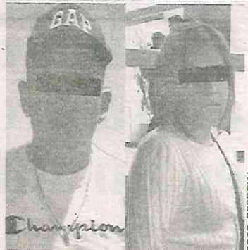
Derechito al bote

El detenido cuenta con un ingreso al Sistema Penitenciario de la Ciudad de México, en el año 2013 por robo calificado