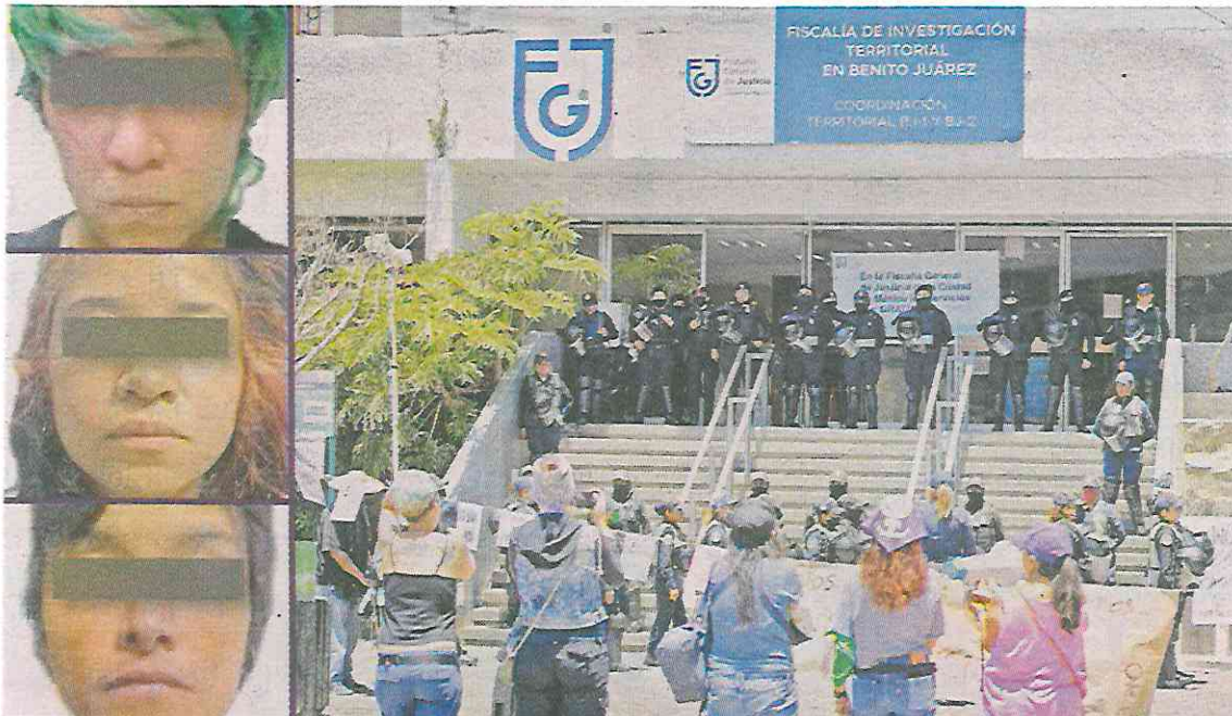
■ Un grupo de feministas protestó frente a las instalaciones de la Fiscalía en la Alcaldía Benito Juárez para exigir la liberación de sus tres compañeras.

La FGJ informó que ayer presentó ante un juez de control a las tres por su posible participación en la comisión de delito contra la salud.