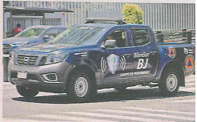
La Alcaldía Benito Juárez palomea las propuestas ciudadanas para comprar vehículos para patrullas y motopatullas.

“(Solicitamos) previa la secuela procesal correspondiente, revocar los actos reclamados y pronunciarse so-