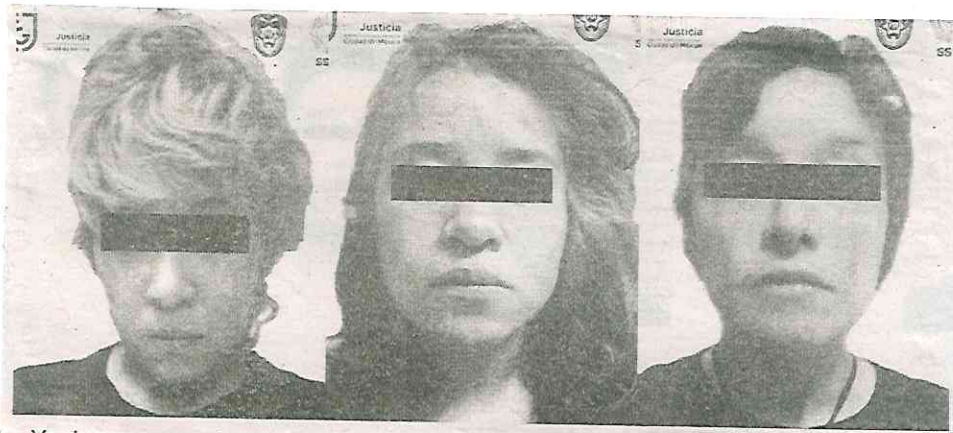
Ya duermen en el penal de Santa Martha