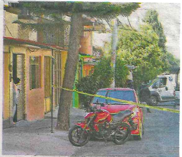
Una vez escucharon las detonaciones los vecinos salieron a ver lo que pasó