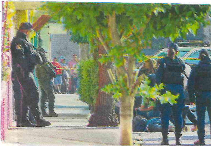
Una vez consumado el homicidio, dos sujetos huyeron a toda prisa a bordo de una motocicleta

Una mujer de edad avanzada de cabello largo y canoso, llegó corriendo en compañía de otros familiares con lágrimas que recorrían sus mejillas, mientras gritaba "no, no, no, por favor no", al estar al lado de la víctima se arrodilló y soltó en llanto desgarrador.